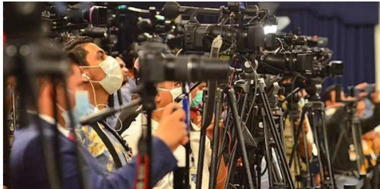
La APES anuncia el cierre de sus oficinas hasta nuevo aviso, y la renuncia al derecho de ejecutar proyectos con fondos de cooperación internacional, debido a la LAEX.

La APES aclaró a los periodistas que seguirá prestando sus servicios de registro y denuncia de agresiones y vul-