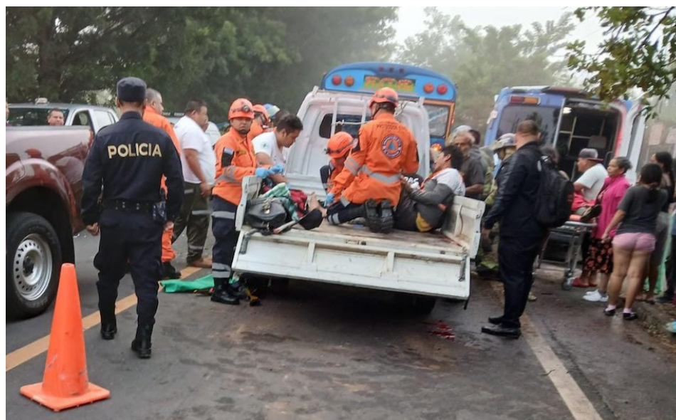
Las personas lesionadas se transportaban en el camión que colisionó con el bus y quienes fueron trasladadas por cuerpos de socorro, PNC entre otros a un centro asistencial cercano, para su atención.

compartidas por la institución, uno de los lesionados es un gestor de tránsito.