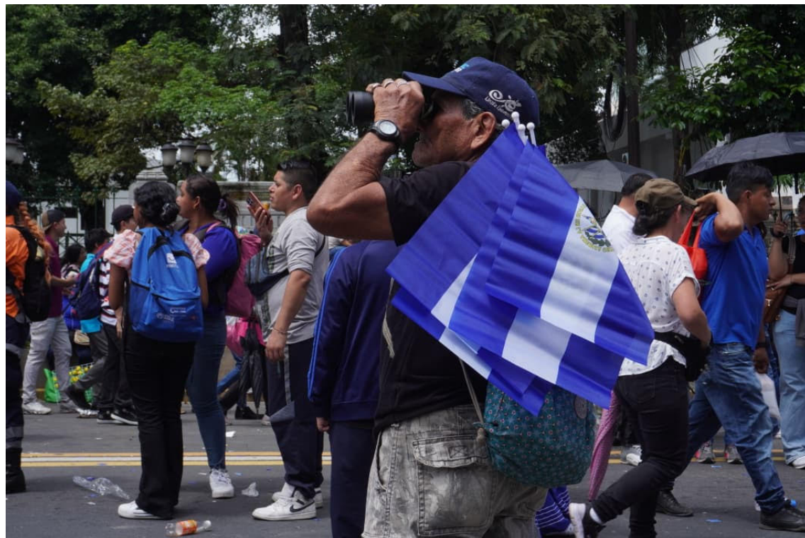
“Un nuevo El Salvador nace con nuestro propio modelo, el modelo salvadoreño, hecho por nosotros y para nosotros”, comenta Bukele en discurso del 15 de septiembre.

El mandatario sostuvo que el hecho de que “haya funcionado y que ahora otros países incluso vienen a inspirarse con lo que nosotros hemos hecho, es la mayor prueba de nuestra independencia. Hacer lo nuestro y que funcione. La seguridad