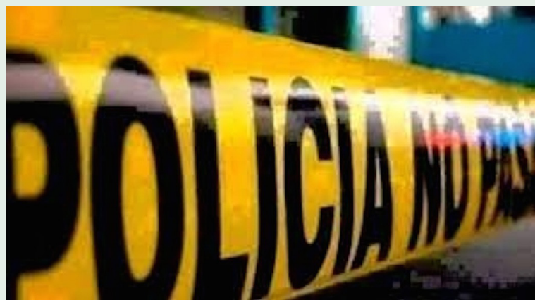
La PNC reportó un homicidio en Tacuba, Ahuachapán Centro, por lo que se realizaban investigaciones para lograr la captura del responsable del crimen.

nes trabajan para capturar al responsable”, cita la publicación de la PNC y agrega que la víctima no ha sido identi-