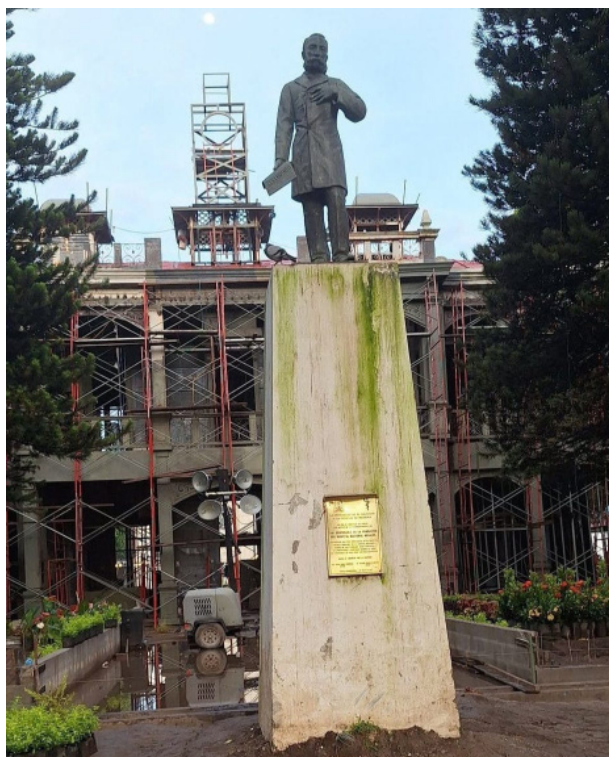
Por años el Hospital Rosales atendió a miles de personas, con su remodelación abre la puerta a una privatización de la salud.

Según el funcionario, el personal que labore en el nuevo Rosales únicamente lo hará allí, como lo establece el artículo 30 de la Ley de Creación de