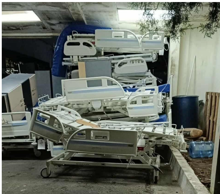
El equipo y camillas del hospital Rosales fue trasladado al hospital Central, en la calle Guadalupe, frente al Ministerio de Educación.

La fuente dijo que desde inicios de esta semana comenzaron a trasladar el equipo que aún quedaba en el antiguo hospital Rosales, pero la noche del jueves desalojaron las instalaciones. Desde este 12 de septiembre dejó de atender pacientes, sin una programación adecuada, de