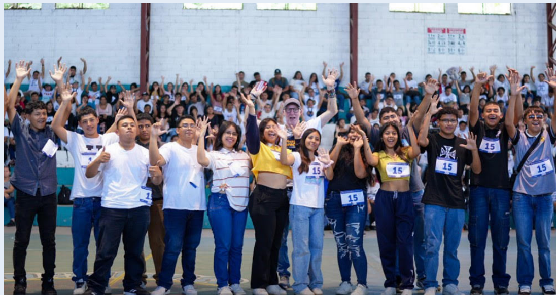
Con los fondos, según el oficialismo, se impulsarán los programas que ejecuta la Dirección de Integración, como la entrega de becas, atención a adultos mayores y acercamiento a los servicios de salud.

La reforma a la Ley de Presupuesto 2025, que contó con 54 votos, permitirá financiar el servicio de alimentación y transporte para los beneficiarios de los programas que di-