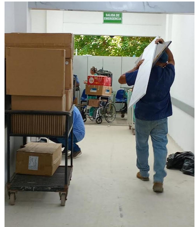
La noche del 11 de septiembre desalojaron las instalaciones del hospital Rosales.

El préstamo aprobado fue de $170 millones durante el último período presidencial del FMLN, parte de este fondo para la remodelación del Rosales, construcción del nuevo hospital en Nejapa, casas de Espera Materna, clínicas de prevención de enfermedades crónicas, mejora en 350 unidades de salud, obras en el hospital Saldaña, sin embargo, al iniciar el mandato Nayib Bukele, ninguna de esas obras se ha llevado a cabo.