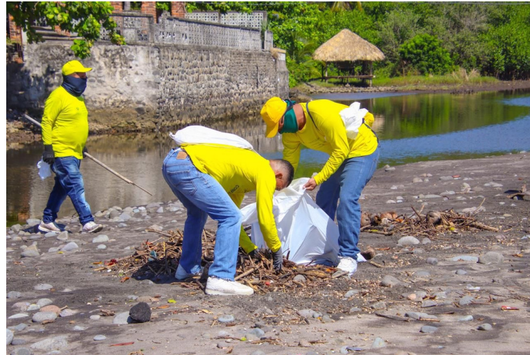
Hacienda ha pedido a la Asamblea Legislativa que modifique el presupuesto 2025 para incorporar $10 millones a la Dirección General de Centros Penales.

La iniciativa será discutida en la Comisión de Hacienda y Especial del Presupuesto, la cual sesionará el próximo martes, donde dictaminarán y pasará al pleno para su aprobación.