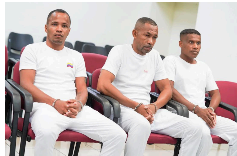
Los tres sujetos fueron enviados a prisión provisional mientras el caso sigue en sede judicial.