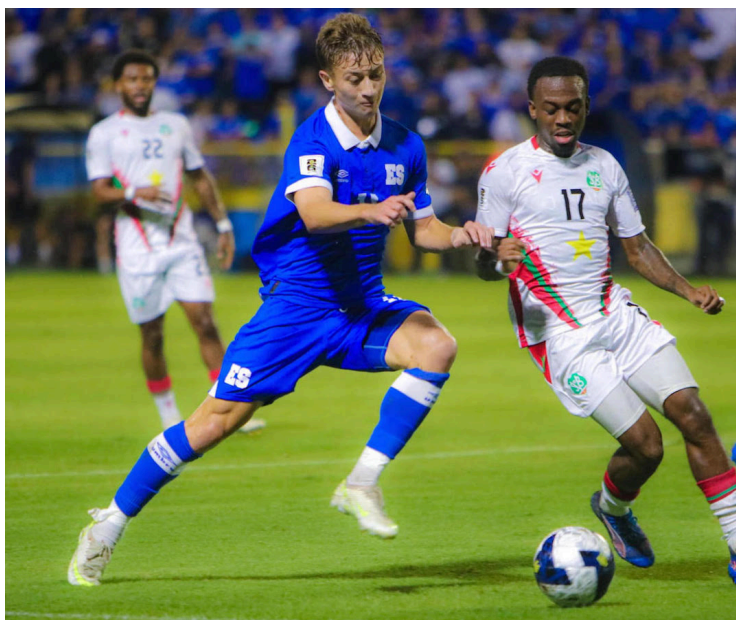
El Salvador enfrenta a Surinam en las eliminatorias de CONCACAF, en el estadio Cuscatlán.

“Queremos anunciar que, tras una variedad de gestiones y atendiendo el clamor popu-