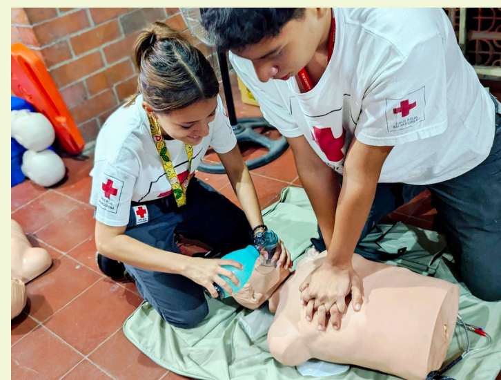
Durante el evento, los asistentes podrán realizar prácticas de primeros auxilios que les servirán para situaciones de emergencia.

En la mayoría de los casos, son testigos y transeúntes quienes prestan la primera asistencia. Cuando cuentan con la capacitación adecuada, pueden tratar lesiones menores y mantener estables a las víctimas hasta la llegada del personal especializado.