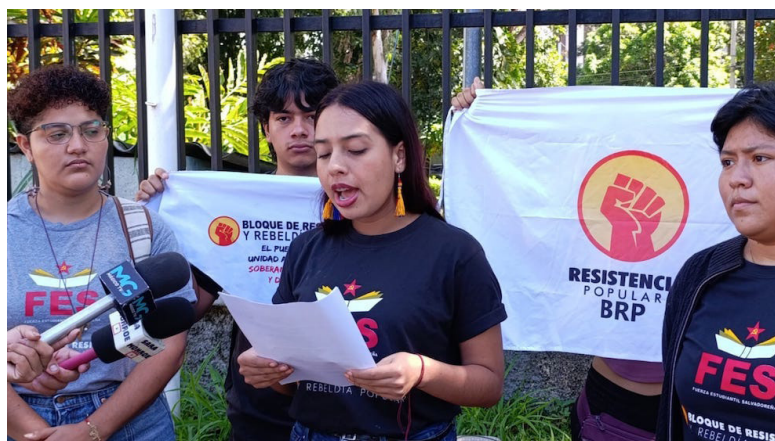
La Fuerza Estudiantil Salvadoreña (FES) que forma parte del Bloque de Resistencia y Rebeldía convocan a la comunidad universitaria a la marcha del próximo 15 de septiembre.

te de un mismo modelo, que niega la educación como derecho y la coloca al servicio de intereses políticos y mercantiles, nos movilizamos para denunciar estas injusticias, rechazar la militarización de la educación y exigir la dignidad que como pueblo, estudiantes y trabajadores merecemos, por una educación pública, gratuita, crítica y emancipadora”, externaron.