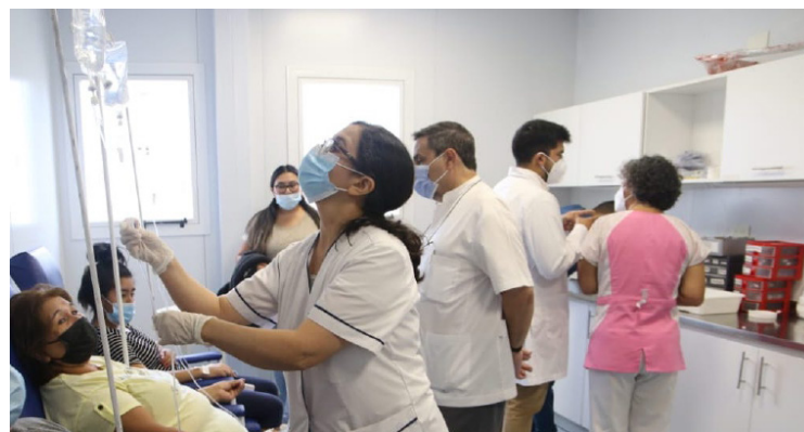
El Colegio Médico señala que la Red Nacional de Hospitales, abre la puerta a una posible privatización de la salud pública.

A criterio del presidente del Colegio Médico, conociendo cómo funcionan este tipo de situaciones, la Red Nacional de Hospitales abre la puerta a una posible privatización de la salud pública, aunque no se puede afirmar categóricamente, pero tampoco descartar que esto sea parte de los objetivos finales de