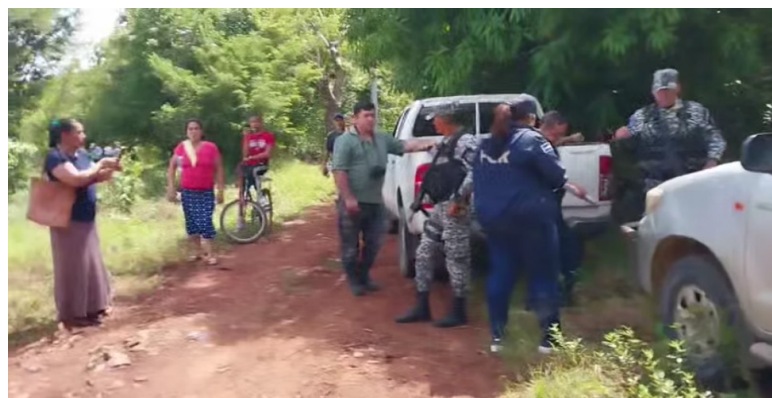
MILPA El Salvador denuncia la presencia de agentes de la PNC, personal del CNR y FGR en la comunidad La Lima, La Unión.

M ILPA El Salvador denunció que agentes de la Unidad Criminalística, Unidad Antipandillas, personal del Centro Nacional de Registros (CNR) y la Fiscalía General de la República (FGR) irrumpieron en la comunidad La Lima del cantón La leona, Intipucá, La Unión, bajo el supuesto de una diligencia e inspección.