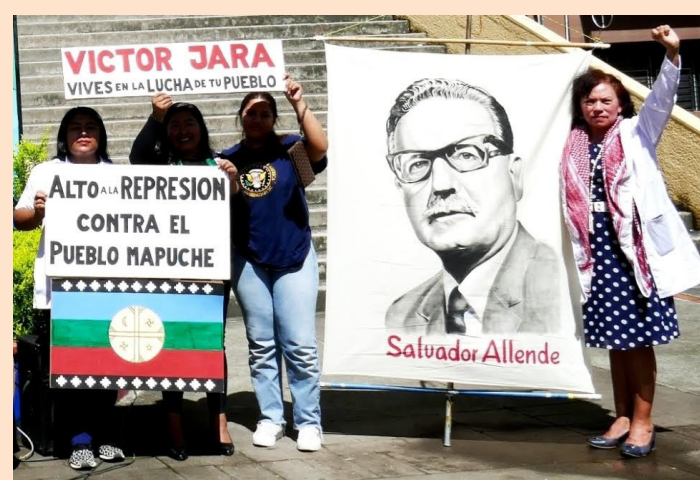
La vida y el legado de Salvador Allende fue recordado este jueves, en la Plaza que lleva su nombre frente a la Facultad de Medicina de la UES.

Justo al pie del monumento, en la Plaza que lleva su nombre frente a la Facultad