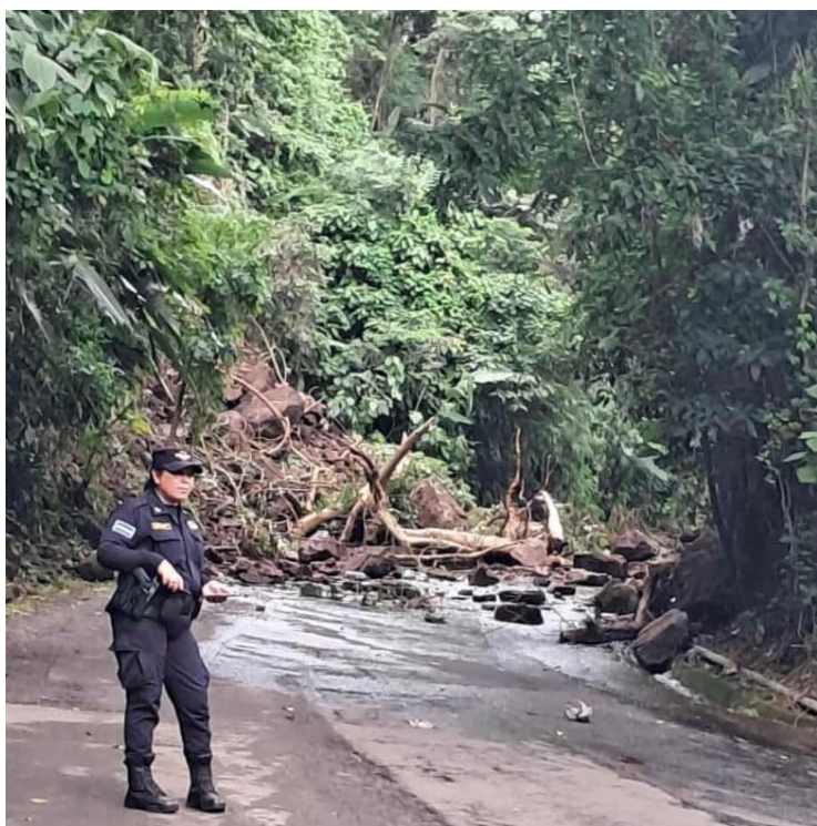
Debido a las lluvias se reportó un derrumbe sobre la carretera de Jujutla, Ahuachapán, en las cercanías del río Zapúa.