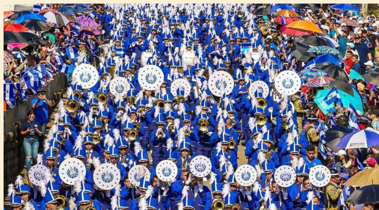
En el desfile del 15 de septiembre participará la Banda El Salvador, que iniciará desde la plaza Salvador del Mundo y finalizará en el parque Cuscatlán.

“Vamos a tener una presentación del Ballet Folclórico Nacional, con la pieza Mujer de las Américas, además, acompañará la Banda El Salvador con su puesta en escena, esto será a partir de las 5:00 p. m. Luego, a las 8:00 p. m. habrá espectáculo de drones, quema de pólvora y un concierto de la Orquesta Internacional Hermanos Flores”, sostuvo el titular del Ministerio de Cultura, Raúl Castillo.