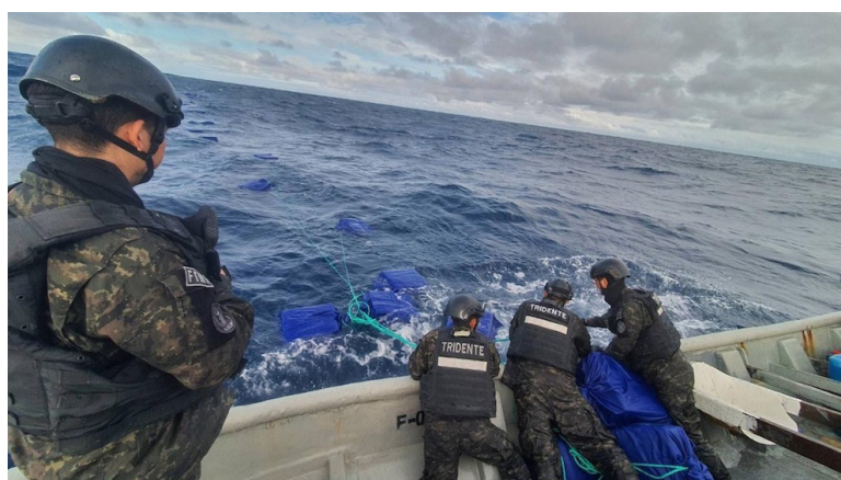
La Marina Nacional recupera la droga que fue arrojada en altamar por estructuras criminales.

“Nuestra Marina Nacional vuelve a golpear al narcotráfico internacional. A 900 millas náuticas (1,667 km) al suroeste de la Bocana El Cordoncillo, Estero de Jaltepeque, ubicamos bultos con cocaína flotando en