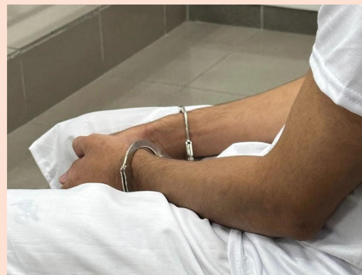
El motivo o las razones del intento de homicidio no fueron informados por las autoridades.

La institución policial también reportó el homicidio de una mujer de 21 años en Nuevo Cuscatlán, La Libertad Este.