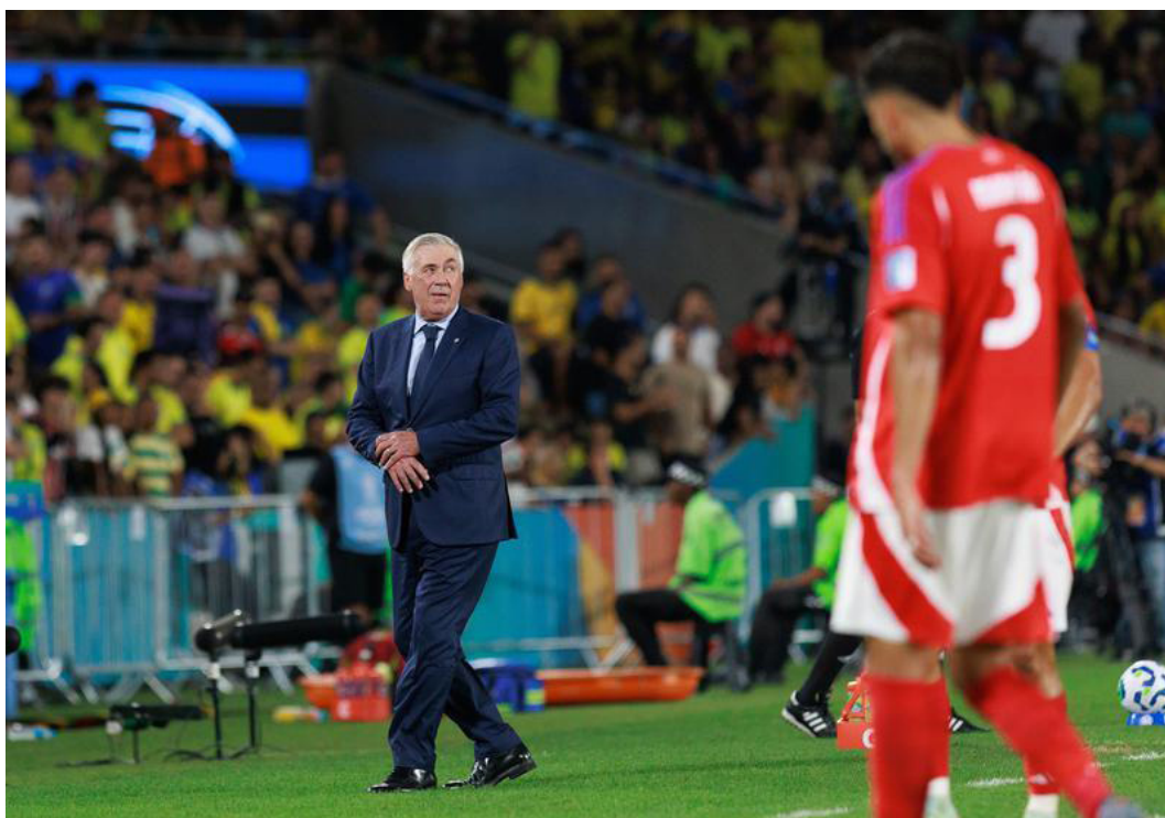
El director técnico Carlo Ancelotti (i), de Brasil, reaccionando durante el partido ante Chile correspondiente a las Eliminatorias Sudamericanas para el Mundial de Estados Unidos, México y Canadá 2026, celebrado en el Estadio Maracanã, en Río de Janeiro, Brasil.

Bolivia quedó séptima y tendrá la oportunidad de disputar un repechaje para acceder por segunda vez en su historia a la máxima cita planetaria del fútbol.