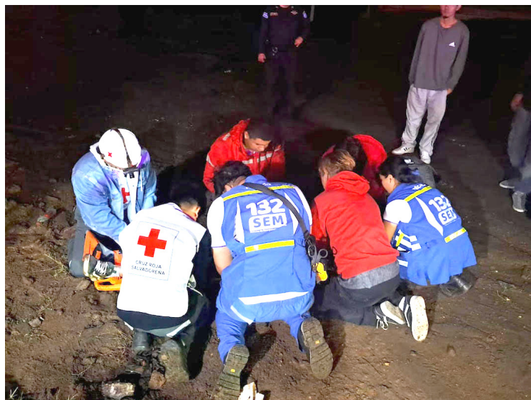
Motociclistas se mantienen como los principales afectados por siniestro viales.

En cuanto a los fallecidos, la distracción al volante fue la