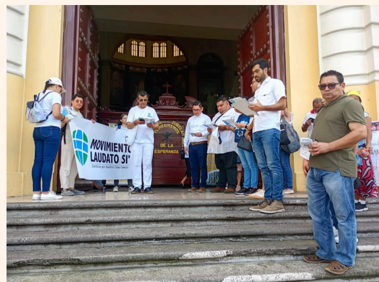
La peregrinación inicio en la Plaza Morazán hasta Catedral Metropolitana.

La peregrinación inició en la Plaza Morazán, continuó con una misa en la Cripta de Catedral Metropolitana, una visita al museo y un encuentro con ani-