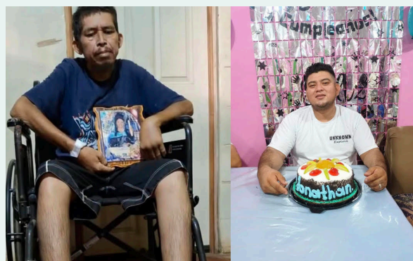
Movir señala que familias de víctimas del régimen se esfuerzan por llevar paquetes a los privados de libertad, muchos de los cuales mueren por falta de alimentación.

Peor aún, la Policía Nacional Civil (PNC) y la Fiscalía General