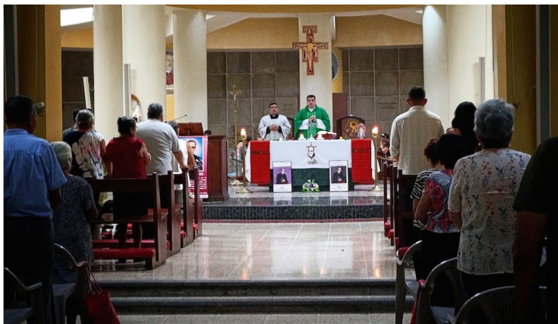
La misa de la Cripta de la Catedral Metropolitana de San Salvador estuvo presidida por el párroco de la Iglesia de Candelaria.

Durante la celebración, la comunidad realizó varios signos simbólicos: la presentación de la Biblia como fuente de sabiduría para conocer los designios de Dios; una vela encendida en honor a la Virgen María, cuya natividad se celebraría al día siguiente, recordando su misión de protectora y Reina de la Paz; y una cruz, como recordatorio del sacrificio y desprendi-