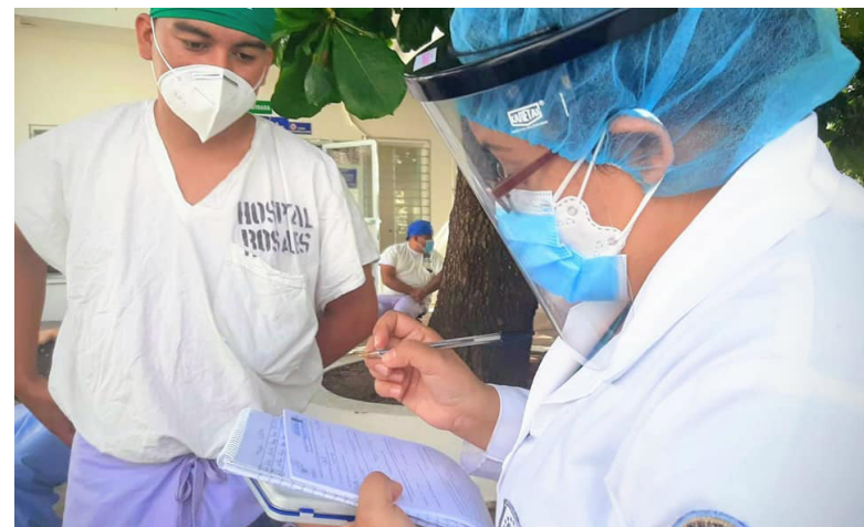
Cerca de 40 especialistas han renunciado del Hospital Nacional Rosales, lo cual provocó traslados arbitrarios de médicos a otros centros asistenciales.

“Condenamos dichas acciones irresponsables, todas las consecuencias serán ocultadas en las ci-