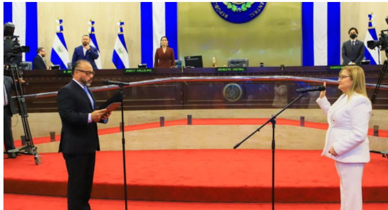
Momentos en que el presidente de la Asamblea Legislativa, Ernesto Castro juramenta a Raquel Caballero en 2022.

“Nunca habíamos experimentado desde esa época una violación masiva y sistemática a los derechos humanos de la población salvadoreña por