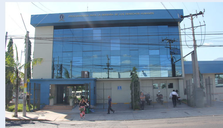
La institución no ha actuado sobre las víctimas del régimen de excepción, vigente desde marzo de 2022, en ese periodo se han violentado los DDHH de miles de personas que nada tienen que ver con pandillas.

no se le ayuda a la gente como se debería; “cuando la cabeza no funciona el resto no funciona, ese es el problema que nosotros tenemos”.