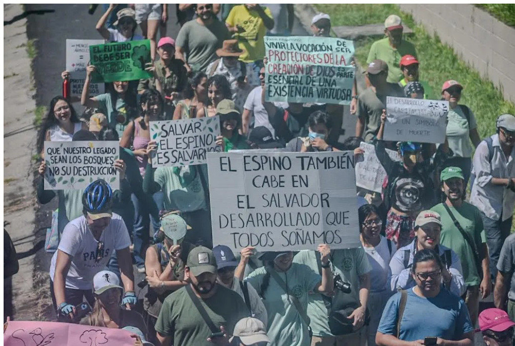
El Movimiento ha realizado marchas, para hacer conciencia de que no se destruya el medio ambiente, principalmente en el terreno propiedad del Ministerio de Hacienda en la Finca El Espino.

El área para construir el CIFCO es de aproximadamente 9 manzanas, es un ecosistema que alberga ardillas, mapaches, tatuacines, cotuzas, armadillos y venados, tucanes, torogoces, garrobos, iguanas y serpientes no venenosas entre otros. Y cuen-