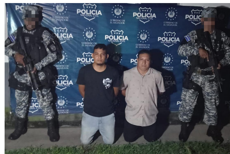
La PNC detiene a los sujetos responsables de un homicidio ocurrido el primero de septiembre.

El martes 2 de septiembre, la Policía Nacional Civil informó