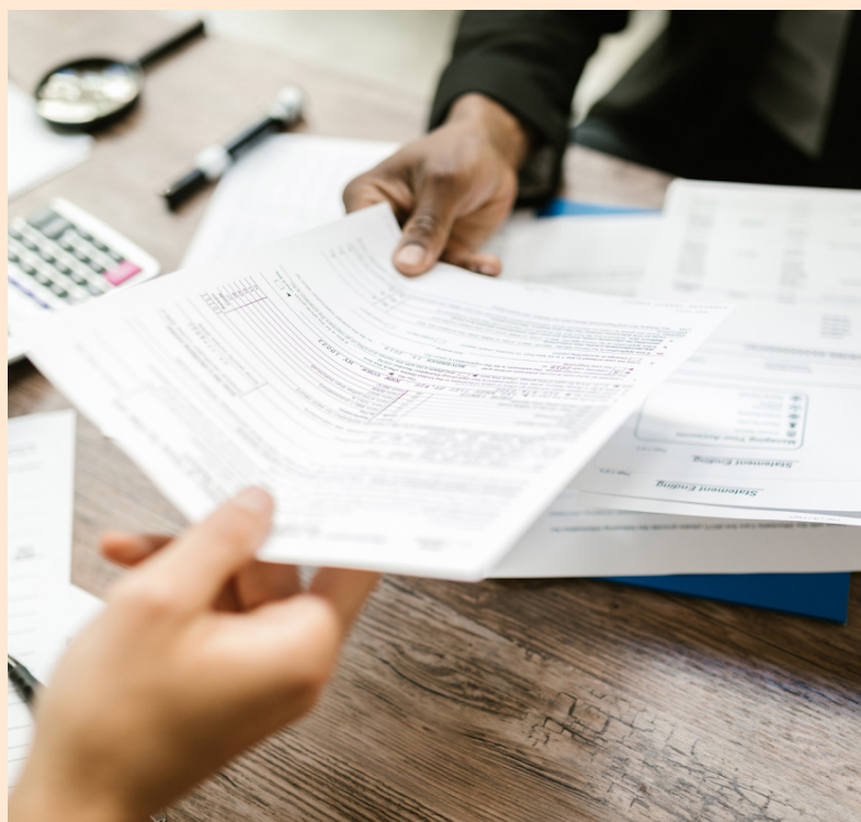
Las personas naturales y jurídicas que reciben financiamiento internacional deben inscribirse en el Registro de Agentes Extranjeros (RAEX), cuyo plazo vence este 4 de septiembre de 2025.

“El talante cool que le intentó imprimir el presidente Nayib Bukele a sus acciones, cada vez se parece más a lo peor de las acciones autoritarias que han tenido lugar en América Latina por décadas”, sostuvo.