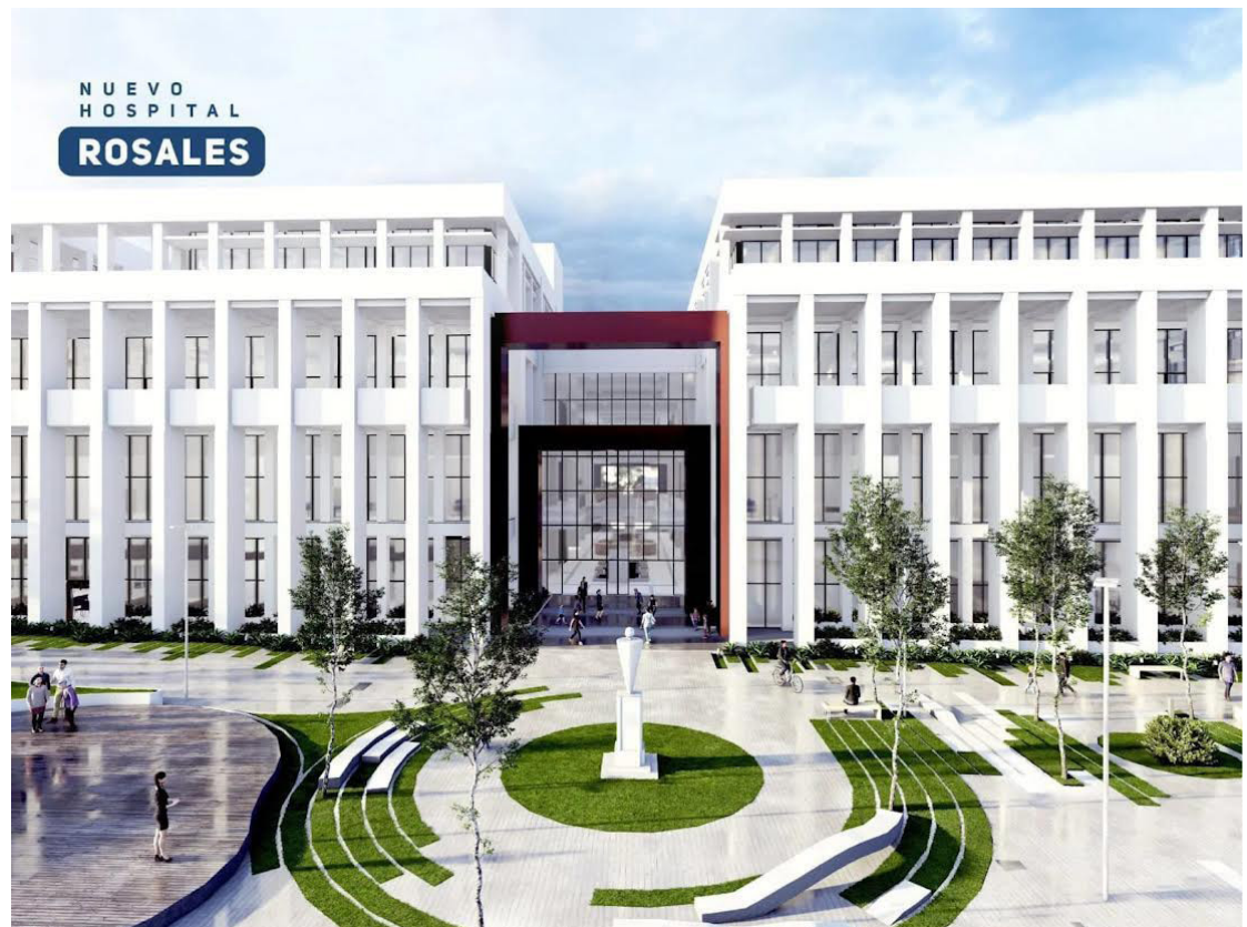
El Colegio Médico considera que solo construir un edificio bonito en el hospital Rosales no resolverá la crisis.

El presidente del Colegio Médico enfatizó que al no existir