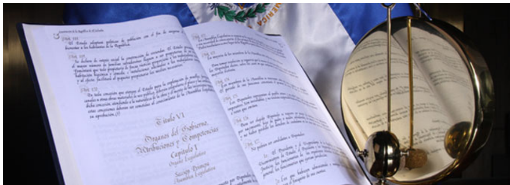
La Asamblea Legislativa modifica la Carta Magna a conveniencia para que los gobernantes permanezcan en el poder por tiempo indefinido.