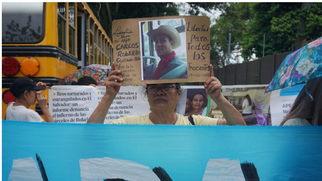
Trabajadores sindicalizados de la PDDH han cuestionado el trabajo de la procuradora Raquel Caballero.

El movimiento exigió a la procuradora Raquel Caballero que cumpla con todas las peticiones presentadas durante más de tres años, así como otras acciones que la ley le faculta a ejecutar.