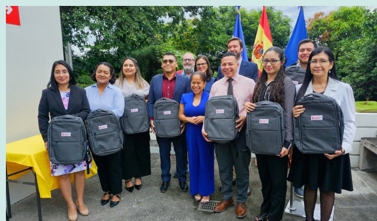
Las personas becarias partirán a España a inicios de septiembre de 2025 para incorporarse a sus programas académicos.

“Permitirán que los funcionarios completen su preparación académica, apliquen los conoci-