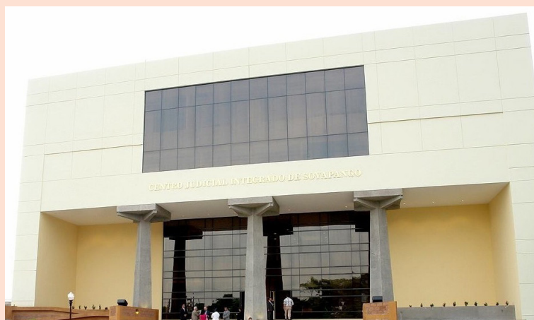
El caso de estafa por redes sociales se lleva a cabo en el Centro Judicial Integrado de Soyapango.

Según la denuncia, los hechos ocurrieron el 20 de febrero, cuando la víctima contactó a la imputada a través de Marke-