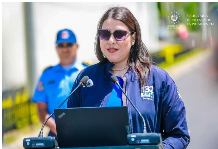
La gerente médica del SEM es destituida luego de un acto de intolerancia.

En redes sociales, más que el accidente leve generó reacciones sobre la forma de actuar y de expresar de la doctora, ya que utilizó malas pa-