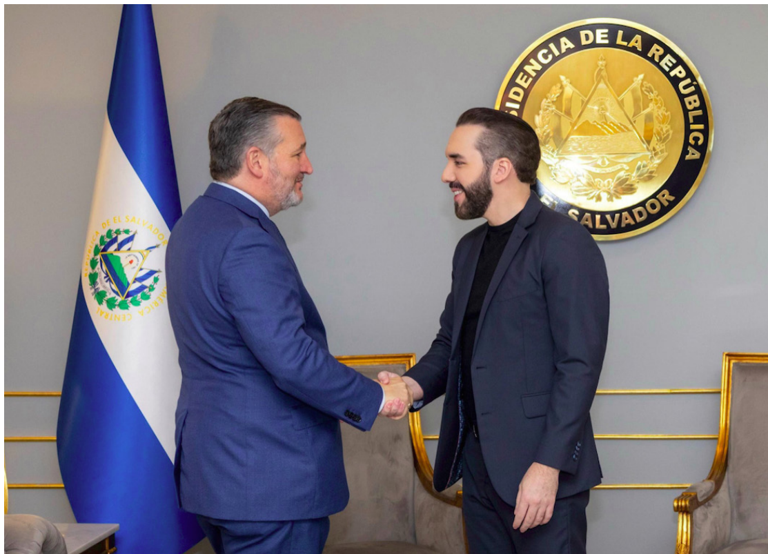
Ted Cruz y Nayib Bukele sostienen una reunión esta semana luego de una visita del senador y recorrer las instalaciones en el CECOT.

En la conferencia, Ted Cruz destacó que Nayib Bukele es uno de los “socios importantes” de Estados Unidos, específicamente