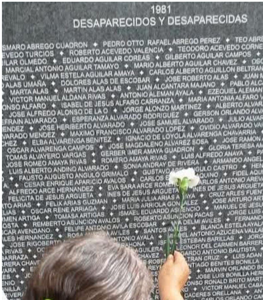
La CIDH envió a la Corte Interamericana de Derechos Humanos el caso por la desaparición forzada de cuatro niñas y un niño de la familia Rivas, durante el conflicto armado.

Días más tarde, regresaron al lugar y encontraron varios cadáveres, pero no los de las niñas y el niño, quienes hasta hoy permanecen desaparecidos y sus nombres figuran como víctimas en el Informe de la Comisión de la Verdad y en un informe de la Procuraduría para la Defensa de los Derechos Humanos (PDDH) de 2004. En 2007, la parte peticionaria interpuso tres hábeas corpus contra miembros del Batallón Atlacatl y de la Quinta Brigada de Infantería de la Fuerza Armada, mientras tanto, la Sala de lo Constitucional, en resoluciones de 2011 y 2017, declaró probada la desaparición forzada de las niñas y el niño Rivas, atribuyéndola a agentes estatales, y ordenó recabar información sobre el operativo "Invasión Anillo".