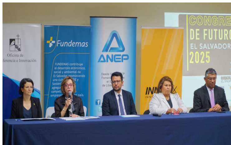
La entrada al Congreso de Futuros será gratuita para estudiantes.