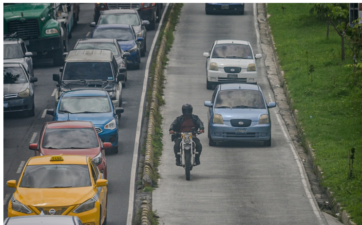
El Gobierno ha solicitado $60 millones para un plan de transporte público y seguridad vial.