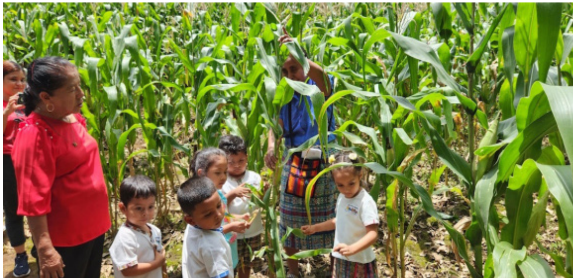
Las maestras nahuablantes enseñan el idioma a niños y niñas de entre 3 y 5 años, integrando en su enseñanza el contacto con lugares simbólicos de las comunidades, así como con la naturaleza, a través de recorridos por bosques y actividades de siembra de cultivos.

La oposición fue fuerte. Sin embargo, al cabo del primer año, las mismas familias que rechazaban la iniciativa llegaron a inscribir a sus hijos. Hoy, la percepción ha cambiado, la mayoría de la