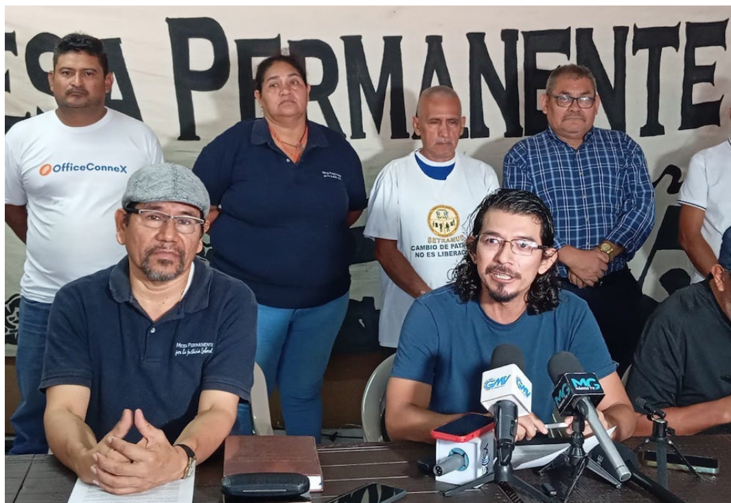
La MPJL y el BRP denuncian que la alcaldía de San Salvador Este, despidió a más de 400 trabajadores de Ilopango, San Martín, Soyapango y Tonacatepeque.