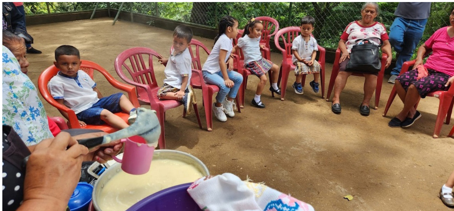
Una nueva generación de niñas y niños busca revitalizar el náhuat pipil, una lengua ancestral hablada hoy por menos de un centenar de personas en El Salvador y en peligro de extinción.