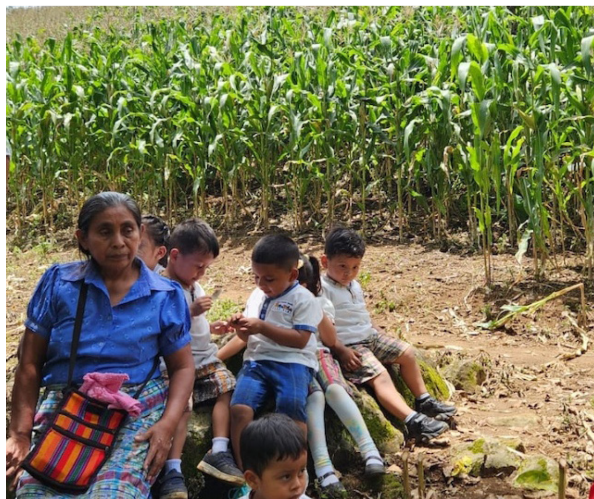
Los recorridos comunitarios son un pilar en la metodología de enseñanza, pues permiten que el aprendizaje del náhuat se vincule con la vida cotidiana.