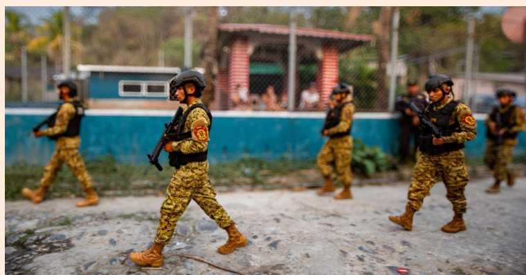
El régimen de excepción ha sido prorrogado desde marzo de 2022, se han capturado a más de 89 mil presuntos pandilleros.

Los diputados de la Asamblea Legislativa aprobaron una extensión más del régimen de excepción, que mantiene suspendidos los derechos fundamentales de los salvadoreños: suspensión a ser informados de su detención y a asistencia de defensa técnica, suspensión de la detención provisional de 72 horas y suspensión de la inviolabilidad de las telecomunicaciones.