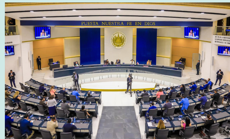
La Asamblea Legislativa aprueba un préstamo por $150 millones para financiar un programa educativo.

El canje de notas es una forma de comunicación diplomática entre dos países, que se hace a través de documentos llamados “notas diplomáticas”. Estas se intercambian para acordar algo oficialmente, como un tratado, un convenio, una cooperación, entre otros.