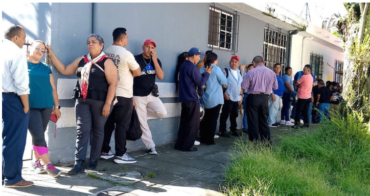
Los trabajadores abruptamente fueron convocados para informarles la supresión de su plaza, y hacerles firmar un finiquito.