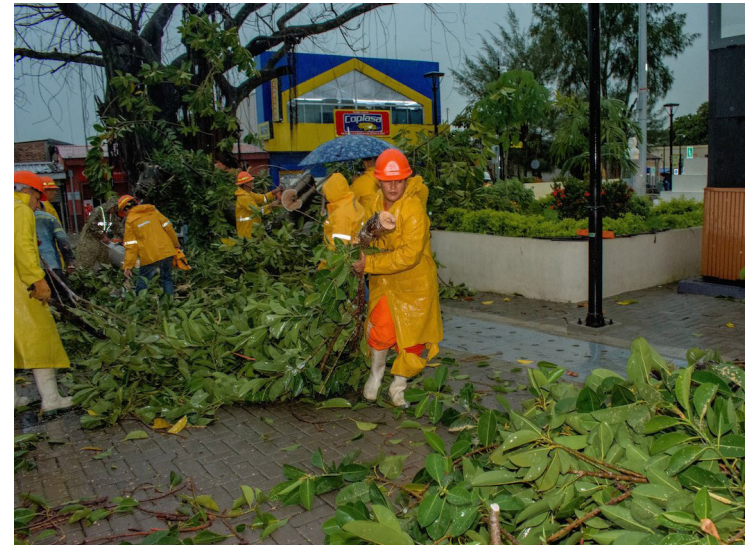
El icónico árbol de hule de la plazuela El Pilar en San Vicente, conocido por su gran antigüedad, cedió debido los fuertes vientos e intensa tormenta de las últimas horas.

La Dirección General de Protección Civil reiteró que se mantiene la alerta verde debido a las lluvias. El Ministerio de Medio Ambiente y Recursos Naturales (MARN) prevé desde el mediodía y en la primera mitad de la tarde, chubascos y tormentas en la fran-