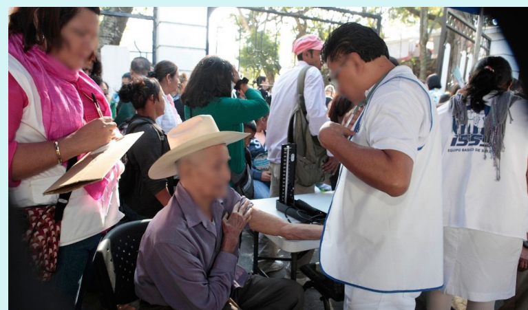
Ley de Creación de la Red Nacional de Hospitales, abre la puerta a la privatización de la salud pública, al permitir que el presupuesto estatal sea transferido a empresas privadas, incluso extranjeras.

llamado a la movilización cívica y pacífica en defensa de la salud, y el trabajo digno. Además, se solidarizan y acompañan a colegios profesionales, sindicatos, gremios