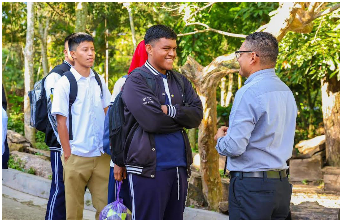
A partir del 1 de septiembre en todos los centros educativos públicos, entra en vigencia el Reglamento para la Promoción de la Cortesía Escolar.

“Los estudiantes podrán eliminar deméritos acumulados al cumplir una semana completa con saludos y expresiones de cortesía ejemplares; apoyar voluntariamente en actividades de orden y limpieza escolar, y participar en cam-