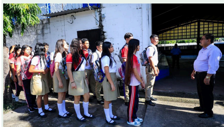
Los colegios privados reiteran que serán más exigentes sobre el uniforme, presentación y corte de cabellos de los alumnos.

ingreso del Pabellón Nacional, entonación del Himno Nacional, Oración a la Bandera Salvadoreña. Además, la ponencia a cargo de un estudiante sobre un personaje ilustre de El Salvador o un hecho histórico relevante; y el retiro del Pabellón Nacional, sin embargo, el FMS afirmó que estas disposiciones no son nuevas, ya se hacían desde hace muchos años.