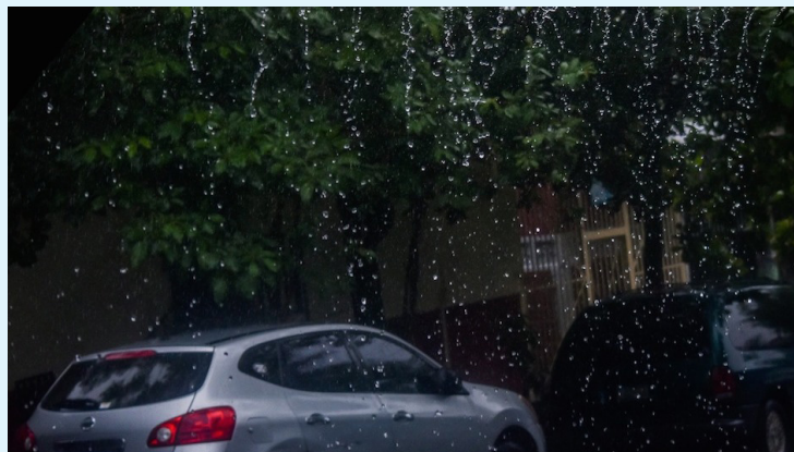
Para los próximos días se pronostican lluvias y tormentas de moderada a fuerte intensidad.

Medio Ambiente enfatizó que para los próximos días se pronostican lluvias y tormentas de moderada a fuerte intensidad, asociadas a sistemas atmosféricos cercanos a El Salvador.