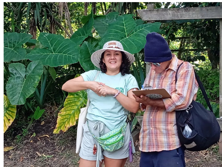
Los ciudadanos tienen como meta recolectar un millón de firmas para presentarlas al gobierno, y desista de construir CIFCO en El Espino.

La Asamblea Legislativa autorizó en agosto de 2025 la segregación de 55,711.13 m²