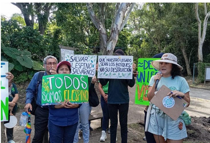
Todos somos El Espino aclara que no está en contra de la construcción de CIFCO, lo que se debe evitar es deforestación del único pulmón verde en San Salvador.

Agregó que ya se hizo una jornada de reforestación, pero están programan-