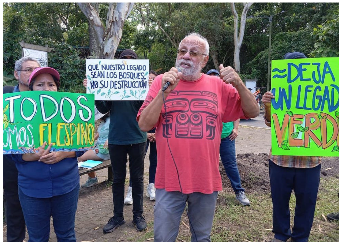
El movimiento Todos somos El Espino señala que se debe cuidar la poca reserva ecológica y no permitir la destrucción de la Finca El Espino.