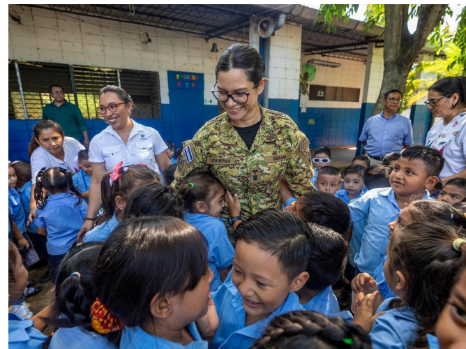
El Frente Magisterial Salvadoreño pide a la ministra de Educación, Karla Trigueros, poner más interés en resolver la deserción escolar debido al cierre de escuelas.

La dirigente gremial externó que en el país ha aumentado el índice de pobreza, en las zonas rurales hay niños quienes deben caminar descalzos para no dañar sus zapatos, hay un video en redes sociales donde un estudiante al interior de un huacal se atraviesa el río, este estudiante cómo va a llegar bien uniformado, por eso es importante