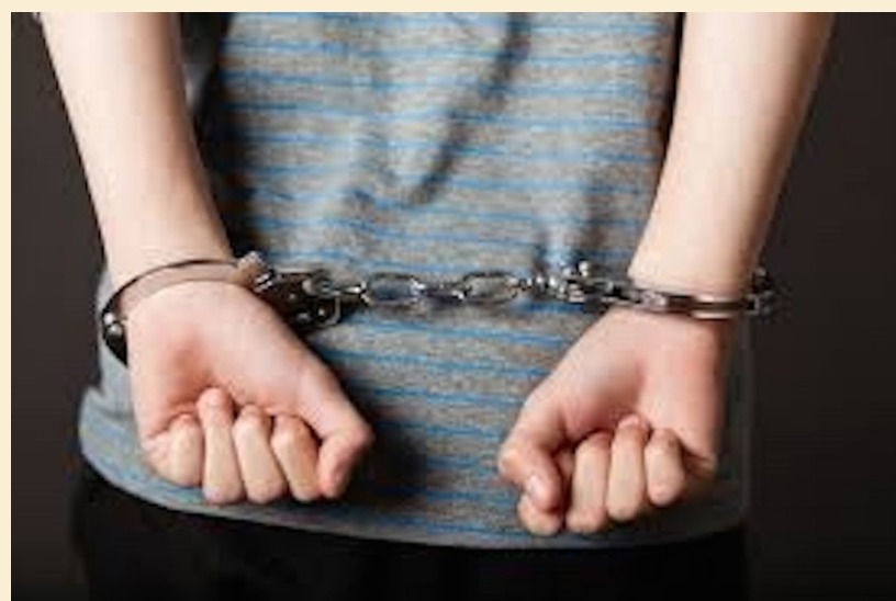
Los jueces de menores que conforman el Tribunal actuarán únicamente como jueces de garan- tía.

Con esta decisión se vulnera el artículo 8.1 de la Convención Interame- ricana de Derechos Humanos y el artículo 11 y 12 de la Constitución, añ- dió Flores.