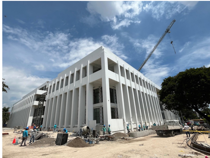
El Hospital Rosales será el primer nosocomio que se regulará por Red Nacional de Hospitales, actualmente está en construcción.