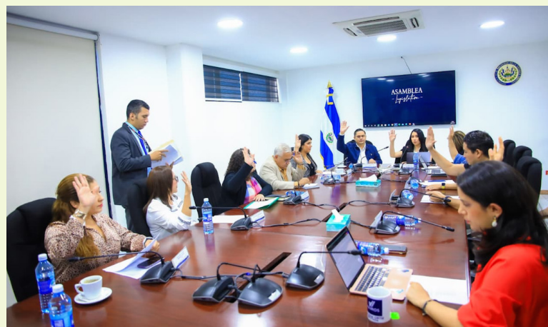
La Comisión de Tecnología aprueba sin leer ni discutir los informes de los ministerios de Economía, Turismo y de Trabajo.

La opositora comparó el accionar de la actual legislatura con las anteriores. “Esto se parece a lo que pasaba en las Asambleas Legislativas que los controlaban otros partidos. Venían in-