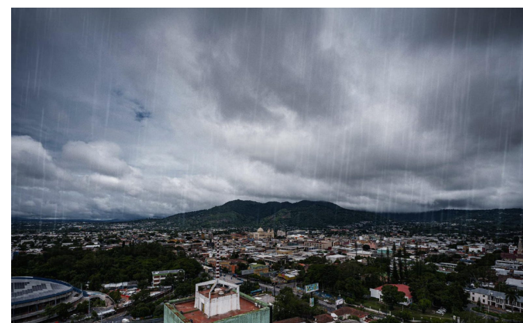
Para este sábado continuarán las lluvias en el país, debido a la influencia de una vaguada y onda tropical.

Amaya, consideró que las inundaciones urbanas son uno de los escenarios de riesgo prevenible, en la zona baja del Área Metropolitana de San Salvador (AMSS) existe una alta probabilidad de acumulación de agua. Las lluvias registradas el pasado 15 de agosto pueden formarse en el transcurso de una hora, dejando cantidades importan-