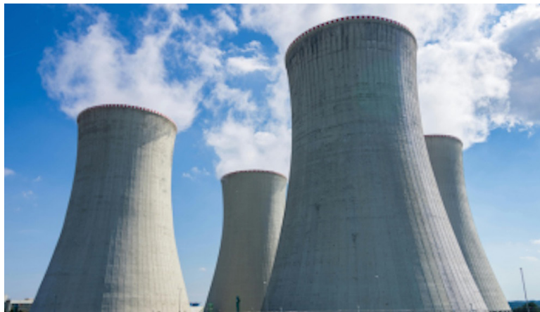
La entrada en vigencia de la Ley de Energía Nuclear es prorrogada por un año más.

Los legisladores recordaron que El Salvador es el primer país de la región que tiene una normativa para im-