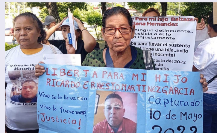
En El Salvador los niños, adolescentes y adultos mayores son los principales afectados al tener familiares detenidos, principalmente desde que inició el Régimen de Excepción.

mover la observancia y la defensa de los derechos humanos en la región y actúa como órgano consultivo de la OEA en la materia.