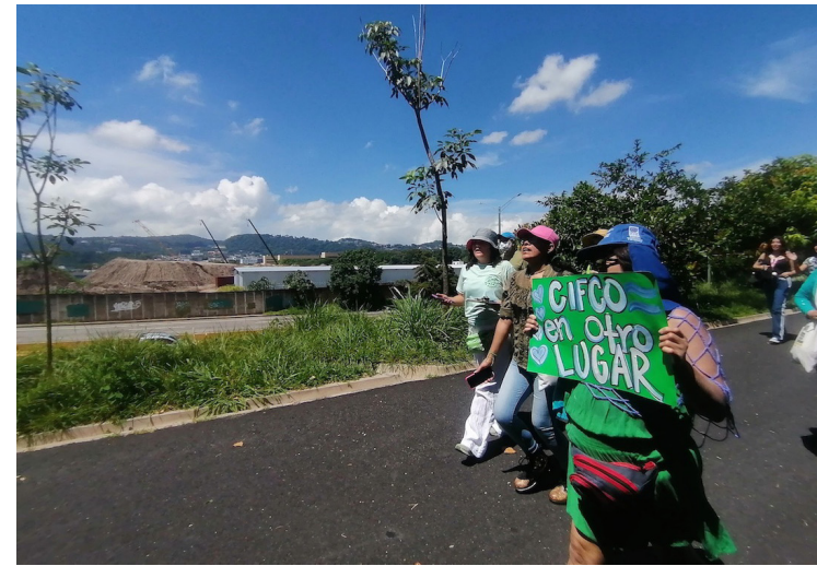
Un grupo de ciudadanos marcha para solicitar a las autoridades que no se construya el CIFCO en la Finca El Espino ya que esto podría causar daños al medio ambiente.

También pide que se establezca un mecanismo de diálogo transparente y abierto con las comunidades locales, los residentes afectados y las organizaciones ambientales para garantizar la divulgación de información y la plena participación. Situación que no hizo la Asamblea Legislativa cuando aprobó segregar los terrenos para la construcción del CIFCO. “Si no se puede garantizar la divulgación de información, la evaluación técnica independiente ni la consulta pública previa y suficiente, le solicitamos que retire completamente su inversión/colaboración y finalice el proyecto”, pidió en la misiva. Cisneros sostuvo que ningún informe de evaluación de impacto ambiental publicado para este proyecto ha sido revisado por la academia, la comunidad ni por organizaciones ambientales independientes.