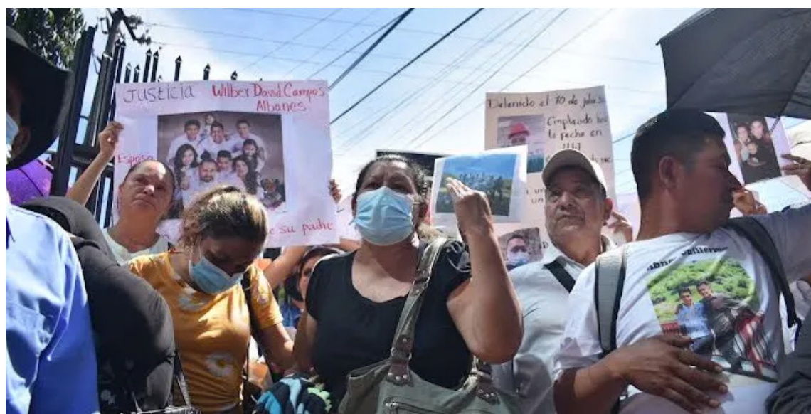
Familiares de víctimas del régimen de excepción exigen en las afueras de la PDDH que esta institución se pronuncie e investigue los casos de personas que nada tienen que ver con pandillas.

Estados Unidos señaló también que el Gobierno salvadoreño reportó una disminución significativa en los asesinatos generalizados cometidos por bandas criminales. El gobierno y los observadores atribuyen esta disminución a las políticas gubernamentales bajo el estado de excepción, declarado en marzo de 2022 y prorrogado mensualmente.