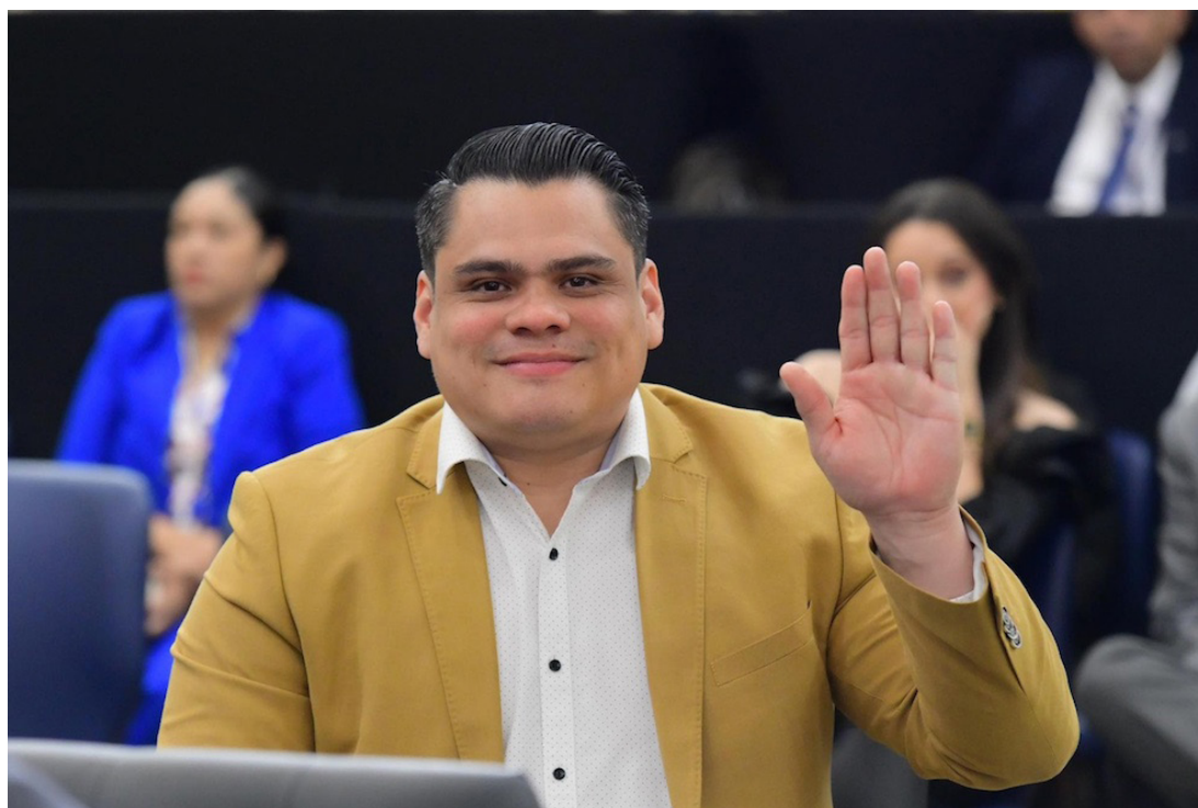
El diputado Caleb Navarro adquirió propiedades valoradas en casi medio millón de dólares sin conocer el origen de los fondos.

En menos de un año, el subjefto de fracción de Nuevas Ideas, Caleb Navarro, adquirió seis propiedades por casi medio millón de dólares, sin conocerse públicamente el origen de esos fondos, solamente uno de ellos se conoce que fue con un crédito del Banco Hipotecario, según lo informó Revista Factum, con documentos del CNR y del banco estatal.