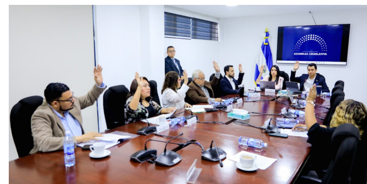
Estos dictámenes pasarán al pleno este miércoles en la sesión plenaria ordinaria para ser aprobados.

“Es un préstamo contingente y sus recursos nada más se utilizarán en caso de emergencia, ya sea por desastres naturales o de atención a sa-