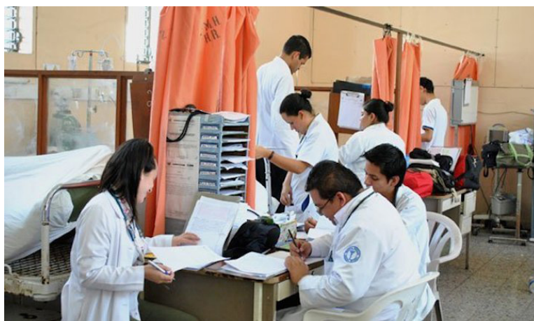
En 2026 no habrá médicos residentes de 1er año en el Hospital Nacional Rosales, desmantelando más el sistema de salud.

Además, se proyecta en convertirlo en una mega Unidad de Salud, con las precarias condiciones laborales del personal de salud con contratos outsourcing o por servicios profesionales. “El futuro para los profesionales jóvenes de salud es cada vez más incierto, muy adverso pues se cierran oportunidades laborales dignas, ade-