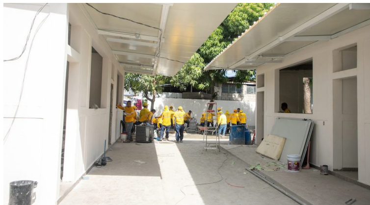
El monto en la reconstrucción del centro escolar Colonia 22 de abril, en Soyapango, es $890 mil, para muchas personas el precio es exagerado.

En redes sociales circulan videos de los trabajos ejecutados por los reos en fase de confianza en el programa “Dos escuelas por día”, iniciativa del gobierno para renovar o construir dos centros escolares cada día. Sin embargo, algunas personas consideran que los montos de las reconstrucciones son muy elevados y exagerados, ya que por estos trabajos el gobierno no paga mano de obra, pues son los reos quienes hacen toda la obra. Ejemplo de ello es el centro escolar Colonia 22 de abril, en Soyapango, donde el monto de inversión para el bachillerato es de $890 mil y la parvularia de $658 mil, haciendo un total de $1,548,000.