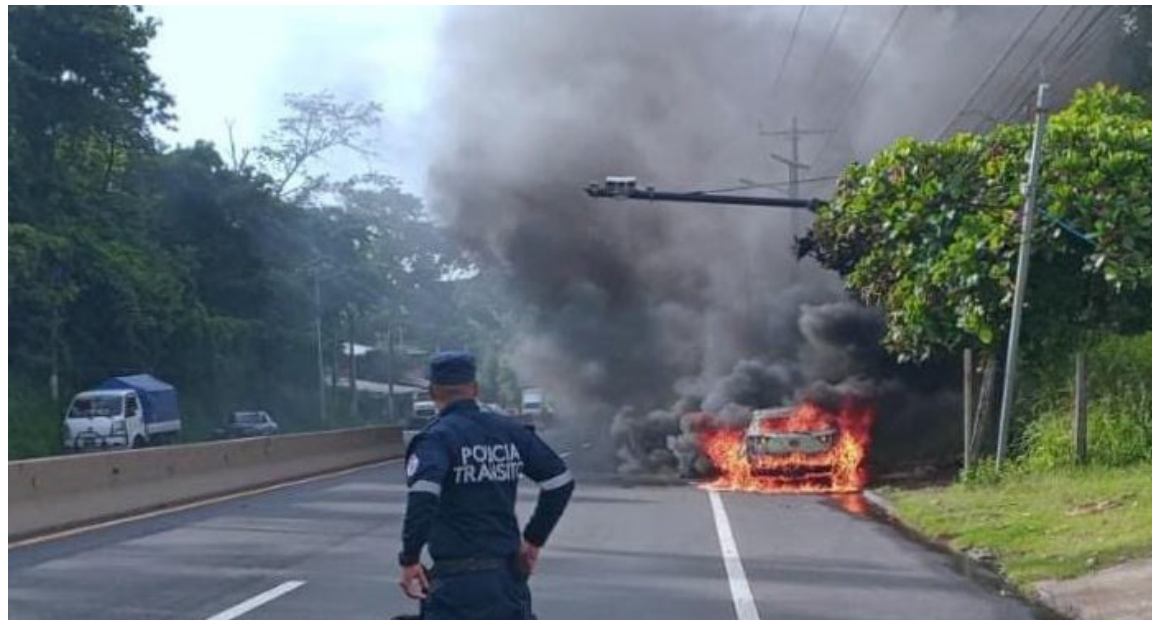
Sobre el kilómetro 50½ de la carretera Panamericana, El Congo, Santa Ana, un vehículo se incendió y consumido por el fuego casi en su totalidad.

Además, en otro hecho, dos camiones colisionaron y salieron de la vía sobre el kilómetro 10½ de la autopista que de San Salvador conduce hacia Comalapa, en San Marcos, San Salvador, tres personas resultaron con lesiones leves y fueron atendidas en el lugar por cuerpos de