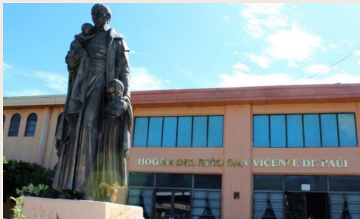
Las religiosas Hijas de la Caridad, dejan el Hogar del Niño San Vicente de Paul, en el barrio San Jacinto de San Salvador, el Estado les pidió entregar la administración.

El Hogar seguirá funcionando, porque pertenece al Estado, pero esto marca el fin de una etapa histórica, donde por casi 150 años las religiosas cuidaron, alimentaron y educaron a miles de niñas y niños que encontraron en ese