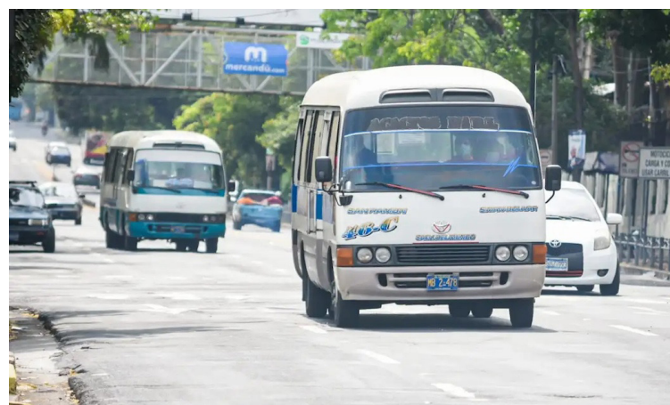
La Comisión de Infraestructura emitió dos dictámenes, para ser aprobados en el pleno legislativo este martes a fin de mantener la vigencia de las placas de vehículos automotores y la prórroga para mantener estables las tarifas de transporte público.

Esta ley transitoria, establece un cargo de $0.10 por galón de Diésel bajo en azufre y gasolina regular y superior. En cuanto a la compensación económica del transpor-