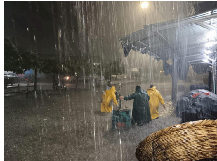
El país ha regresado a las condiciones normales del período lluvioso, donde cada tres o cuatro días, se tiene el paso de una onda tropical.

El Ministerio de Medio Ambiente y Recursos Naturales (MARN) informó que, en la madrugada de este martes, el cielo estará nublado, con lluvias en la zona centro, oriente y en la costa. Por la mañana se esperan llu-