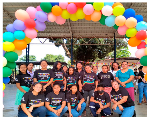
Día de la Juventud - jóvenes organizada/os

Desde una mirada integral, el MSM promueve la gestión de riesgos y la adaptabilidad frente al cambio climático, reconociendo su vínculo directo con las condiciones de vida de las mujeres, mujeres con discapacidad, juventudes y niñez. A través del fortalecimiento de comités ambientales, el saneamiento de ríos, la reducción de plásticos de un solo uso y la conciencia ecológica en comunidades históricamente vulneradas. Continuamos impulsando procesos de formación con enfoque de género y discapacidad, fomentando el cuidado de los bienes naturales y el respeto al territorio como derecho colectivo.