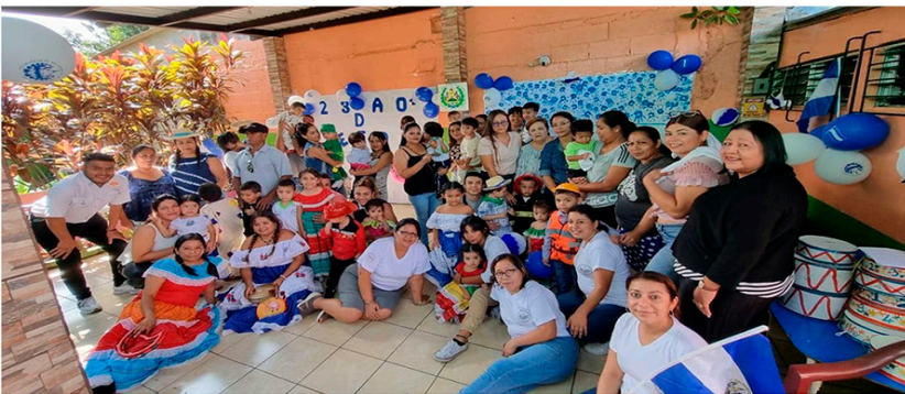
Centro de Desarrollo Infantil y Familiar “El Jacalito”

Una estrategia fundamental en el quehacer institucional a lo largo de los años es la prevención de la violencia de género en los territorios de