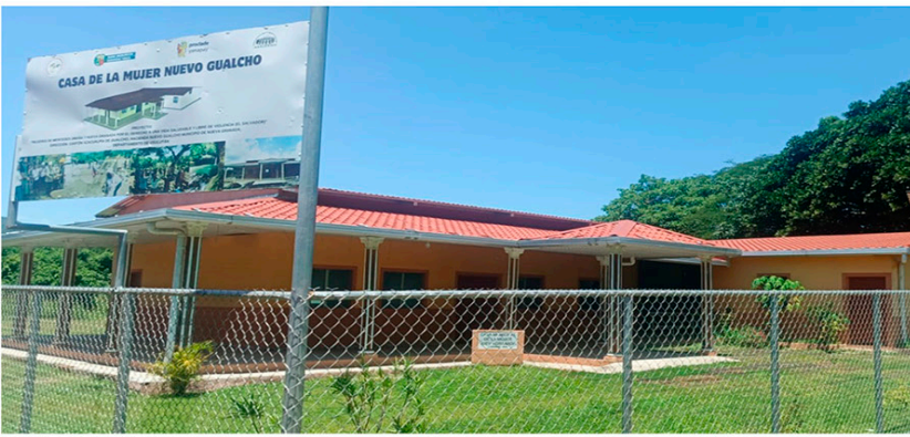
Casa de la mujer en Nuevo Gualcho - Nueva Granada Usulután

Un pilar fundamental del trabajo del MSM es la construcción de un modelo de economía feminista y de los cuidados como alternativa para la sostenibilidad de la vida. A través de escuelas comunitarias, réplicas de formación, emprendimientos productivos y experiencias agroecológicas, hemos promovido la autonomía económica de las mujeres, el reconocimiento del trabajo doméstico y de cuidados, y la organización comunitaria para el sostenimiento de los medios de vida. MSM trabaja con un enfoque de desarrollo integral en la primera infancia, creando el Centro de Desarrollo Infantil y Familiar “El Jacalito” que representa una apuesta estratégica por el cuidado digno, la prevención de violencias y el acceso a la educación inicial, y como respuesta a una necesidad sentida de las mujeres trabajadoras y madres solteras, especialmente aquellas que laboran en condiciones precarias, como las maquilas y el sector informal.