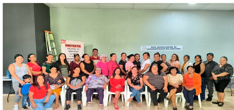
Socialización de la sistematización en Mercedes Umaña y Nueva Granada