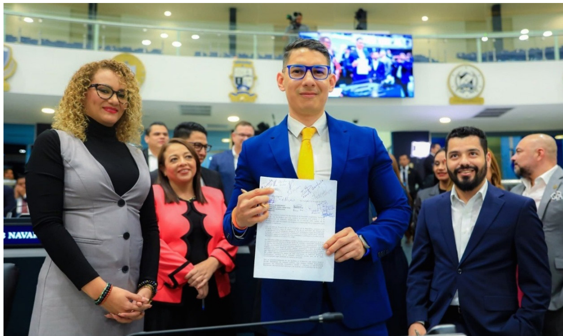
Nuevas Ideas da un golpe a la Constitución de la República al aprobar una reelección indefinida.