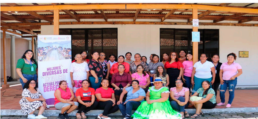
Creación de Asociación de mujeres

Desde nuestro surgimiento hemos contado con el acompañamiento constante de la cooperación internacional, de amigos y amigas que de