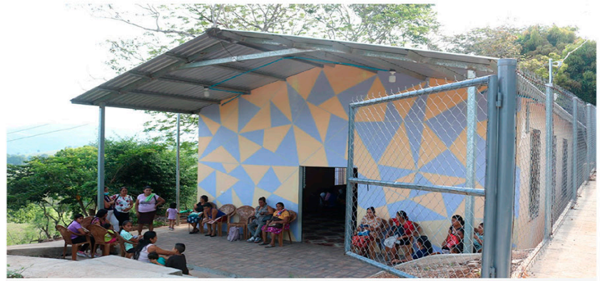
Casa de la Mujer y la Juventud de Cuisnauat - Sonsonate

intervención. La creación y fortalecimiento de las Ventanas Ciudadanas ha permitido que las mujeres conozcan la Ruta de Acceso a la Justicia, acompañando a la denuncia y articulando con instituciones garantes de derechos. A través de la atención psicológica y jurídica, la promoción de la autodefensa feminista, el autocuidado, y la sensibilización artística. El MSM ha contribuido a la ruptura del silencio y la reconstrucción de las vidas de mujeres sobrevivientes, en esta estrategia MSM ha construido en las diferentes zonas donde incidimos módulos habitacionales que han permitido reducir el hacinamiento que expone a mujeres, niñas y niños a mayores riesgos de abuso sexual; las letrinas aboneras han mejorado las condiciones de higiene y privacidad; y las cocinas ahorradoras de leña han disminuido los riesgos a la salud y la carga doméstica en mujeres rurales. A lo largo de los años hemos respondido a una necesidad sentida de las mujeres de contar con espacios adecuados para el desarrollo de actividades, construyendo en los territorios casas de la mujer.