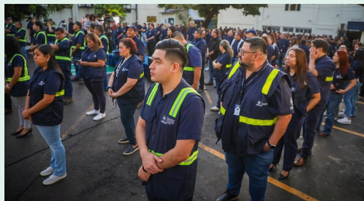
El ministerio de Trabajo desplegará más de 700 colaboradores, a escala nacional, quienes ejecutarán inspecciones para garantizar que en las vacaciones agostinas los empleadores paguen conforme a la ley.

“Nos vamos a desplegar en los 14 departamentos del país, para garantizar que los trabajadores tengan el acuerdo entre empleadores, porque laborar en días fes-