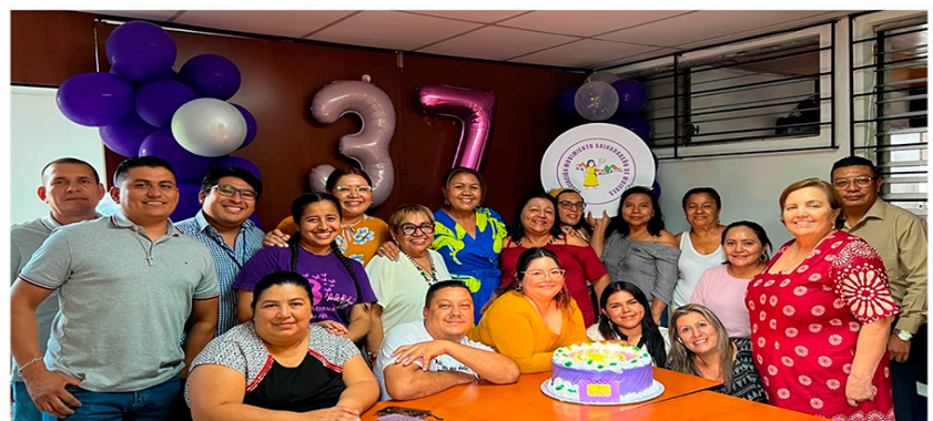
Personal del MSM en celebración del 37° Aniversario

manera solidaria y desinteresada, quienes se identifican con las condiciones vulnerables, con las brechas de desigualdad de género, aportando sus conocimientos, su apoyo financiero para mejorar las condiciones de vida de las mujeres y sus familias en los territorios donde MSM trabaja. Agradecemos profundamente su confianza y compromiso con la población mas vulnerable, especialmente las mujeres quienes por años han sido invisibilizadas y excluidas en los procesos de desarrollo.