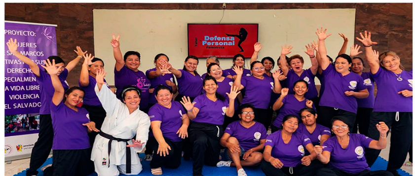
Finalización de procesos de Autodefensa Feminista - San Marcos

intervención. La creación y fortalecimiento de las Ventanas Ciudadanas ha permitido que las mujeres conozcan la Ruta de Acceso a la Justicia, acompañando a la denuncia y articulando con instituciones garantes de derechos. A través de la atención psicológica y jurídica, la promoción de la autodefensa feminista, el autocuidado, y la sensibilización artística. El MSM ha contribuido a la ruptura del silencio y la reconstrucción de las vidas de mujeres sobrevivientes, en esta estrategia MSM ha construido en las diferentes zonas donde incidimos módulos habitacionales que han permitido reducir el hacinamiento que expone a mujeres, niñas y niños a mayores riesgos de abuso sexual; las letrinas aboneras han mejorado las condiciones de higiene y privacidad; y las cocinas ahorradoras de leña han disminuido los riesgos a la salud y la carga doméstica en mujeres rurales. A lo largo de los años hemos respondido a una necesidad sentida de las mujeres de contar con espacios adecuados para el desarrollo de actividades, construyendo en los territorios casas de la mujer.