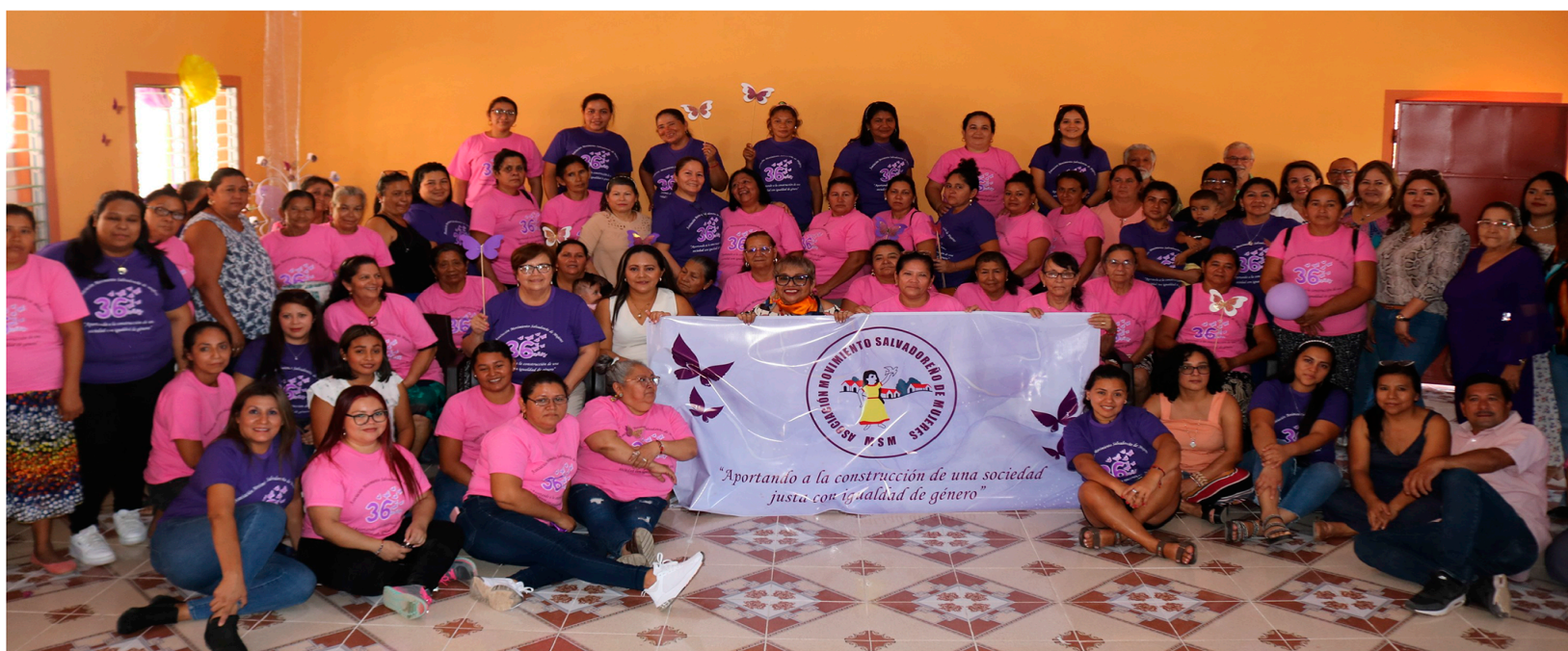
Asamblea de Socias 2024 y Aniversario 36 de MSM - conmemorado en el distrito de Nueva Granada, Usulután Norte

A lo largo de cuatro décadas, la Asociación Movimiento Salvadoreño de Mujeres (MSM) ha sido un pilar fundamental en la organización y empoderamiento de miles de mujeres en El Salvador. Su trabajo continúa fortaleciendo la voz colectiva de las lideresas comunitarias, consolidando comités, redes y asociaciones que hoy sostienen procesos de exigibilidad y defensa de derechos en 8 departamentos, 21 municipios, y 40 distritos. Gracias a procesos formativos, el acompañamiento psicosocial, legal y las campañas de sensibilización, las mujeres han logrado posicionarse en espacios de decisión comunitarios, municipales e interinstitucionales. En este caminar, hemos reforzado el liderazgo de mujeres con discapacidad, quienes hoy participan activamente en estructuras organizativas, defendiendo su dignidad y el derecho a vivir sin violencia.