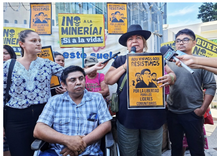
Comunidad Santa Marta pide la liberación absoluta de los líderes comunitarios ya que aseguran que ellos son inocentes.