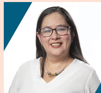
Ruth López ha sido reconocida con el “Premio Internacional de Derechos Humanos 2025”, de la Asociación Americana de Abogados (ABA).

“La valentía de López personifica el verdadero heroísmo e inspira a los abogados de todo el mundo a mantenerse alertas para promover el Estado de Derecho”, enfatizó la también presidenta entrante de la Sección de Litigios