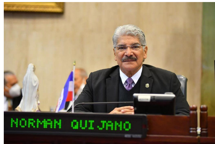
El exdiputado de ARENA y expresidente de la Asamblea Legislativa, Norman Quijano, fue capturado por funcionarios de inmigración de Estados Unidos el 6 de marzo.

“Esta acción impulsada por la dictadura de Nayib Bukele, forma parte de una persecución política contra figuras destacadas de la oposición, utilizando acusaciones infundadas de vínculos con pandillas, que nada tienen que ver con la trayectoria ejemplar de Quijano en el servicio público, comprometido con el desarrollo de El Salvador”, expresó el partido a través de un comunicado.