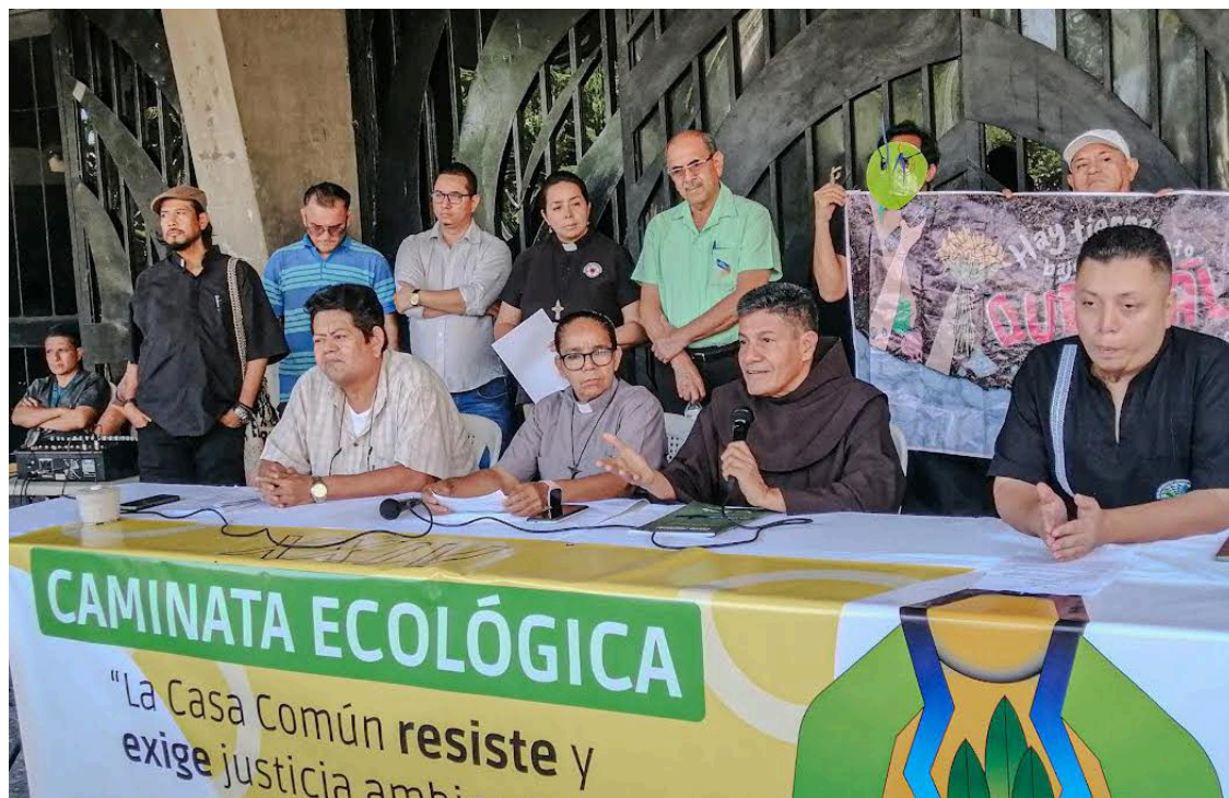
La Caminata Ecológica tendrá lugar el jueves 5 de junio a las 7:30 de la mañana en dirección a la Asamblea Legislativa para pedir la derogatoria de la Ley de Minería.

La Ley General de Minería fue aprobada un día antes de navidad sin consulta popular y de forma exprés, porque desde que salió el tema en la opinión pública se tardó menos de un mes en revertirse la prohibición y que se convirtiera de forma legal realizar traba-