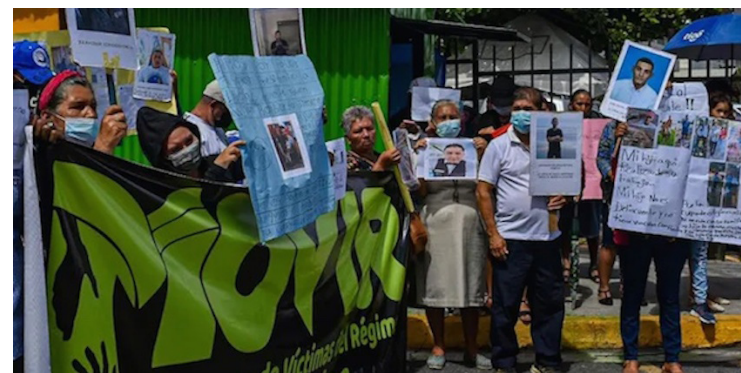
Familiares de víctimas del régimen exigen la liberación de sus detenidos fuera de la Asamblea Legislativa.

Según Socorro Jurídico Humanitario, más de 400 personas han muerto dentro de los centros penales; la mayoría sin vínculos con estructuras criminales. Pese a la vasta evidencia de familiares de víctimas inocentes del régimen, el Gobierno de Bukele sigue prorrogando la medida. El decreto mencionó que “la activación de dicho mecanismo constitucional se adoptó para salvaguardar los derechos de la población y para contrarrestar la grave y desmedida violencia que ocasionaron las pandillas en nuestro país. Sin embargo, tal como se ha indicado de manera amplia en cada uno de los decretos por lo que se ha prolongado el régimen de