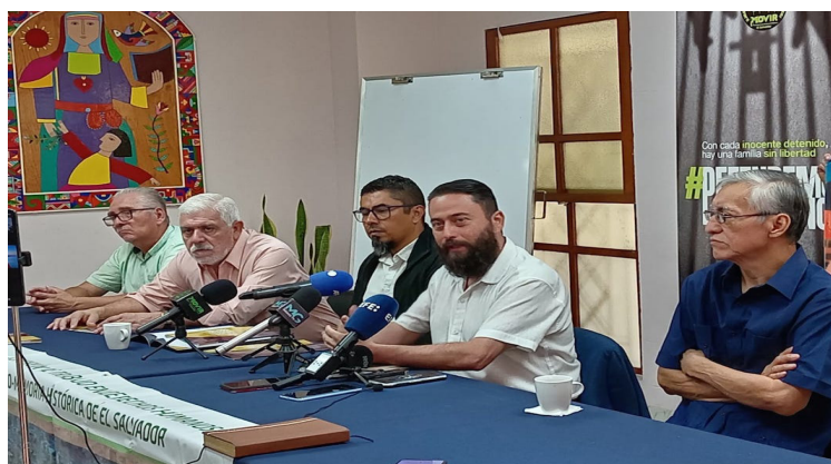
Como un aporte al análisis de la situación de país, Tutela Legal “Dra. María Julia Hernández”, presenta su informe Régimen de Excepción: Tres Años de Violaciones Sistemáticas y Generalizadas a los Derechos Humanos.