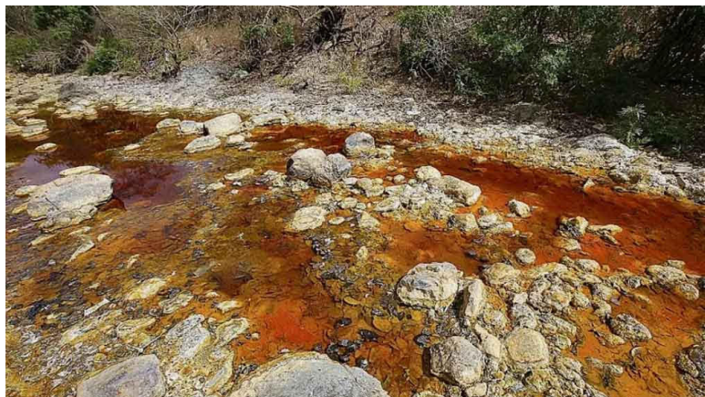
La contaminación del río San Sebastián en Santa Rosa de Lima alimenta la preocupación por la reactivación de la minería metálica.

El que más presupuesto tiene es la Fuerza Armada y Casa Presidencial”, advirtió.