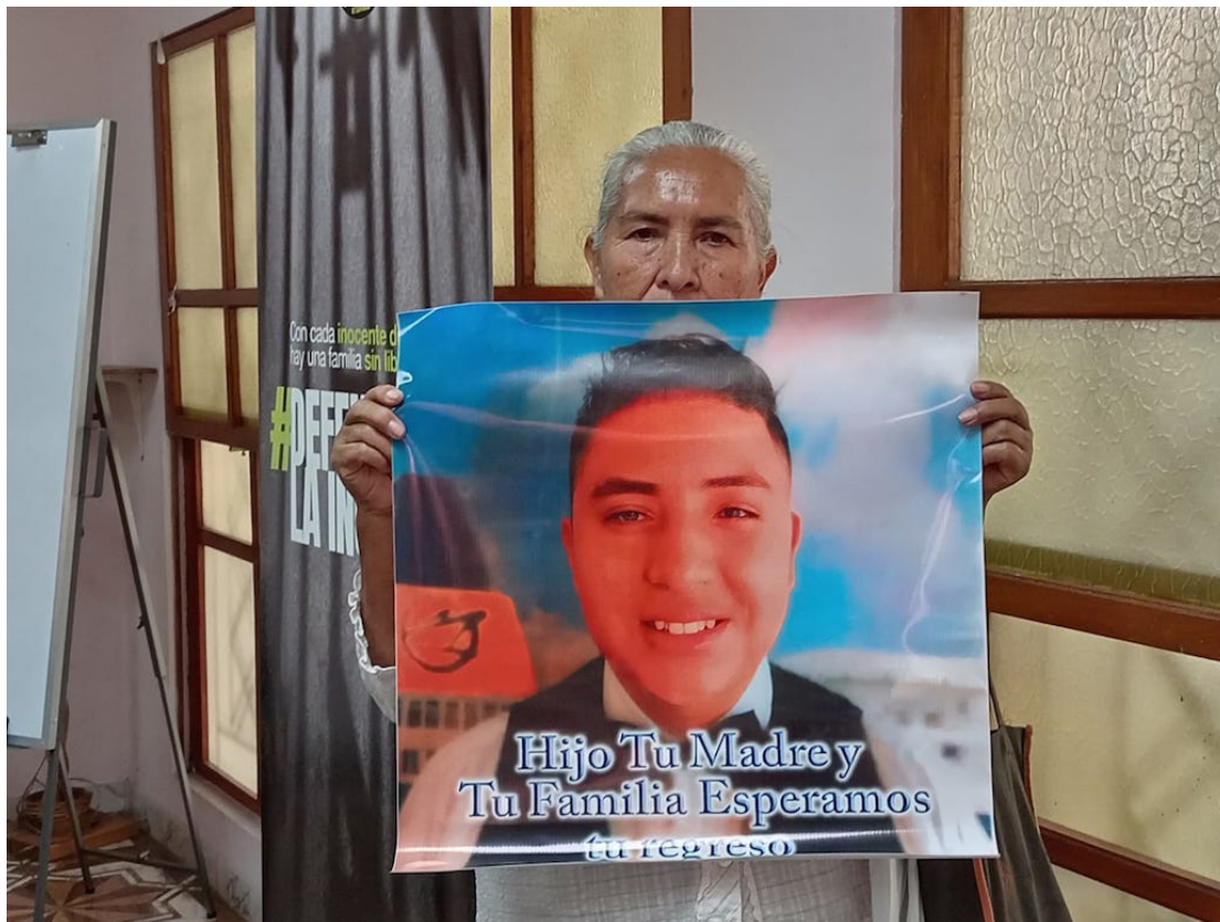
El artículo 7 del Estatuto de Roma, contempla como “Crímenes de Lesa Humanidad” cualquier acto que se cometa como parte de un ataque generalizado o sistemático contra de una población civil con conocimiento de dicho ataque.

Los delitos a los que se refiere el artículo anterior son: asesinatos, exterminio, esclavitud, deportación o traslado forzoso de población, encarcelación u otra privación grave de la libertad física en violación de normas fundamentales de derecho internacional, torturas, violación, esclavitud sexual, prostitución forzada, persecución de un grupo o colectividad y desaparición for-