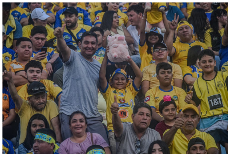
Afición de Municipal Limeño muestra orgullosa los colores del equipo cuchero.

El empate sin goles en el tiempo regular y en el complementario obligó a los equipos a resolver el trámite desde los 11 metros, donde Alianza superó a los santarroseños y se convirtió no solo en el campeón, sino igualó al igualó a FAS con 19 títulos.