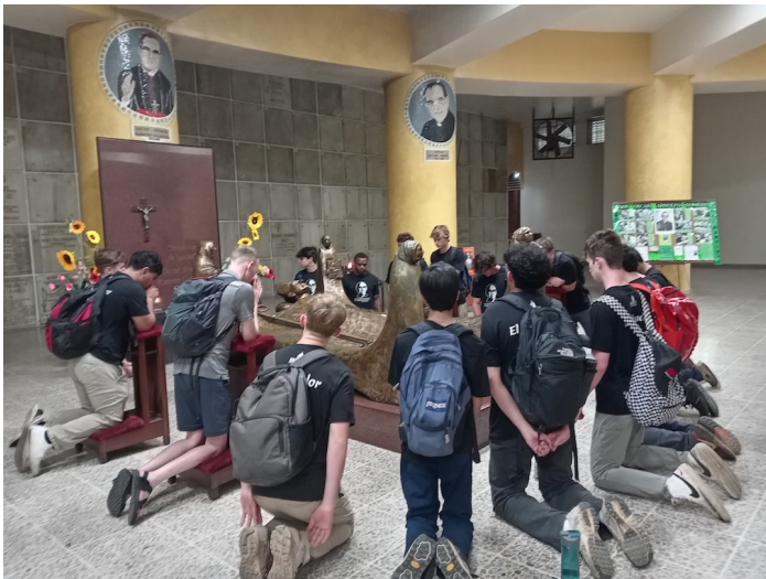
La Cripta de San Oscar Romero recibe 25 de mayo la visita de estudiantes jesuitas de Phoenix, Arizona, Estados Unidos, en la décima conmemoración de la beatificación san Oscar Arnulfo Romero.