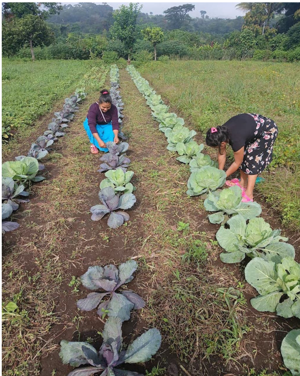
Las comunidades organizadas en diversos territorios del país, trabajan para cambiar sus vidas junto al apoyo de las organizaciones sociales y financiamiento de donantes nacionales o extranjeros.

y donantes que nos han apoyado con este derecho, pero, también, nos preocupa a futuro otros proyectos”, sostuvo Cecilia.