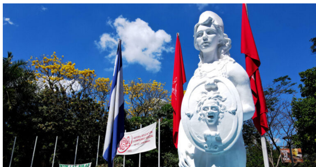
Autoridades de la Universidad de El Salvador (UES) aclaran que los 130 millones de dólares entregados por el gobierno son para cubrir la deuda correspondiente al mes de mayo para su operatividad, y no corresponde a su presupuesto anual.

La falta de un presupuesto digno continúa siendo el las-