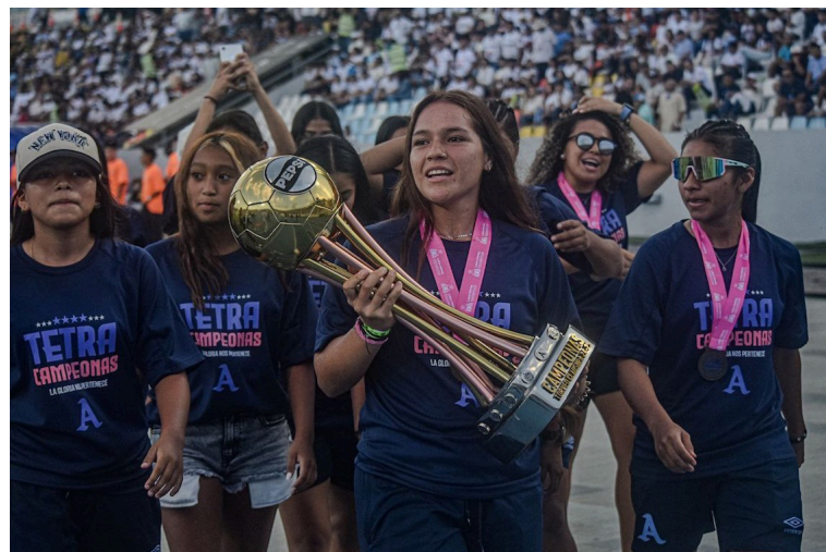
Alianza Women presenta a la afición la copa de la Liga Femenina.