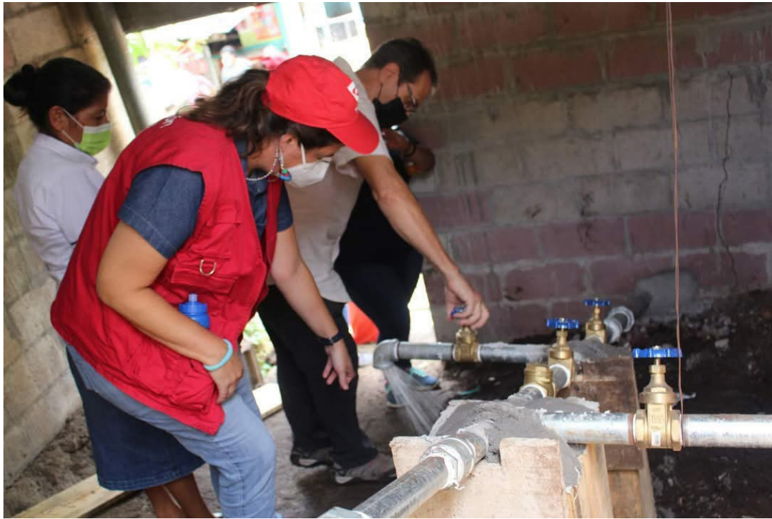
Apicultura, agroecología, permacultura o agroecología, son algunos proyectos que se desarrollan en el territorio nacional. Y ahora los comunitarios temen la suspensión de este tipo de proyectos por la Ley de Agentes Extranjeros.

“Entonces, construimos desde las comunidades la resiliencia, no sólo entregamos cosas y ya. Por esto muchas organizaciones interna-