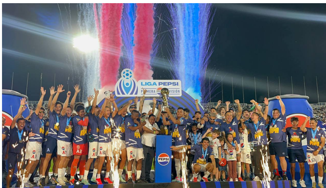
Alianza FC levanta la copa del Clausura 2025 en el estadio "Mágico" González.

Alianza conquistó, el pasado fin de semana, su décimo noveno título en la Liga Mayor de Fútbol de El Salvador, luego de vencer en la tanda de penales a Municipal Limeño, en un partido donde los de oriente dejaron escapar el campeonato tras las múltiples oportunidades.