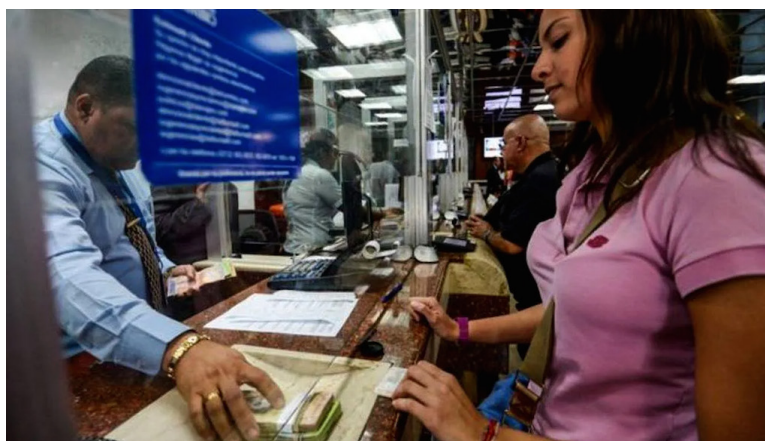
Los salvadoreños con estatus irregular en Estados Unidos tendrían que pagar 5% de impuesto sobre lo que envían en concepto de remesa.

persona que envía la remesa desde EUA, ya que ese 5% saldría del dinero que mandaría o tendrá que poner de su bolsillo para pagar ese impuesto.