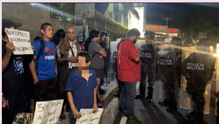
La Asociación de Periodistas de El Salvador (APES) emite una “ALERTA” por la represión y uso de la violencia de agentes de la Policía Militar y la UMO contra periodistas de Radio Bálsamo TV.

nifestación junto a su equipo de Radio Bálsamo TV, relató al Centro de Monitoreo de la APES que daban cobertura a las movilizaciones de los residentes de la Cooperativa El Bosque, quienes protestaban contra los