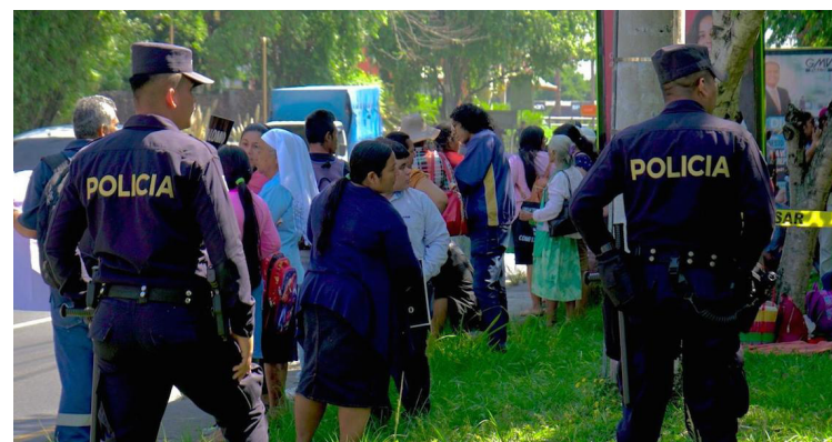
La Asociación de Derechos Humanos Tutela Legal “Dra. María Julia Hernández” condena la represión del gobierno contra las personas que ejercen de forma legítima sus derechos humanos de libertad de expresión y protesta, que consagra la Constitución de la república.