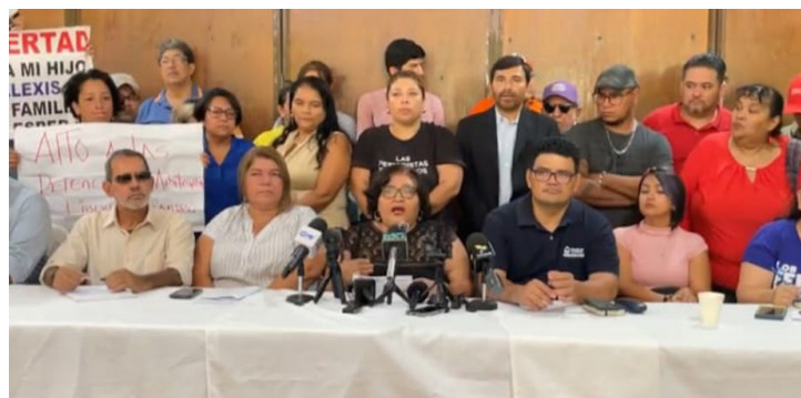
Las organizaciones del Bloque de Resistencia y Rebeldía Popular y Movimiento para la Defensa de la Clase Trabajadora, señalan que la Cooperativa El Bosque solo pedía la ayuda del presidente Bukele para no ser desalojadas.

El Bloque de Resistencia y Rebeldía Popular (BRP) y el Movimiento por la Defensa de los Derechos de la Clase Trabajadora (MDCT) manifestaron que el pasado 12 de mayo la UMO y la Policía Militar, sin ninguna justificación, reprimió a más de 150 personas, principalmente niños y personas de la tercera edad, quienes pacíficamente, en un plantón, pedían ayuda para no ser desalojadas de sus viviendas.