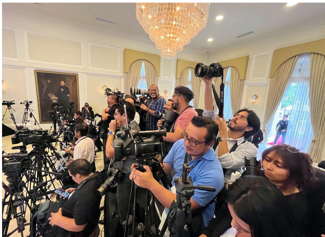
Los periodistas y defensores de derechos humanos son los principales afectados según monitoreo de FESPAD.

El primero de esos tres derechos fundamentales es el derecho a expresarse: “es importante que la población pueda expresar su valoración, sus criterios, sus opiniones, que pueda comentar libremente sin ningún temor o restric-