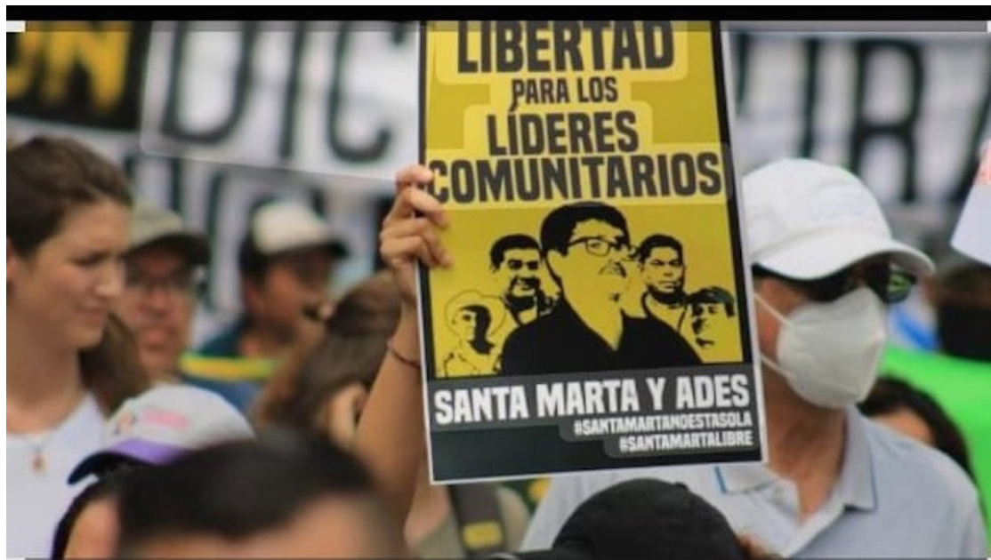
La Comunidad Santa Marta y ADES se pronuncian en el marco de los 28 meses de la detención arbitraria de los cinco ambientalistas de Cabañas, por lo que exigen justicia y su libertad.

en los próximos días, acudiremos a la Dirección de Investigación Judicial de la Corte Suprema de Justicia (CSJ), para que investigue el conflicto de interés de este juez”, reiteraron.