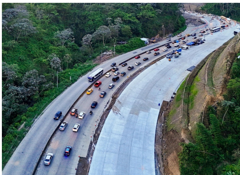
El MOP reabrió el paso vehicular en el tramo Los Chorros, después de dos que permaneció cerrado debido a dos derrumbes.