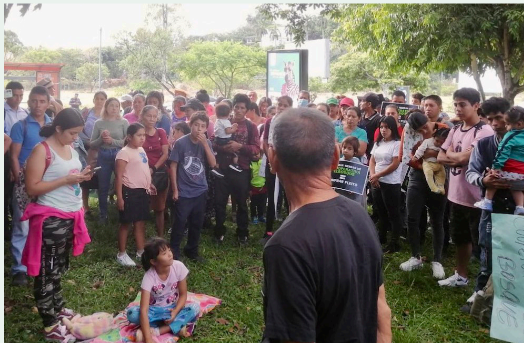
La Cooperativa El Bosque junto con Reverdes denuncian que hay una orden de desalojo para 300 familias de la zona.