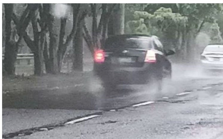
El MARN prevé para la noche de este lunes lluvias y tormentas, debido a sistema de alta presión que permite el ingreso de humedad.

“Por la noche, el cielo estará nublado en todo el territorio, con lluvias y tormentas desplazándose sobre la zona central y oriental, mientras que, en la cordillera Apaneca - Ilamatepec existe una baja probabilidad de lluvias puntuales”, señaló el