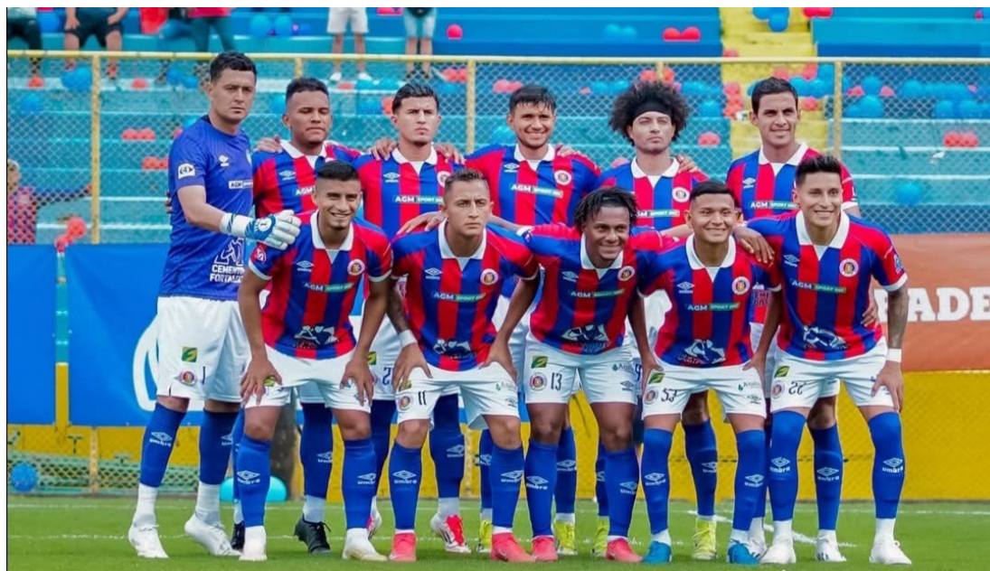
Todo listo para las semifinales. De forma sorpresiva, el FAS no solo clasifica, sino que dejó fuera al favorito incluso para llevarse la copa del Clausura 2025, el Club Deportivo Águila.

El otro equipo clasificado, con alguna sorpresa, fue Fuerte San Francisco, pues venció en penales al favorito Luis Ángel Firpo.