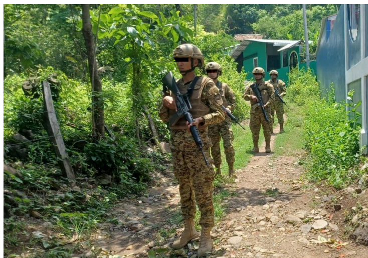
Los militares exigieron a los periodistas borrar todo el material grabado. Foto Diario Co Latino/imagen de referencia.