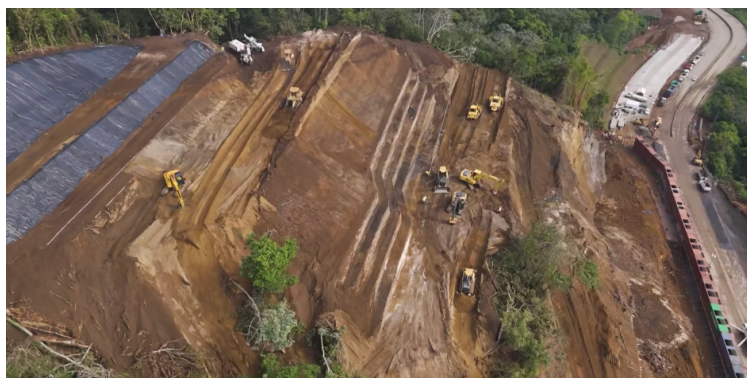
El MOP informa que para habilitar el paso vehicular en el tramo Los Chorros, han ampliado carriles adicionales.

Señaló que han llevado la maquinaria y equipo necesario para hacer perforaciones y anclajes, algunos serán desde 20 hasta 35 me-