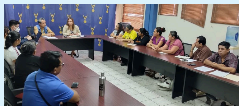
MOVIR señala que la PDDH se declara incompetente, en facilitar la comunicación entre privados de libertad y sus familias.