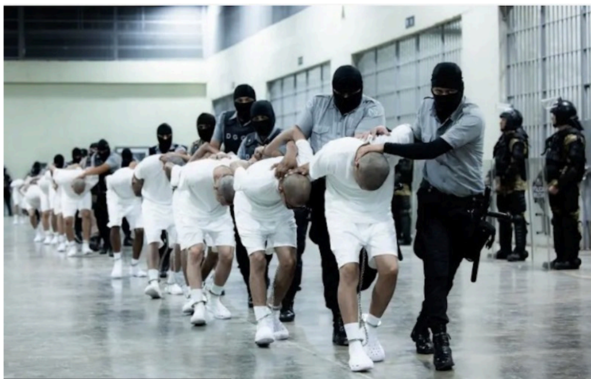
Organizaciones internacionales de defensa de derechos humanos presentan una demanda ante la Comisión Interamericana de Derechos Humanos (CIDH) para la liberación de los venezolanos deportados de Estados Unidos y recluidos en el CECOT.

“Este informe es uno más que se confirma a nivel internacional que en El Salvador no se garantiza el debido proceso judicial ni garantía de un juicio justo, ni para los salvadoreños ni para extranjeros. Toda persona está en riesgo de sufrir una situación igual o peor”, valoró la activista de los derechos hu-