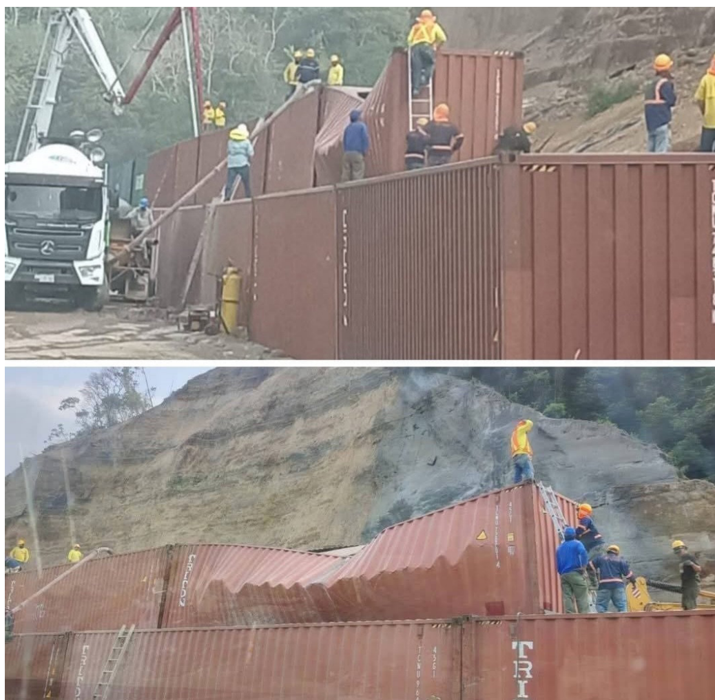
Internautas de la Red X, reaccionan contra las medidas de mitigación en tramo de la carretera de Los Chorros, por el colapso de un contenedor lleno de lodocreto, que servirá de barrera de contención a otros deslizamientos, desde este 11 de mayo.

@NudulEl expresó: El proyecto de esa carretera es un total fracaso. Mientras que la usuaria @BeaDíaz04 preguntó: Cuánto nos estará costando tanta improvisación.