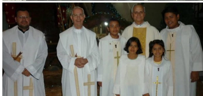
“León XIV es un papa cercano a El Salvador” dice una leyenda al pie de unas fotos circuladas en las redes, tomada en la Divina Providencia, en 2012, en la Colonia Atlacatl, San Salvador.

la que Él continuará edificando su iglesia.