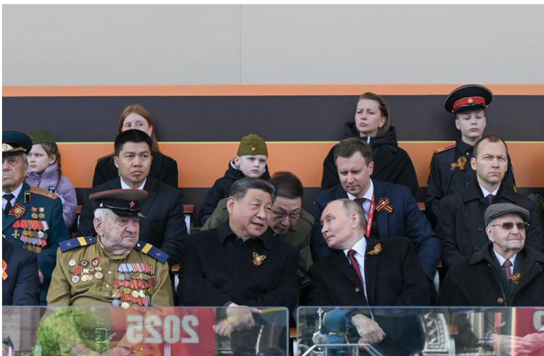
El presidente chino, Xi Jinping, asiste a las celebraciones con motivo del 80º aniversario de la victoria en la Gran Guerra Patriótica de la Unión Soviética, en Moscú, Rusia, el 9 de mayo de 2025.

En un discurso pronunciado en el evento, Putin dijo que la Unión Soviética defendió la paz y la libertad para toda la humanidad a costa de decenas de millo-