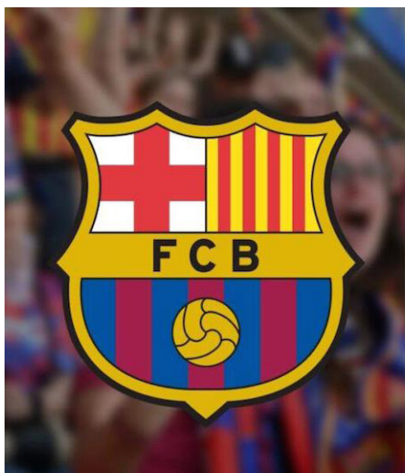
Madrid/Prensa Latina Por Fausto Triana