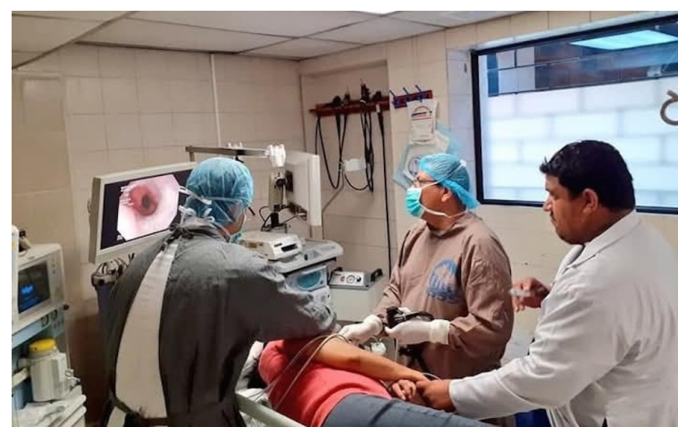
El SIMETRIS señala que a partir de abril a los médicos interinos, quienes trabajan de forma temporal, les serán suspendidos los contratos.

A criterio del secretario general del SIMETRIS, esta crisis podría ser un pretexto para las autoridades para fusionar el ISSS con el Ministerio de Salud, lo cual, según algunos empleados se viene dando