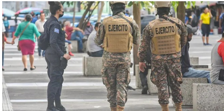
El régimen de excepción estará vigente hasta el 5 de mayo.