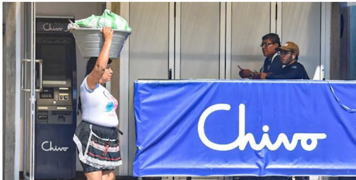
El FMI ha impuesto restricciones severas que limitan su uso obligatorio por parte de las empresas y exige la publicación de los estados financieros de la billetera digital Chivo Wallet.