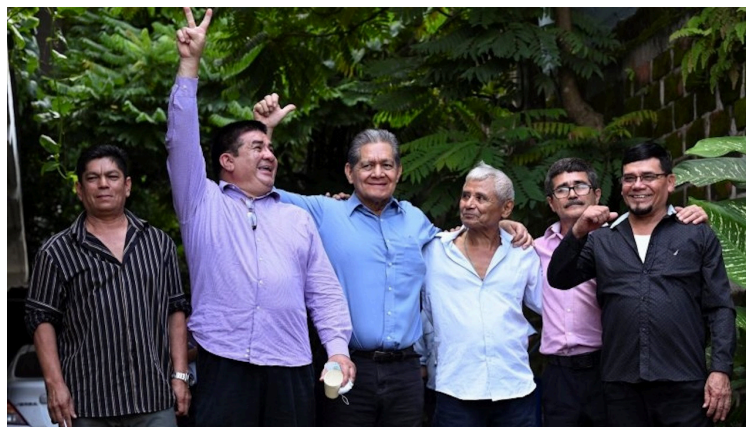
La Asociación Americana de Juristas (AAJ), reitera apoyo a los defensores ambientalistas de ADES Santa Marta en Cabañas. Ante actos violatorios a los derechos humanos bajo el régimen de excepción contra los líderes comunitarios.

cución política de los defensores de los derechos humanos”, exigió la Asociación Americana de Juristas, sobre todo, luego de la aprobación de la Ley en favor de la Minería, en diciembre de 2024, que abre las puertas a las empresas transnacionales mineras para operar en El Salvador, con mínimas protecciones ambientales, en un país que ya enfrenta la contaminación, la escasez de agua, la deforestación, y el deterioro del medio ambiente”, señala.