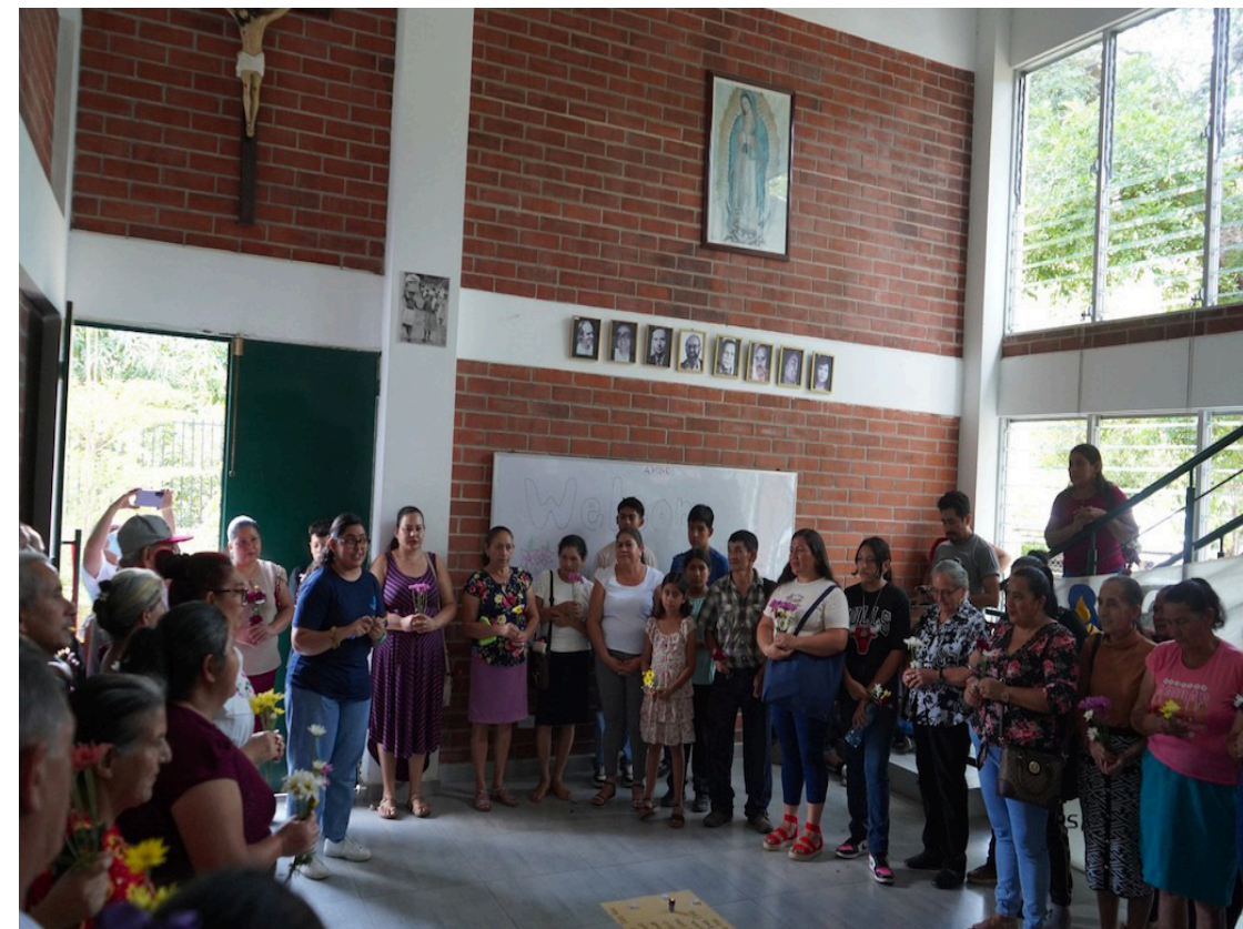
La Asociación Pro Búsqueda, integrada por los padres y madres que buscan incansables a sus hijas e hijos desaparecidos durante la guerra civil de los años ochenta. Conmemoran el Día Nacional de la Niñez Desaparecida durante el Conflicto Armado. Así como, los 20 años de la Sentencia de la Corte Interamericana de Derechos Humanos en el caso de las Hermanitas Serrano Cruz.

“Luego, la deuda del Banco de Perfiles Genéticos, no se ha avanzado en ello, no lo ha creado el Estado, ni tampoco ha creado una página web con suficiente información de los casos. Cancillería tiene una página, pero con un acceso muy difícil