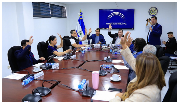
La Comisión de Hacienda emite dictamen favorable para incorporar $24 millones al Presupuesto General de la Nación para la seguridad hídrica del río Lempa.

Es de recordar que la Asamblea Legislativa ratificó, el 11 de diciembre de 2024, un financiamiento al Acuerdo de Fondeo para Conservación (CFA por sus siglas en inglés), por un monto de $350 millones en un periodo de 20 años. Conforme a dicho acuerdo, el total de los pagos periódicos que el Ministerio