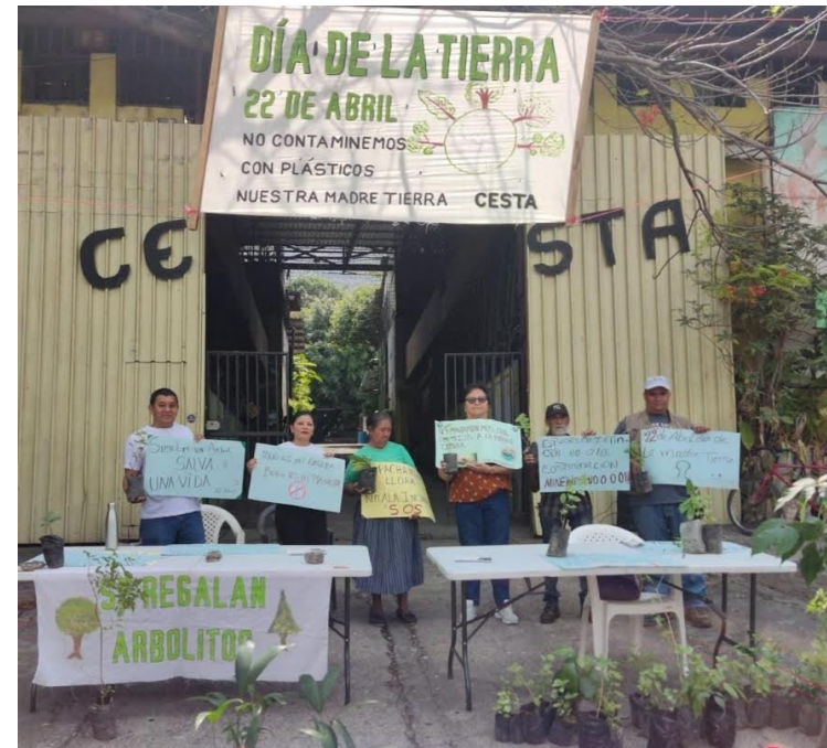
En el Día Internacional de la Madre Tierra, celebrado el 22 de abril de cada año, el CESTA entrega árboles y plantas ornamentales para mejorar el medio ambiente.

Navarro indicó que de no detener este comportamiento llegará a destruir la civilización, cada día las crisis se van haciendo más graves, es importante reflexionar que no solo importa la producción ni el consumo, sino debe hacerse en una rela-