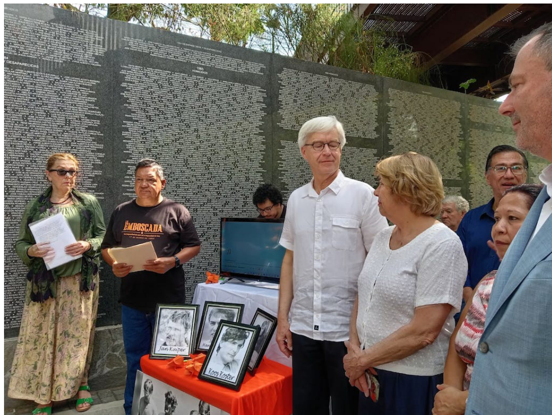
La Mesa Contra la Impunidad en El Salvador (MECIES), ASDEHU y Fundación Comunicándonos, acompaña el caso de los 4 periodistas holandeses, que tendrá su vista pública hasta el 3 de junio, en el Centro Judicial de Chalatenango.