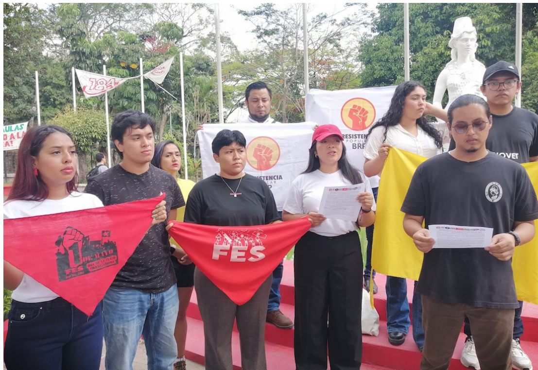
Estudiantes y representantes del BRP anuncian que se unirán a la marcha de este 1 de mayo para conmemorar el Día Internacional de la Clase Trabajadora.