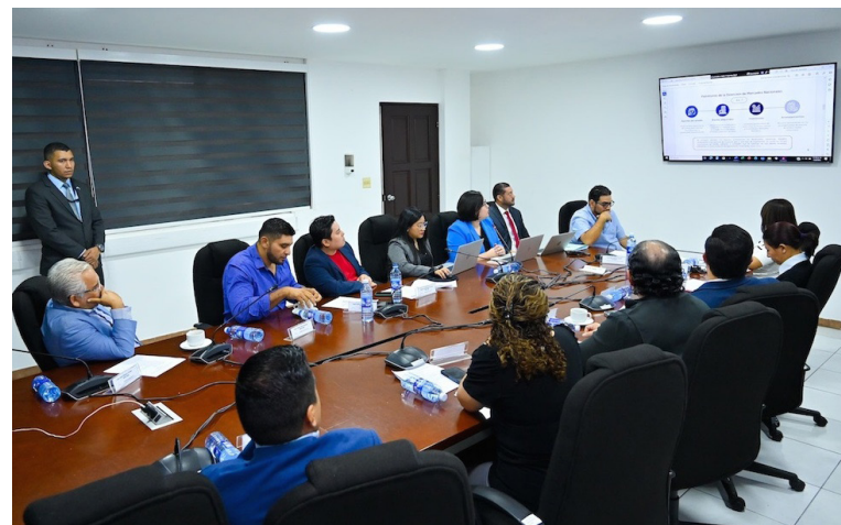
Comisión sesionó apenas 32 minutos y el tiempo de exposición para los representantes de Economía fue apenas de 15 minutos.

La presentación y “explicación” del decreto se trató en menos de 15 minutos. La Comisión no emitió dictamen.