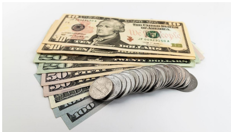
Las perspectivas de crecimiento de El Salvador están muy por debajo del 2%.