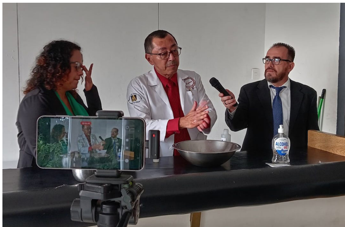
Colegio Médico aconseja a la población salvadoreña prevenir infecciones gastrointestinales y respiratorias con el lavado de manos y el consumo de alimentos higiénicamente preparados.

En cuanto a las familias que se quedan en sus hogares, el presidente de COLMEDES aconsejó a padres y madres de familia doblar las “medidas de protección”, como cubrir los alimentos y