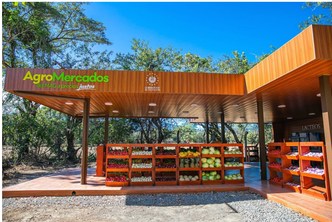
Los agromercados y las centrales de abastos no estarán regulados por la Ley de Creación de la Dirección de Mercados Nacionales.