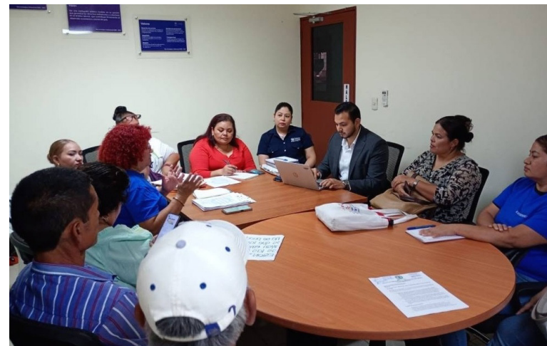
Los sindicalistas que denuncian que alcaldías están obligando a los empleados a trabajar en las vacaciones de Semana Santa, entre otras violaciones se reunieron este lunes con el Jefe del Departamento de Inspecciones del Ministerio de Trabajo, la Directora de Trabajo y el Jefe de Organizaciones Sociales.

“Ministro le hacemos el llamado para que usted ordene a esta je-