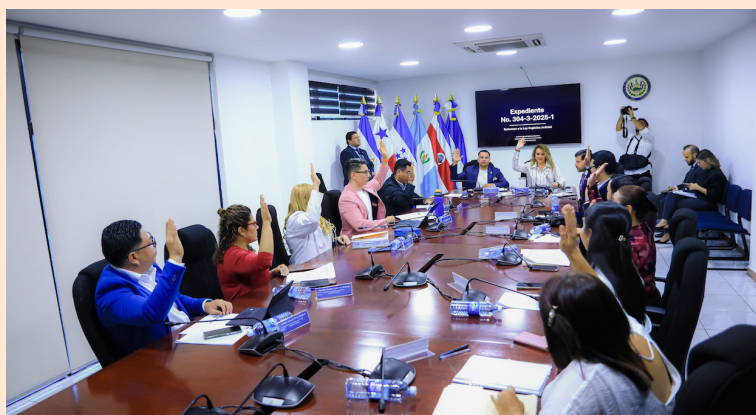
El dictamen será aprobado esta semana en el pleno legislativo.

sión que actualmente el Juzgado de Armenia tiene competencia mixta, es decir, que el juez conoce casos civiles, mercantiles, laborales y penales; sin embargo, es necesario que las instancias judiciales se especialicen.