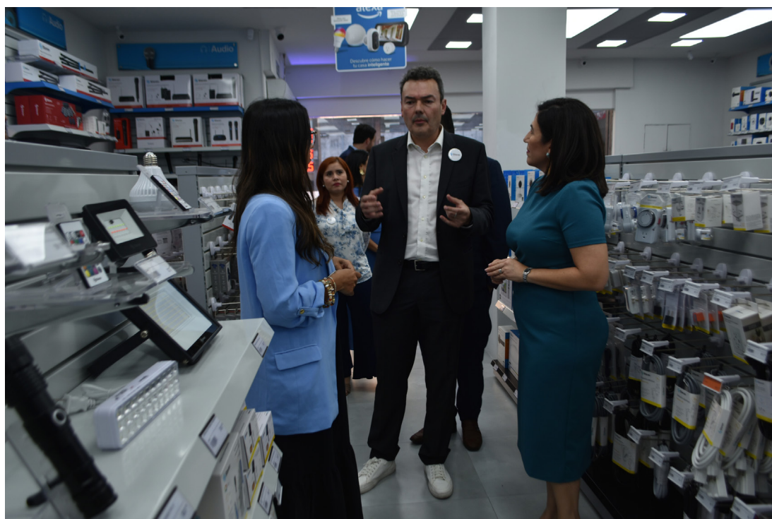
Representantes de Steren y del Gobierno realizan un recorrido por la tienda ubicada en el Centro Histórico de San Salvador.