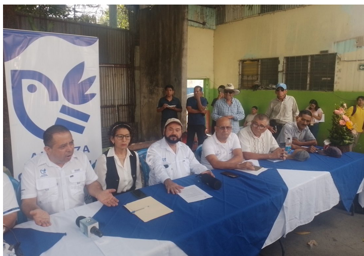
Representantes de “Alianza Ciudadana” brindan conferencia de prensa para informar sobre el inicio de un nuevo partido político “de centro” que apoyaría a Bukele.

Silva dijo que están convencidos de que “solo participando podremos impulsar los cambios