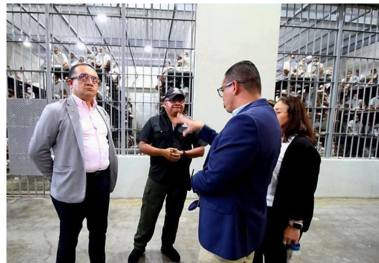
Una delegación del Gobierno de Costa Rica, liderada por el ministro de Justicia y Paz, Gerald Campos Valverde, visita el CECOT para conocer el plan de El Salvador en materia de seguridad.

Además, reiteró su interés en adoptar las prácticas salvadoreñas para modernizar el sistema penitenciario de su país. Reconoció que Costa Rica enfrenta desafíos similares relacionados con la criminalidad y la impunidad, y que es necesario avanzar en la cons-