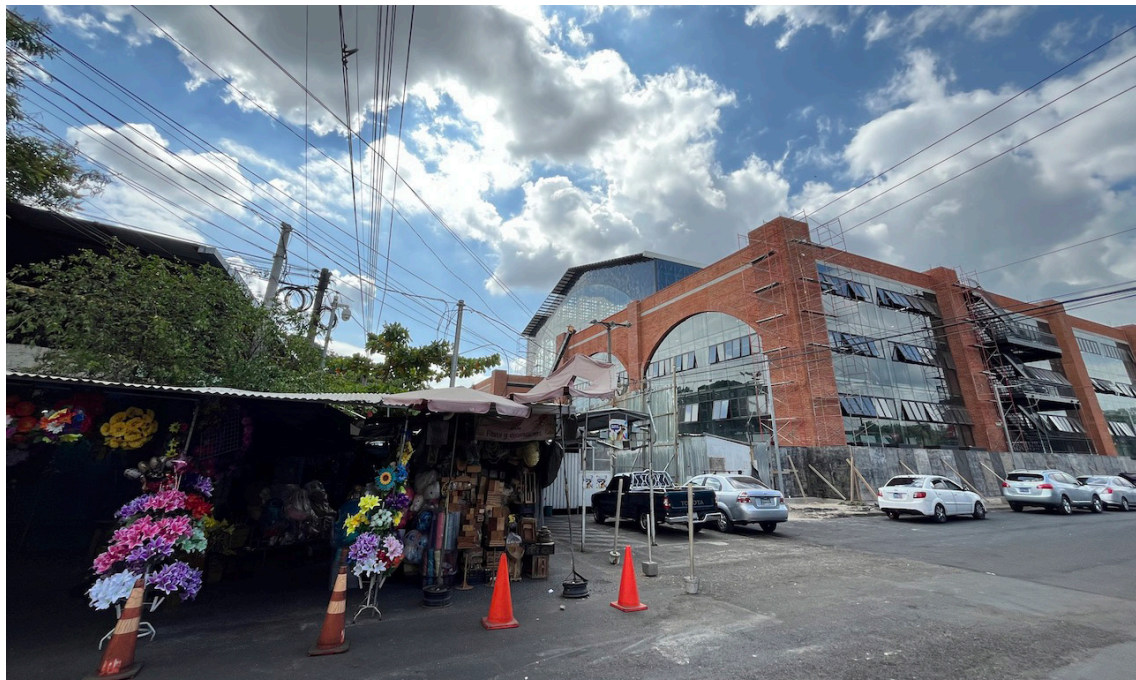
Comerciantes ubicados en la 2da Avenida Norte, a un costado del nuevo mercado San Miguelito temen ser desalojados y ser enviados a sus casas ya que las autoridades pretenden remodelar la calle.

Un medio de comunicación local informó la tarde del viernes, que la comuna capitalina realizaba una reunión informativa con vendedores del Mercado San Miguelito; esto, luego de varios meses sin sostener pláticas.