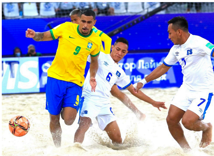
El Salvador enfrenta a Brasil en la Copa Mundial de Beach Soccer de la FIFA Rusia 2021.

Grupo B: Mauritania, Irán, Portugal y Paraguay