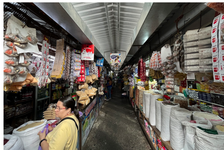
La nueva Dirección de Mercados asumirá la administración de los mercados a escala nacional y en la ley, se prohíbe la venta ambulante tanto dentro como fuera del inmueble.

En el artículo 28 literal A, establece la prohibición de la venta ambulante en el interior del mercado y la circulación y comercio ambulante hasta una distancia de cien metros de su perímetro; es decir, se prohíben las ventas ambulantes en un rango de 100 metros del mercado.