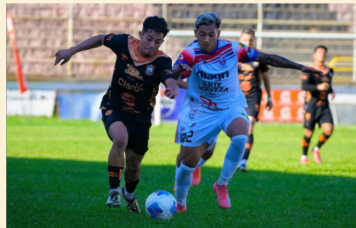
Una instantánea del partido Águila y Luis Ángel Firpo. Los migueleños vencieron a los toso 3 a 1.

cimo sexta fecha, la tabla de posiciones quedó de la siguiente manera: