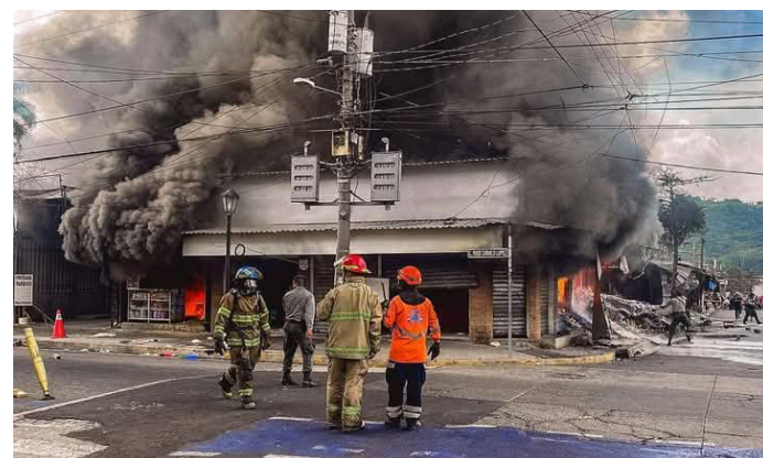
Desde el 1 de enero al 30 de marzo, se registran 1,668 incendios, el año pasado la cifra fue 2,374; lo cual, representa una reducción del 30%.

“La reducción en las estadísticas de los incendios es el resultado del trabajo en áreas de prevención por parte del Cuerpo de Bomberos, que cuenta con más de 120 inspectores que tra-