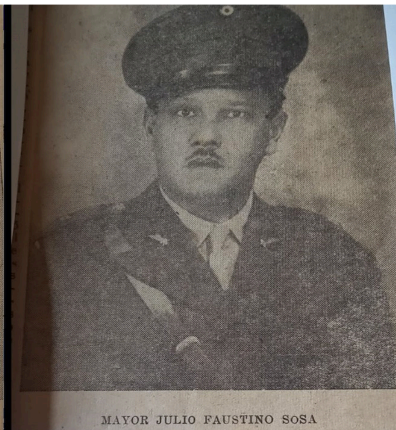
MAYOR JULIO FAUSTINO SOSA