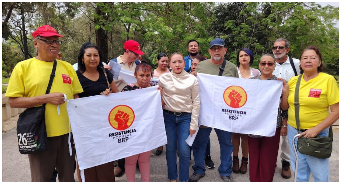
El BRP invita a la población a la marcha del Día Internacional de la Clase Trabajadora, este 1º de mayo desde el parque Cuscatlán hacia el centro de San Salvador.