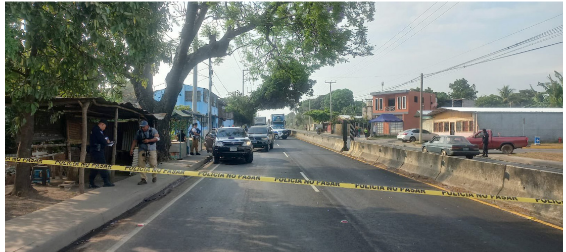
La escena es procesada frente a la gasolinera del redondel cantarrana km 63 ½ Santa Ana.

Jurado era el principal sospechoso de cometer un feminicidio a una hondureña en el caso Cantora, cantón Tecomatal