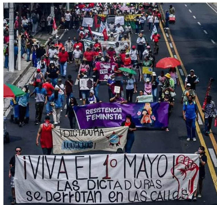
Entre las razones para marchar este 1º de mayo están, el fin de los desalojos de quienes trabajan por cuenta propia.

“Invitamos a todos los sectores a movilizarse este primero de mayo, e incorporarse a esta marcha que no sólo busca reivindicar la memoria histórica, sino luchar por transformar la situación que hoy tenemos”.