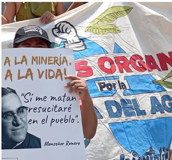
Organizaciones sociales, ambientales y religiosas muestran su rechazo a la minería, por los efectos nocivos en la población.

“Hay sacerdotes que por su corazón político no les permite tomar una decisión racional y mucho menos de fe, no tendría que haber duda porque es el principio vital el que está en juego”