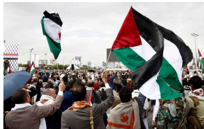
Imagen del 28 de marzo de 2025 de personas gritando consignas mientras participan en una manifestación para protestar por los ataques aéreos estadounidenses contra Yemen, en Saná, Yemen.

La tensión entre los hutíes y el ejército estadounidense ha escalado desde que Washington empezó a lanzar nuevos ataques aéreos contra Yemen el 15 de marzo. Los ataques se producen luego de que los hutíes amenazaron con reanudar los ataques contra objetivos israelíes a menos que se permita la entra-