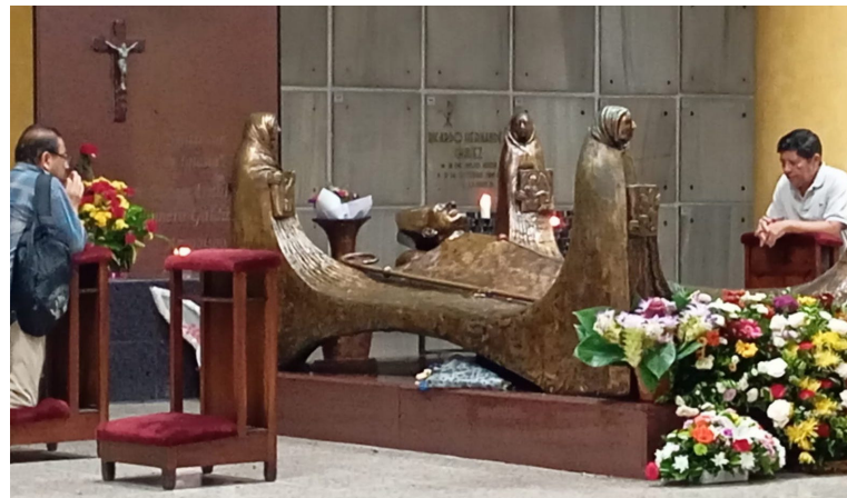
Cada domingo en la Cripta de Catedral Metropolitana, feligreses visitan el mausoleo donde reposan los restos de Monseñor Romero.

Previo a la eucaristía celebrada en la Cripta de Catedral Metropolitana se reflexionó de las enseñanzas de Monseñor Romero. En este cuarto domingo de Cuaresma hizo referencia a la parábola del hijo pródigo, la cual representa el proyecto de Dios que es la reconciliación de los hombres con Cristo y ellos mismos.