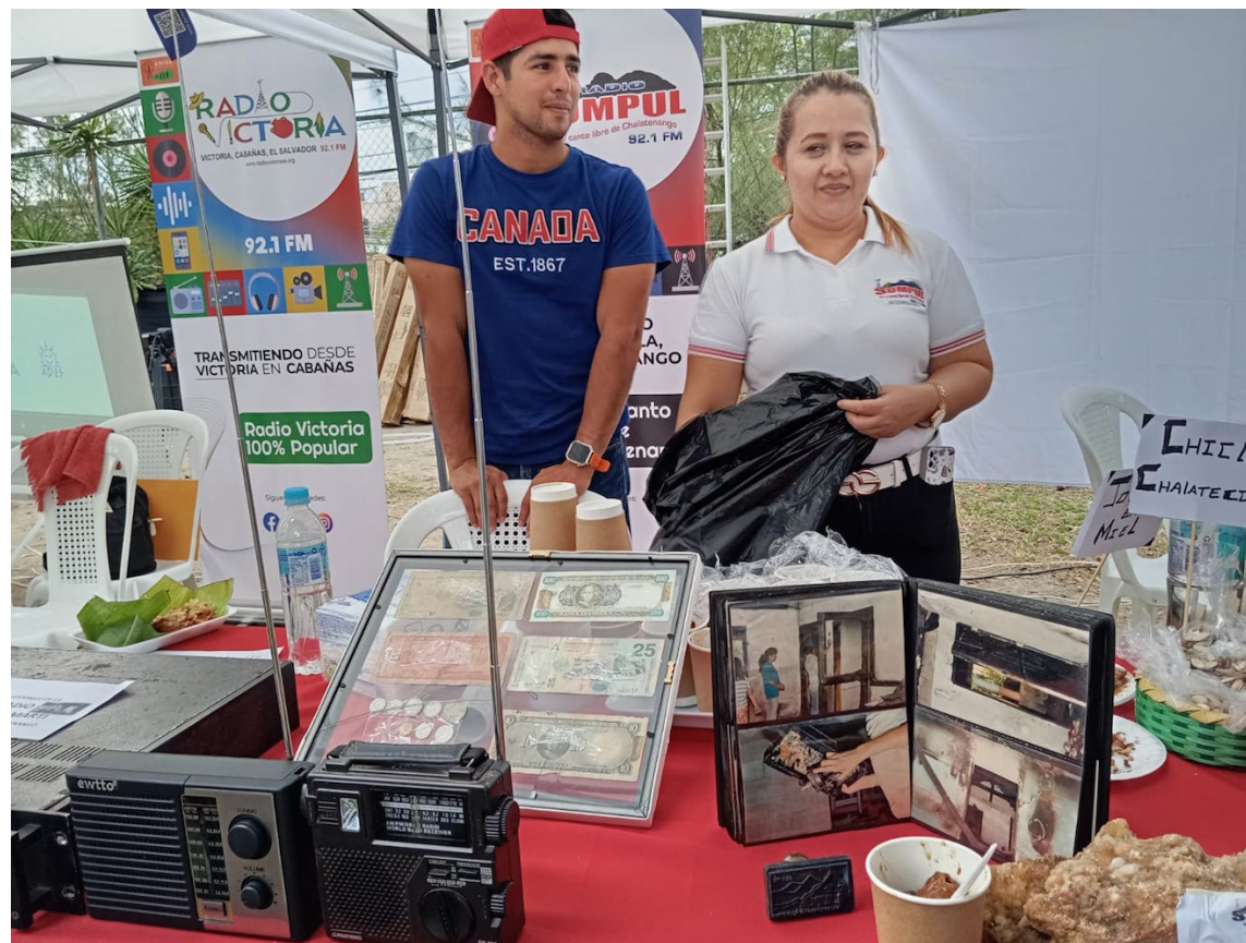
ARPAS celebra sus 31 años de fundación con el “Festival de los Medios Comunitarios”, donde todas las radios comunitarias aglutinadas expusieron parte de sus antiguos equipos.

“En medio de esa crisis, también hay luchas, esperanzas y alegrías, este encuentro nos une y acerca, ya somos una red, pero juntarnos, abrazarnos y compartir, hace que estemos todavía más unidos; en medio de este amargo capítulo también podemos convivir, encontrarnos para seguir denunciando todo lo que está pasando”, sostuvo.