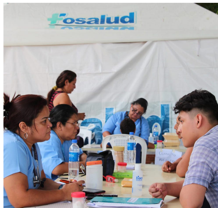
SITRASALUD-FOSALUD denuncia la desarticulación de las Unidades Móviles, cuya función era acercar los servicios de salud en lugares retirados.

terponer las denuncias y darles seguimiento jurídico, para que no se repitan estas acciones malintencionadas.