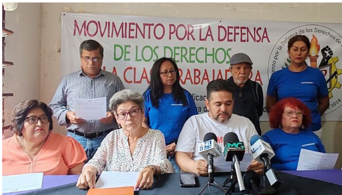
El Movimiento por la Defensa de los Derechos de la Clase Trabajadora hace un llamado a todos los sindicatos y movimientos populares, para unirse en una sola marcha este 1º de mayo.