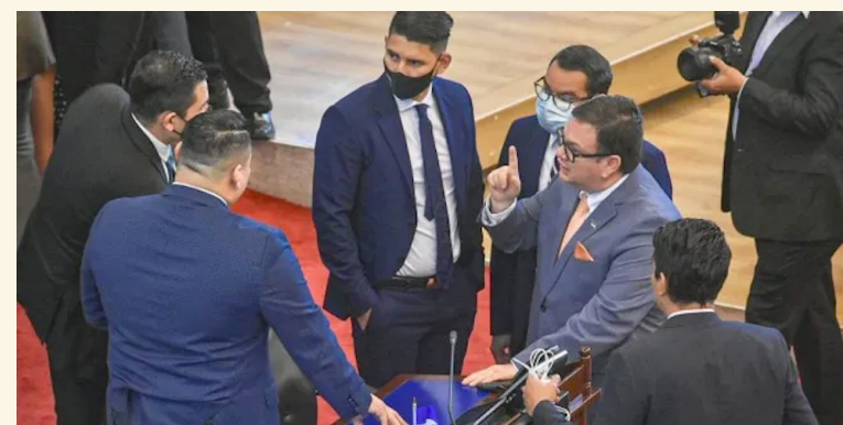
Nuevas Ideas aprueba de forma exprés, un préstamo por $500 millones.