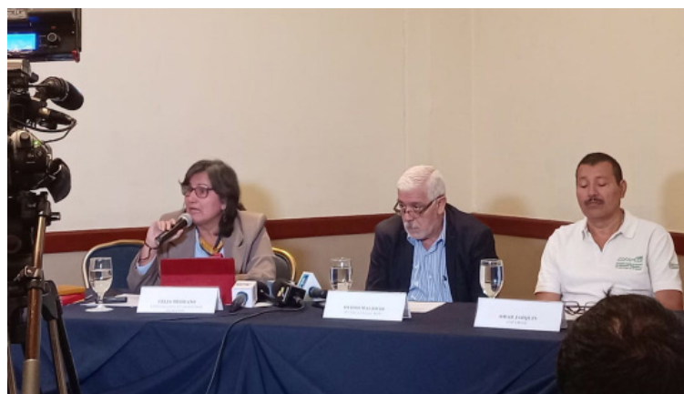
Tutela Legal “Dra. María Julia Hernández” y COFAMIDE presentaron el Tercer Informe Diagnóstico sobre las Características y Causas de la Migración Salvadoreña, que se consolida como un esfuerzo de monitoreo y análisis sobre la migración salvadoreña y su multicausalidad.

“Pese al endurecimiento de restricciones de políticas en países de tránsito y destino, la intención de emigrar por parte de pobladores de los países de origen se mantienen o aumentan”, afirmó.