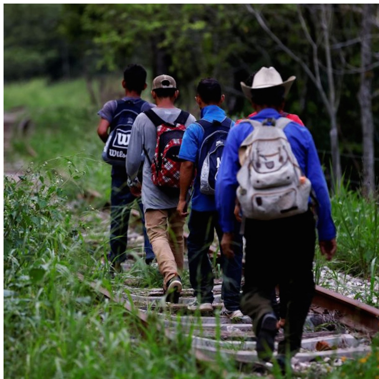
El número de detenciones de personas migrantes en los Estados Unidos y México, realizada por la Patrulla Fronteriza de Estados Unidos ha disminuido significativamente en los últimos años.

“Un deportado que ha tenido una vida y trabajo por