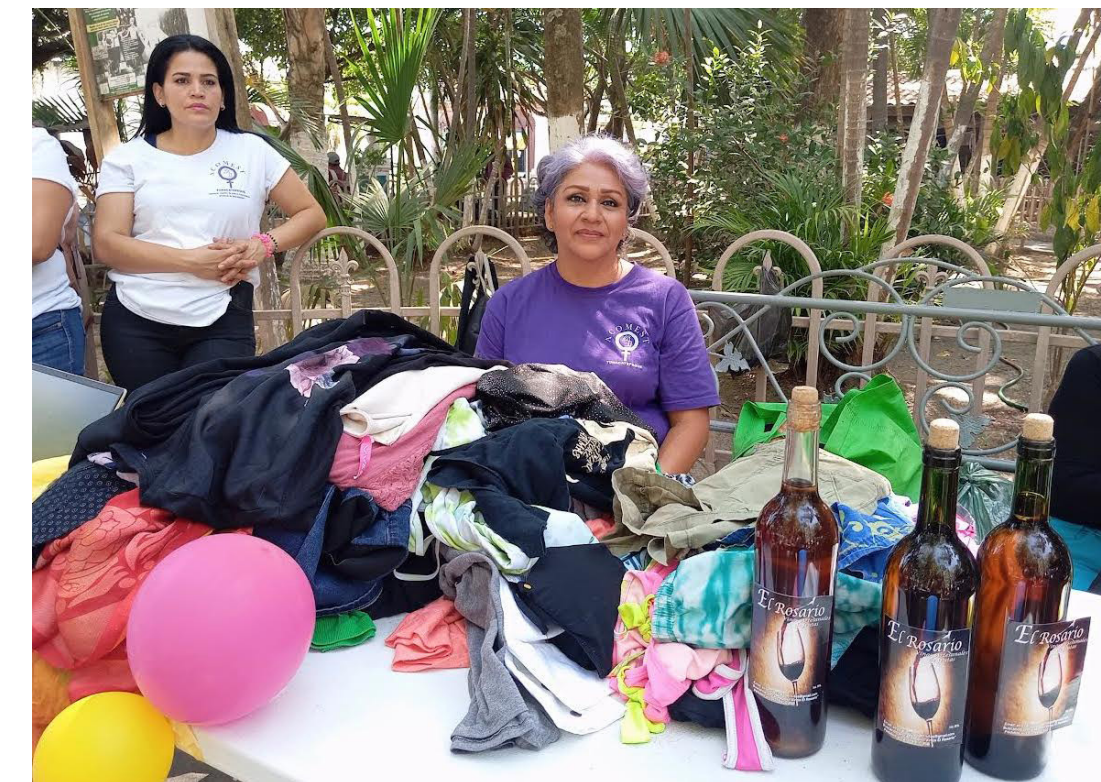
Durante el lanzamiento de la campaña, mujeres de Tonacatepeque promueven sus emprendimientos, como venta de ropa americana, elaboración de vinos y toallas sanitarias ecológicas.

“Estos son los espacios en que las mujeres vienen a presentar sus propias creaciones, nos reunimos, celebramos y a la vez nos informamos, ya que la Mesa Intersectorial conformada por la Policía, el Ministerio de Salud, la alcaldía, les hace ver que no están solas y pueden seguir de la mano con la comunidad, volviendo a retomar