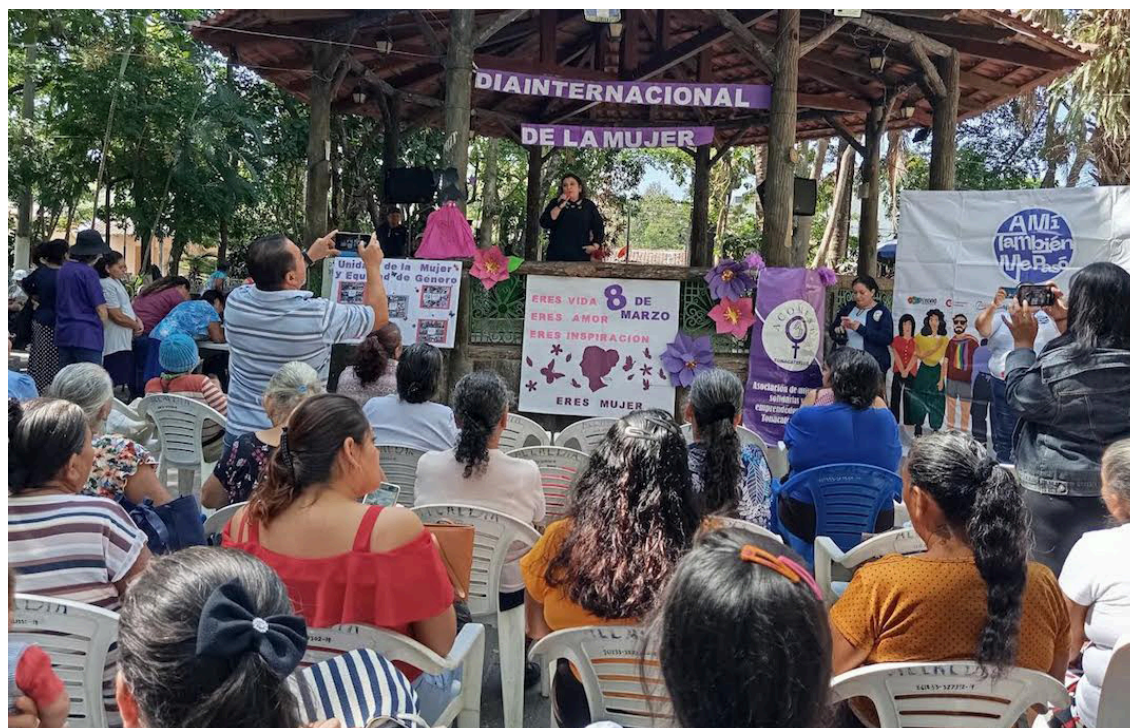
Mujeres de diferentes edades participan en el lanzamiento de la campaña “A mí también me pasó”, impulsada por la Colectiva Feminista en Tonacatepeque, para visibilizar la violencia hacia las mujeres.

tual gobierno la población LGTBI ha tenido un gran retroceso, debido al mensaje de odio de algunos funcionarios, desde antes ya sufrían de discriminación, pero ahora hay personas que se sienten con más derecho a agredir y menospreciarla.