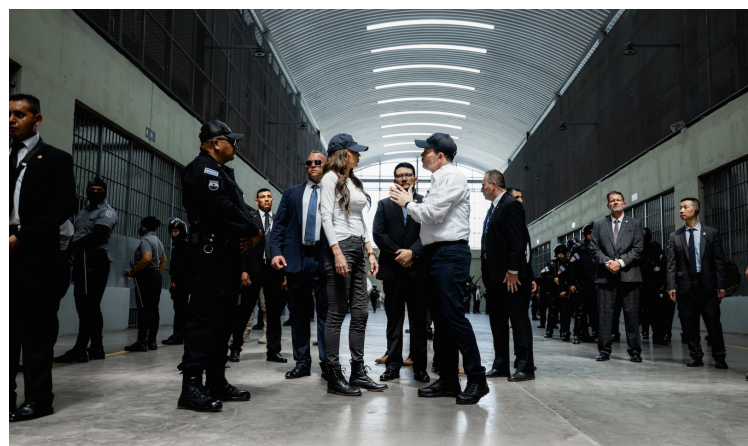
La secretaria de Seguridad Nacional de EE.UU., Kristi Noem, visita el Centro de Confinamiento del Terrorismo (CECOT), acompañada por el ministro de Justicia y Seguridad Pública, Gustavo Villatoro.

La llegada de la funcionaria estadounidense a suelo salvadoreño sucedió en horas del mediodía, según lo informó la Embajada de Estados Unidos en El Salvador. Según la embajada “durante su estancia, la Secretaria Noem abordará la cooperación entre ambos paí-