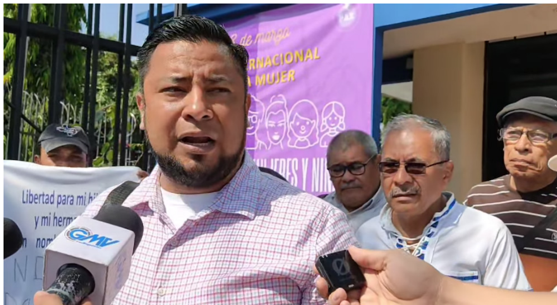
A tres años del Régimen de Excepción, el BRP pide el cese inmediato de esta medida y la liberación de todos los inocentes capturados.