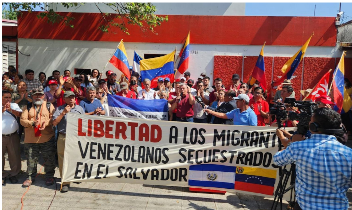
FMLN se solidariza con los detenidos venezolanos en el CECOT.