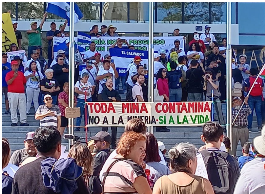
El Movimiento Voces del Futuro invita a la población a participar y fijar el rechazo a la industria minera en el país. Miembros de varias organizaciones se hicieron presentes en apoyo a la derogatoria de la Ley General de Minería.

Fuerza de Organización Popular (FOP) denunció, a través de las redes sociales “que este día desde horas de la madrugada el inconstitucional gobierno de Nayib Bukele ordenó la colocación de retenes del Ejército y la PNC en las principales carreteras del país, con la misión de detener, registrar y obligar a regresarse a los buses que procedían de diferentes lugares del país con jóvenes de “Voces del Futuro” que venían a protesta”.