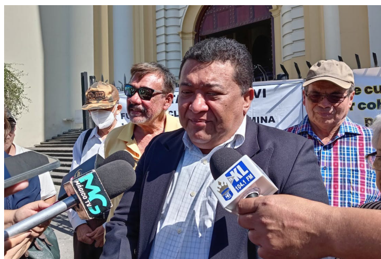
Afectados de la Cooperativa Santa Victoria (COSAVI) demandan respuestas sobre el caso de desfalco de los socios de la cooperativa, y esperan que el FMI exija al gobierno salvadoreño una respuesta sobre la crisis financiera del sistema cooperativo.

es la primera señal de la crisis del sistema financiero. El gobierno obliga a la banca privada a comprar deuda de corto plazo y es tal el nivel de endeudamiento de la banca privada que ya no puede seguir prestando dinero al gobierno”, manifestó.