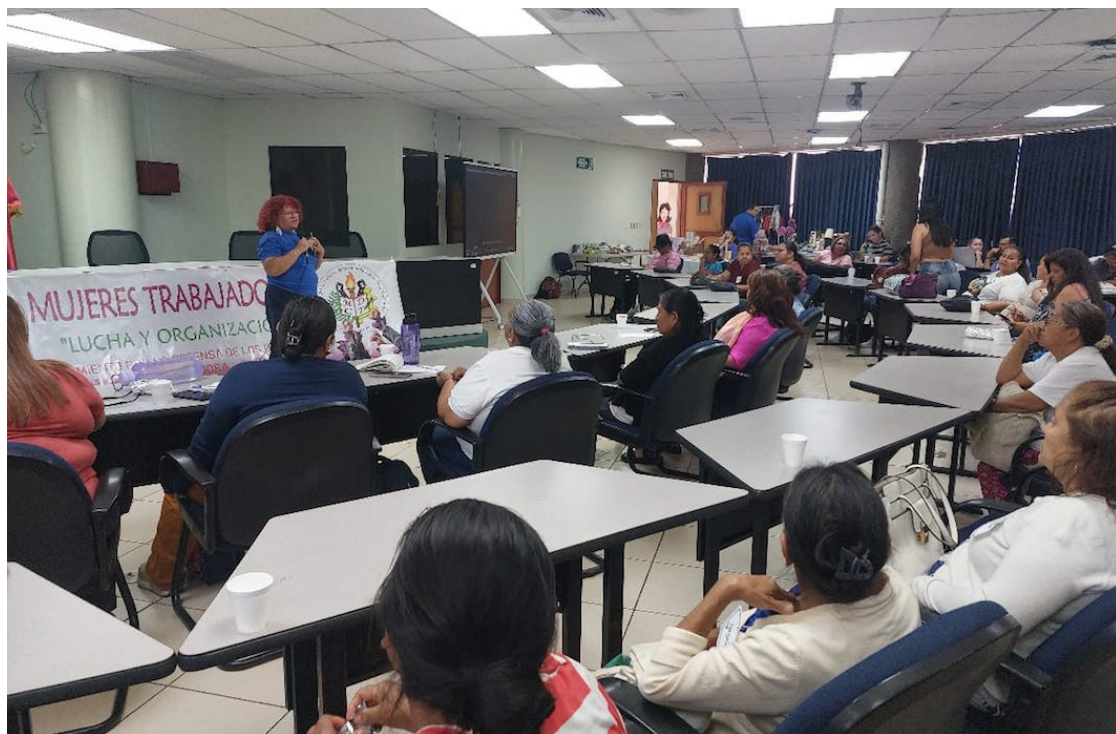
El Movimiento por la Defensa de los Derechos de la Clase Trabajadora (MDCT) realiza el Encuentro de Mujeres Trabajadoras, para reiterar la defensa de los derechos laborales del movimiento sindicalista salvadoreño.