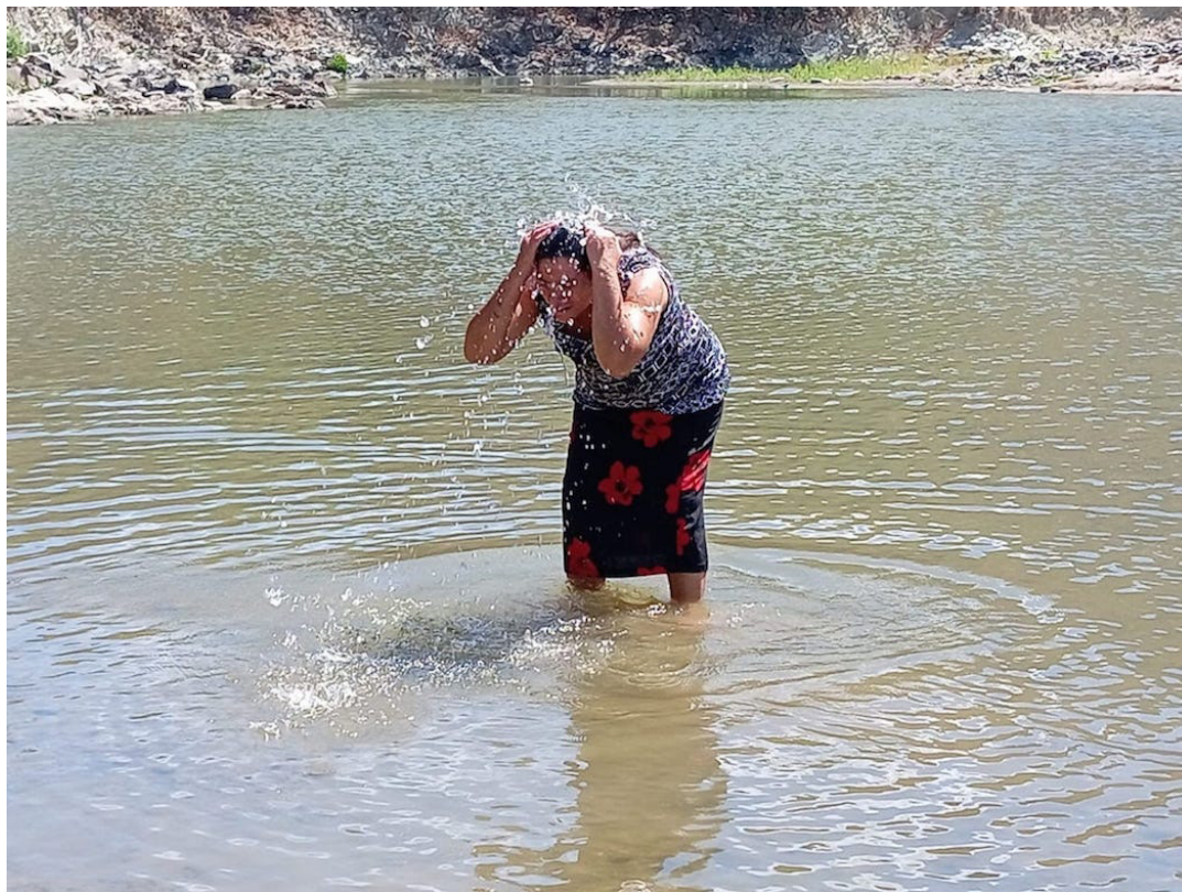
Habitantes de la comunidad La Isla, Metapán, Santa Ana, rechazan cualquier intento de minería en el país, por lo impactos a sus fuentes de agua para la pesca, consumo humano, uso en oficios domésticos, aseo y recreación.

“Recordemos que las mujeres no sólo utilizan el agua para labores domésticas y consumo humano, también significa afectación si tomamos en cuenta el riego de cultivos de sobrevivencia, porque no sólo el hombre cultiva la tierra para producir alimentos, las mujeres además del trabajo reproducti-