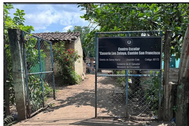
Mientras el gobierno anuncia el programa de becas para bachilleres, también continúa el cierre de escuelas, entre ellas, el Centro Escolar Caserío Los Zelayas, del cantón San Francisco, Usulután.