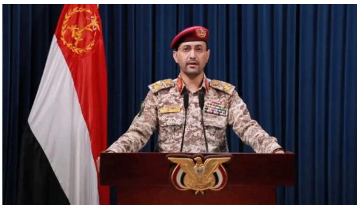
Los hutíes aseguraron que continuarán imponiendo un bloqueo naval al enemigo israelí.

“Las Fuerzas Armadas Yemeníes no dudarán en atacar a todos los estadounidenses buques de guerra en el Mar Rojo y en el Mar Árabe en represalia a la agresión contra nuestro país”, reza el comunicado.