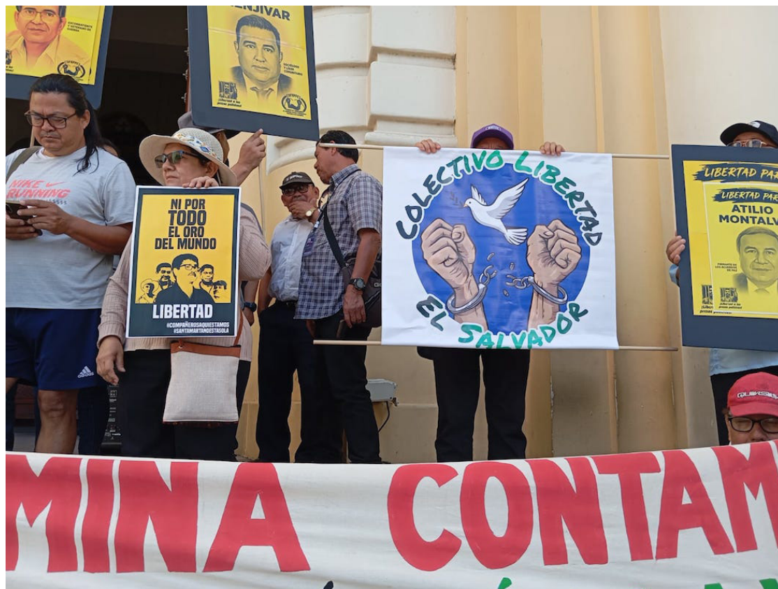
El Colectivo Libertad señala que el gobierno mantiene vigente el Régimen de Excepción, porque le sirve como mecanismo de amedrentamiento.