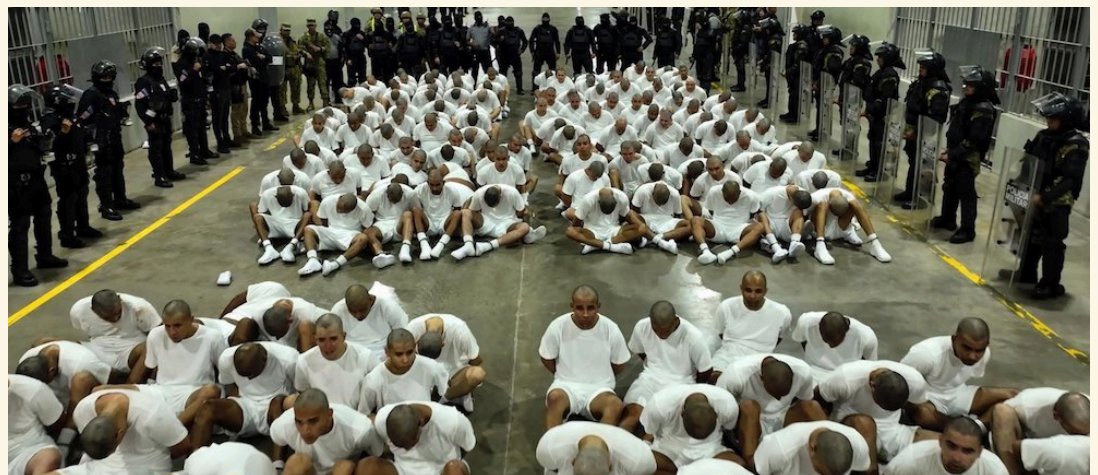
Estados Unidos envía a El Salvador los primeros 238 miembros de la organización criminal venezolana, Tren de Aragua.

Mientras tanto, el secretario de Estado de los Estados Unidos,