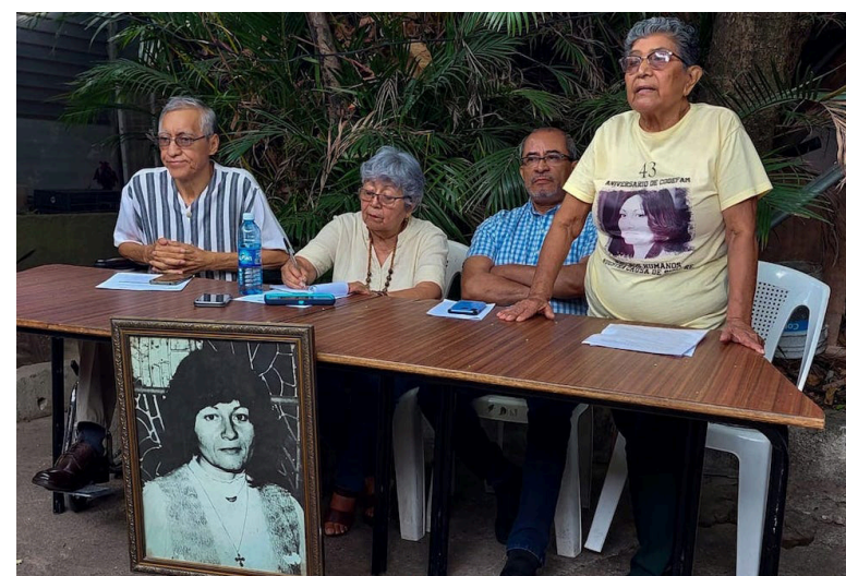
La Comisión de Derechos Humanos de El Salvador (CDHES) conmemora el 42° aniversario del asesinato de la defensora de derechos humanos, Marianella García Villas.