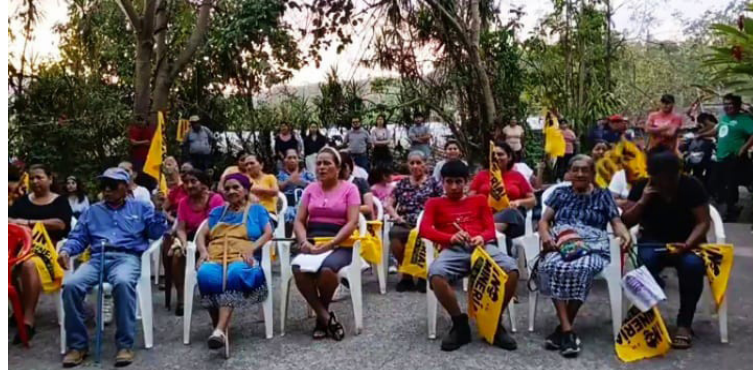
La población de Morazán participa de un acto artístico-cultural donde mostraron su rechazo a la minería metálica en el país.

En esta actividad también se unió la Universidad de El Salvador (UES) que señaló que través de las propuestas académicas y estudios científicos de la