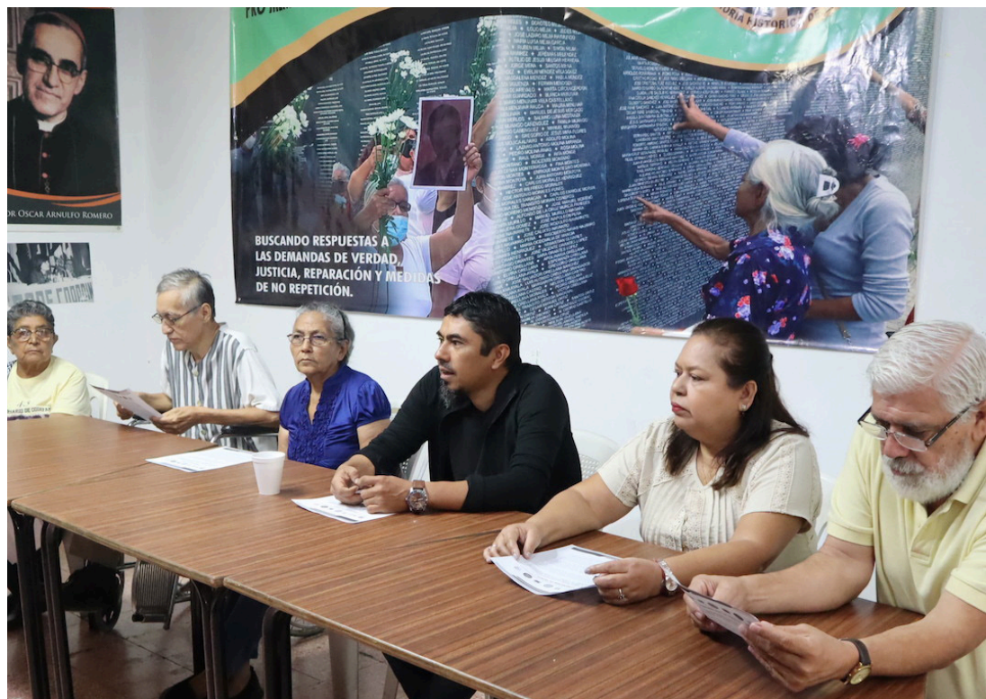
Organizaciones de derechos humanos exigen procesos de enjuiciamiento y sentencia, a los responsables de las graves violaciones durante el conflicto armado.

Victimas, sobrevivientes y organizaciones de derechos humanos señalaron que, a 32 años de la presentación del informe de la Comisión de la Verdad, el Estado continúa utilizando el Órgano Judicial para proteger a los criminales de guerra y lesa humanidad, estancando e instrumentalizando la justicia transicional para mantener ese muro infranqueable.