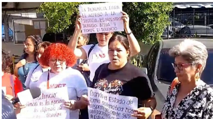
La Comisión de Mujeres del Movimiento para la Defensa de los Derechos de la Clase Trabajadora, exige el cumplimiento de convenios internacionales en defensa de los derechos laborales.

“Le cuestionamos al ministro de Trabajo, Rolando Castro, por qué ha guardado silencio con tanto atro-