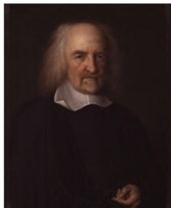
Thomas Hobbes (inglés, 1588-1679)