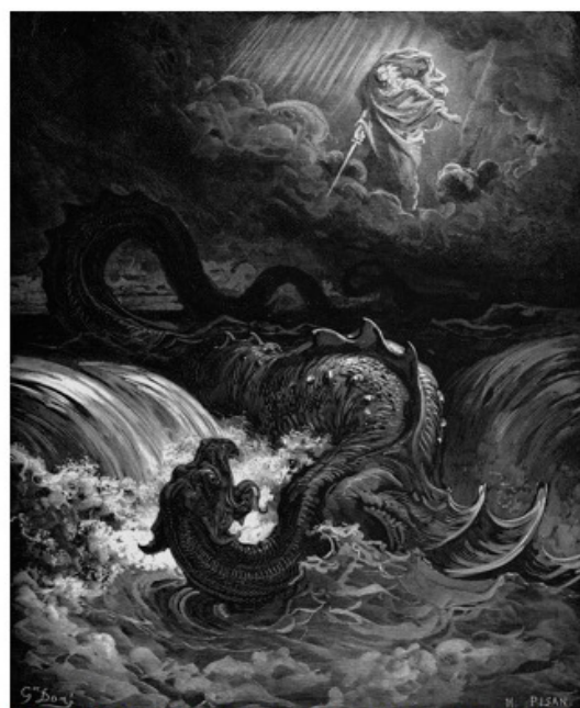
La destrucción de Leviatán (ilustración de Gustavo Doré, 1865)