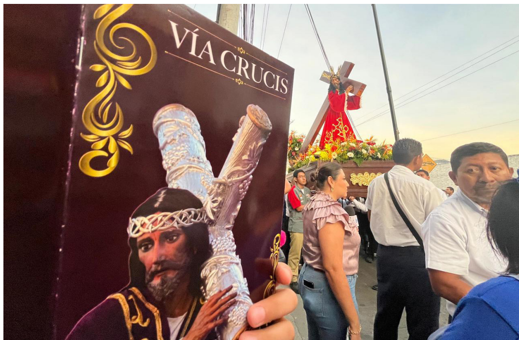
El viacrusis recuerda el sufrimiento y sacrificio de Jesús rumbo a su muerte.