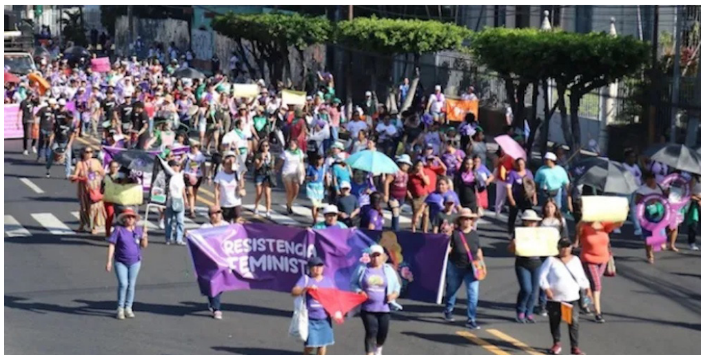
Las mujeres salen a las calles para denunciar la vulneración de sus derechos, en los últimos años se ha sumado las detenciones arbitrarias que las separan de sus familia.

o hacen política, son las primeras en ser atacadas de manera violenta y hostil tras su opinión en redes. Eso nos plantea un Estado, que, tras 200 años de ser república, aún tenemos que conmemorar el 8 de marzo porque nuestros derechos todavía no se cumplen”, puntualizó Juárez.