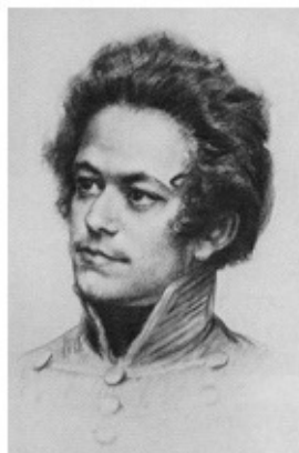
Figure 1: Karl Marx (alemán, 1818-1883)