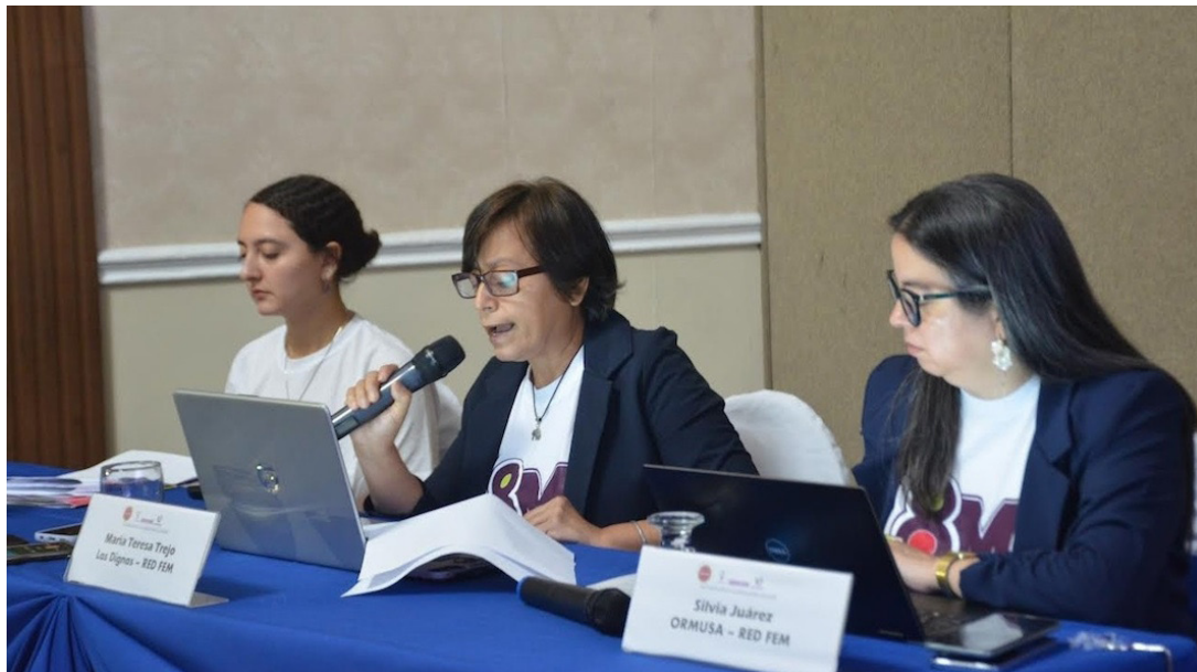
En el Día Internacional de la Mujer, este 8 de marzo, las organizaciones feministas Las Dignas, Las Mélicas y ORMUSA, que integran la RED FEM, exigen al Estado salvadoreño el cumplimiento efectivo de la LEIV y la LIE, normativas jurídicas de protección de la mujer salvadoreña.

Las cifras presentan un incremento del 15% (18, 179 casos) de hechos de violencia contra