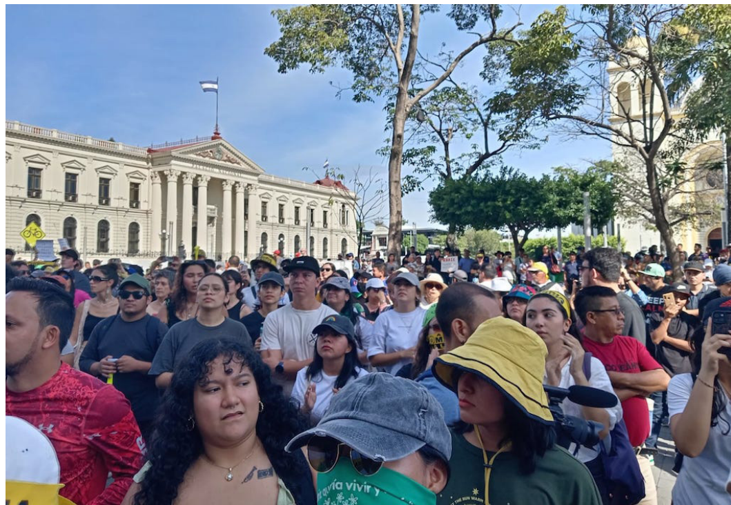
Estudiantes organizados y diversos sectores de la sociedad civil organizada se hacen presentes en el Segundo Plantón contra la Minería en El Salvador, en donde piden la derogación de la Ley General de Minería.