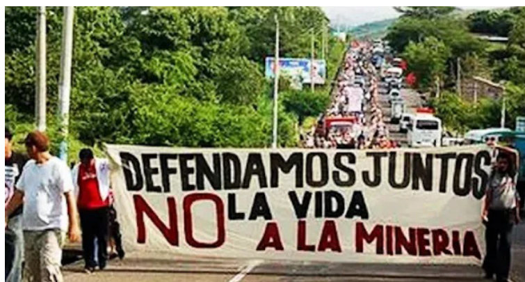
Las protestas contra la minería en el país, dejan claro que la gente le dice no a la minería.

“La población de esas comunidades de San Isidro están viviendo una situación de zozobra, ahorita, ellos están pensando ¿Qué nos va a pasar?, en