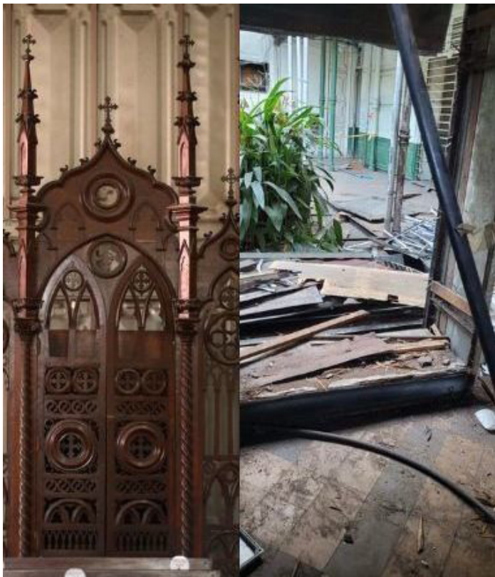
Parte de la capilla, la cual sería demolida por el Gobierno.