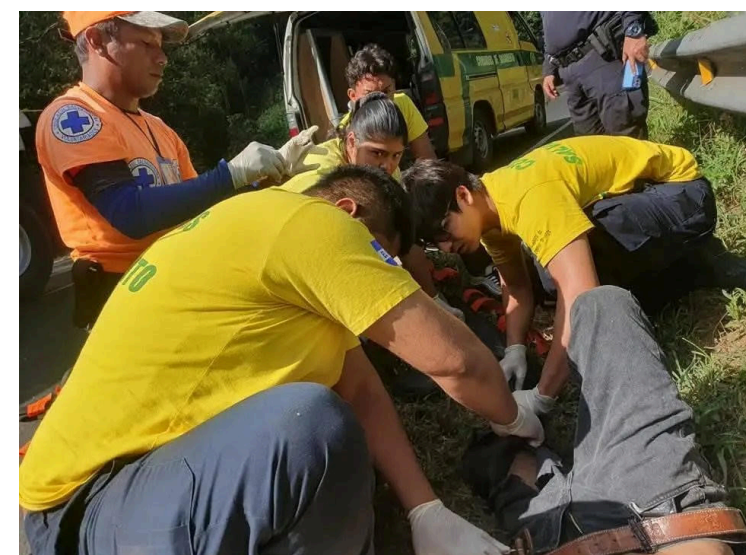
En lo que va del 2025 se registran 496 siniestros viales con 30 víctimas mortales.

En enero de 2023, armado con un corvo, el acusado profiriendo insultos y amenazas de muerte contra su expareja, entró por la fuerza a la vivienda de las víctimas, los familiares de ellas al percatarse del peligro intervinieron para defenderlas y es así como uno de ellos fue lesionado.