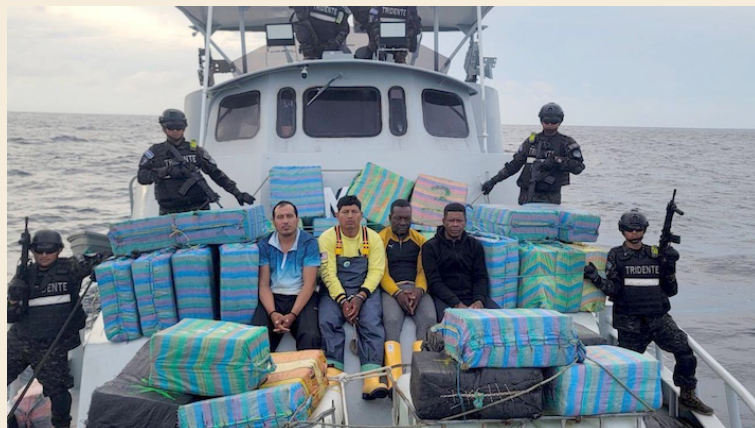
La Marina Nacional realiza incautación de droga valorada en más de $100 millones.

El presidente Bukele informó en horas de la noche del domingo que: “Nuestra Marina Nacional ha asestado un golpe histórico al narcotráfico en los primeros días de 2025, con cuatro incautaciones realizadas en una sola misión, todas en aguas internacionales, a casi 1,000 millas náuticas, incautando un total de 4.3 toneladas de cocaína”.