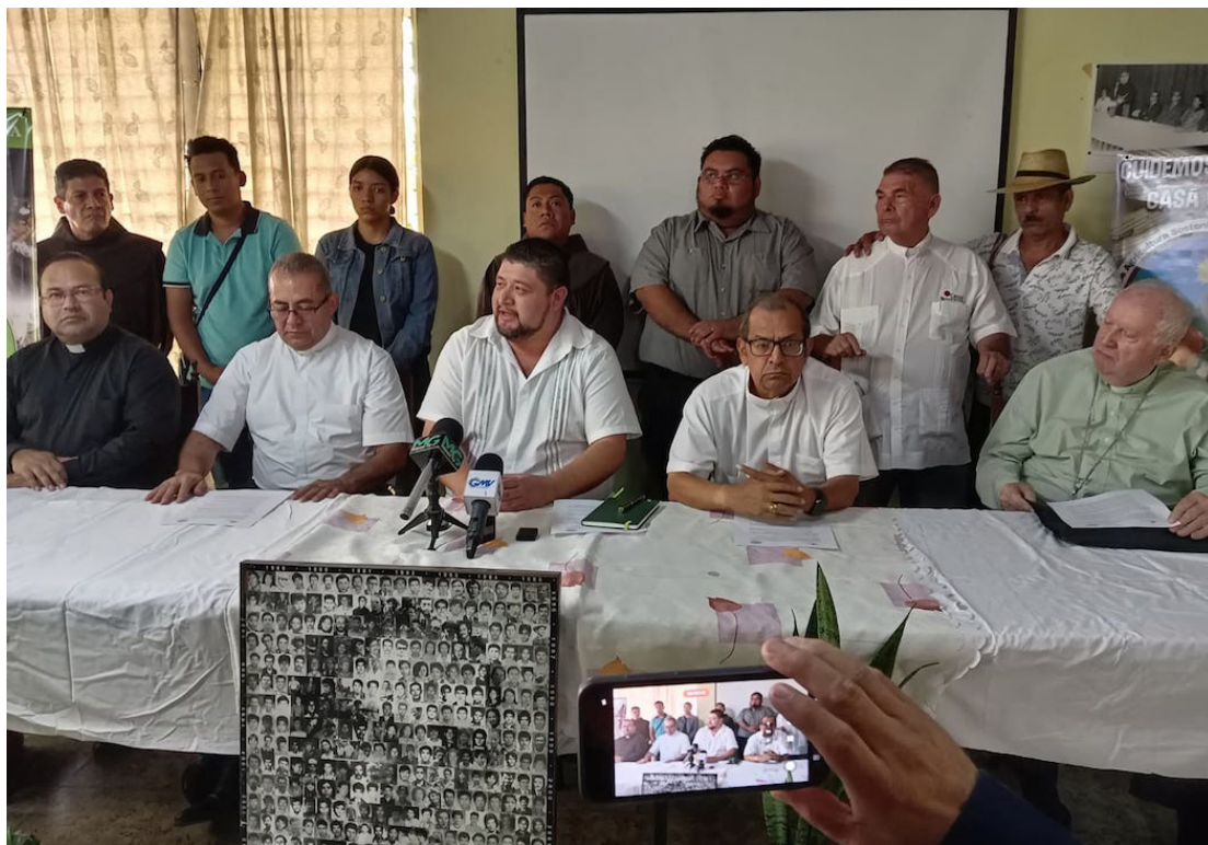
La Red Eclesial Ecológica Mesoamericana (REMAM) Capítulo El Salvador, junto al Colectivo Cuidemos la Casa de Todos, CEDES y la SEDAC, lanzan la campaña “Sí a la Vida, No a la Minería”, ante la aprobación de la Ley General de Minería.

“Hay que levantar la voz, levantar los brazos y mover los pies, que se convierte en un acompañamiento del pueblo. Y es parte de ese compromiso que hicimos con las palabras de Monseñor Romero, creo que la gente al final nos va a agradecer