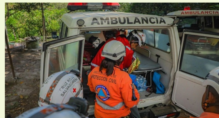
Habitantes de la zona dijeron que el área donde se encontraban las personas es de difícil acceso, por lo que se complicaron las labores de rescate, por más de seis horas.

controlar el enjambre de abejas y prevenir nuevos incidentes.