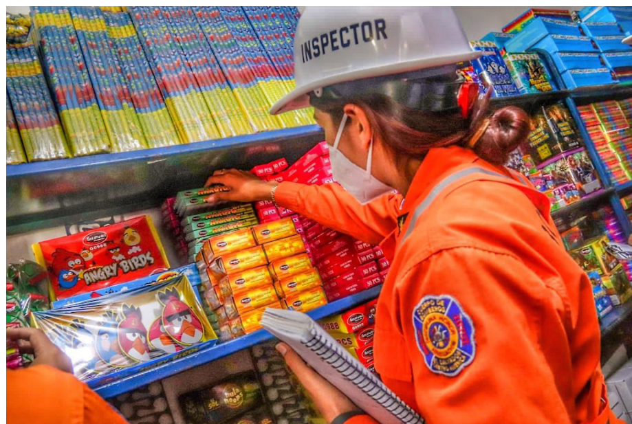
Cuerpo de Bomberos inspecciona la cadena de producción y distribución de pirotecnia, a fin de evitar incendios en esta temporada navideña.

Recomendó que al detectar una fuga de gas se debe abrir puertas y ventanas de la casa, salir y esperar un tiempo, en caso de persistir llamar al 913 de Bomberos para que una inspección.