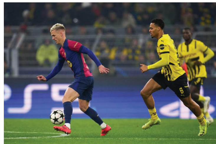
El Barcelona vence 3-2 al Dortmund en el Signal Iduna Park, en una jornada de Champions.

precisiones en su propia casa fue el Arsenal que goleó 3-0 al Mónaco para quedarse con los puntos de esta fecha, al igual que Milan ante el Estrella Roja (2-1) y el Benfica y el Bolonia