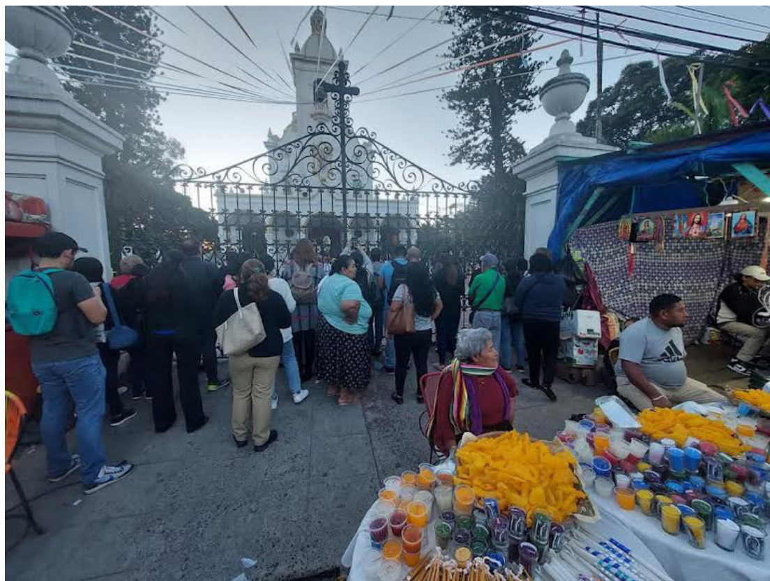
El Salvador no es la excepción en la veneración de la virgen, desde principios del siglo pasado, específicamente en 1904 inicia toda una tradición, que hasta hoy en día se refleja en el peregrinaje de fieles católicos que llegan hasta el municipio de Antiguo Cuscatlán, cercano a la capital y la ciudad de Santa Tecla.