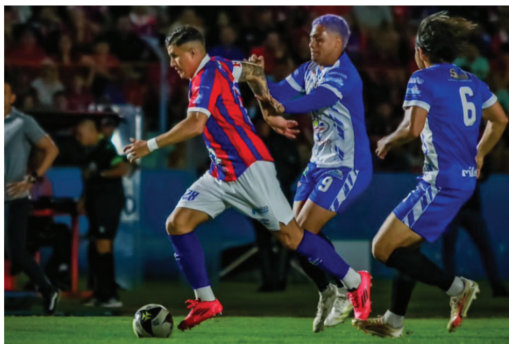
FAS vence 2-1 a Isidro Metapán en las semifinales del Apertura 2024.