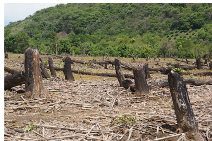
Una de las principales causas de este impacto ambiental, se debe a la deforestación, en donde El Salvador ocupa el segundo lugar del país más deforestado de América.