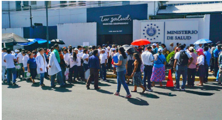
El Colegio Médico afirma que la atención primaria y la hospitalaria se enfrentan a una situación de escasez y precariedad.

Líderes de las Comunidades de Fe Organizadas en Acción (COFOA), en Alianza con el Colegio Médico y el Sindicato de Médicos Trabajadores del Seguro Social (SIMETRISSS) realizaron una acción pacífica en las afueras del Ministerio de Salud (MINSAL) para hacer un llamado al ministro de salud, Francisco Alabí, sobre el deficiente servicio de la salud pública. Además, exigieron que se realicen las gestiones necesarias para la construcción de un Hospital en El Suncita, Sonsonate.