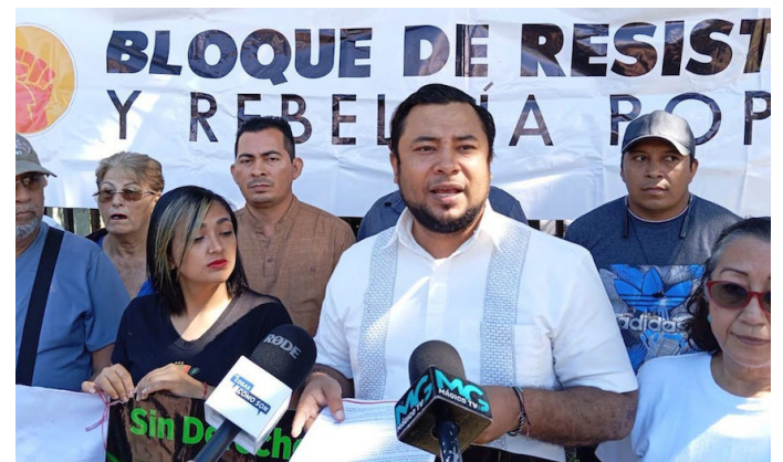
El BRP presentará un proyecto de presupuesto alternativo y adecuado a los intereses de las grandes mayorías del país.

Asimismo, que el presupuesto de Educación aumente en $180 millones, de $1,570 millones a $1,750 millones, de esta cantidad $40 millones serán para remuneraciones, se cumplirá con la ley del escalafón, incluyendo los recursos adeudados por el retraso de dos