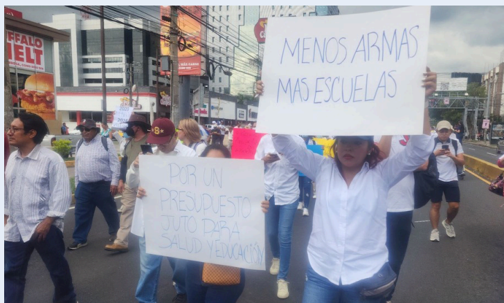
Organizaciones califican de injusto y arbitrario los despidos de maestros que participaron en la marcha del 19 de octubre, donde pidieron dignificar las condiciones laborales del magisterio.

Este despido es una muestra de la violencia ejercida hacia las mujeres por parte del gobierno, quien vulnera el derecho al trabajo, la libre expresión y castiga con despidos a mujeres valientes como