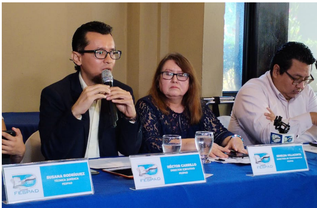
El Sistema de Monitoreo de Libertades Cívicas (SMLC), presenta su segundo informe en el cual , sistematiza y denuncia las condiciones que afectan al espacio cívico, que suma entre enero a agosto 73 vulneraciones a derechos humanos.

“Quizás este mecanismo que proponemos no logre temas trascendentales como debería, porque hay muchos temas de país en los que tenemos que ponernos de acuerdo. Porque todos queremos un país con altos niveles de educación, mejores salarios y un sistema de pensión digna, esos son los temas importantes”, agregó Carrillo.