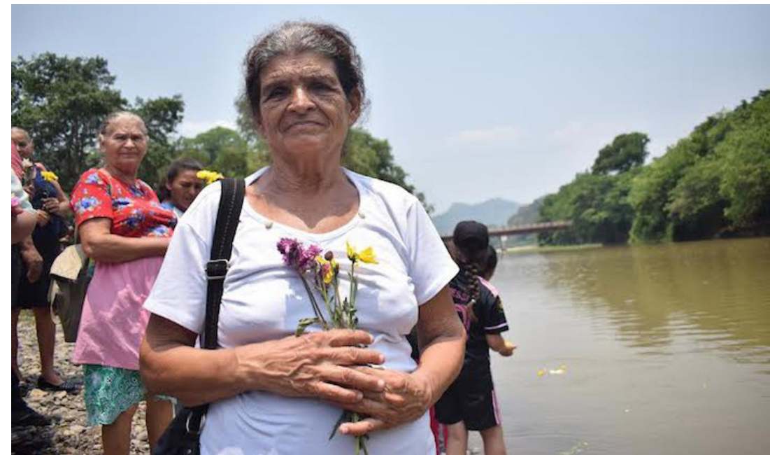
Comunidades aledañas al río Sumpul conmemoran la memoria de miles de salvadoreños que perdieron la vida durante la Guinda de Mayo.