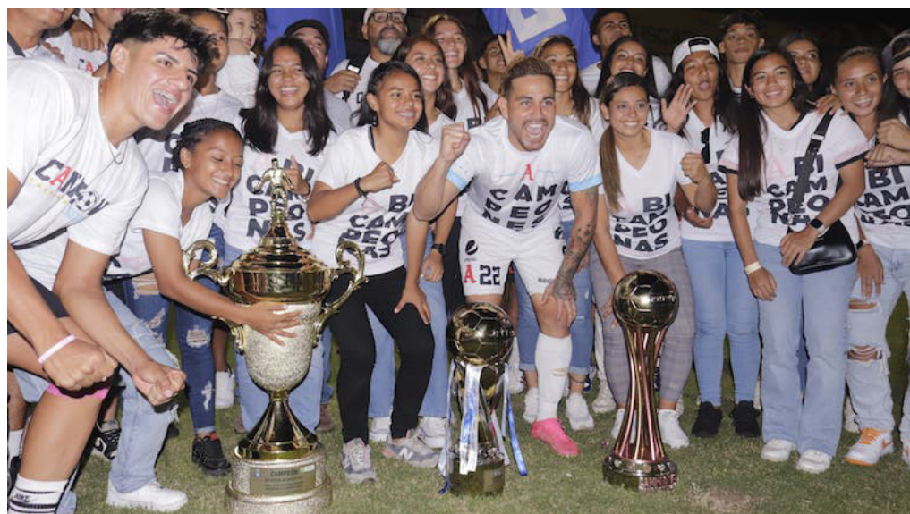
La reserva, la femenina y el equipo mayor de Alianza celebran el triplete del Clausura 2024.