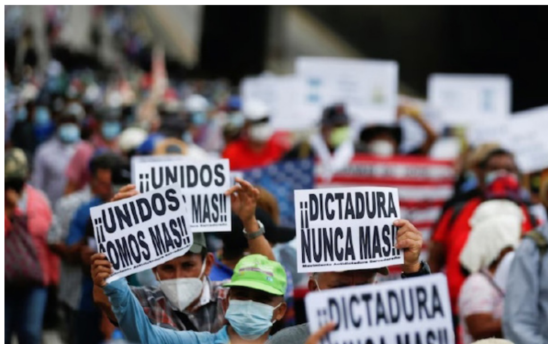
El Consejo de Derechos Humanos, realizará una evaluación sobre los derechos de la población salvadoreña desde el EPU, que verifica las libertades fundamentales de las personas, sin distinción de ningún tipo de manera justa y equitativa.