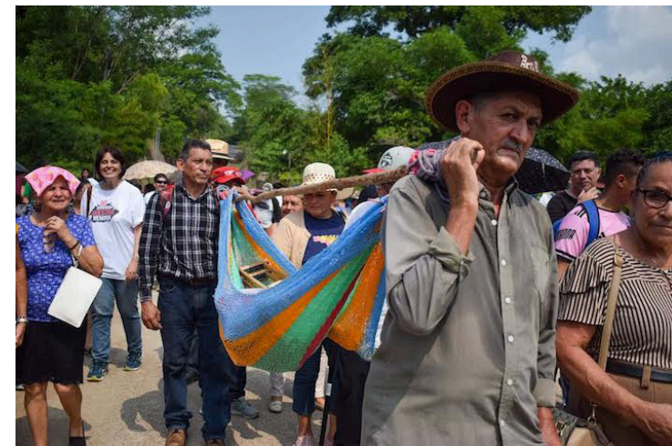
Pro Búsqueda reúne cada año a más un centenar de personas para honrar la memoria de las víctimas de la Guinda de Mayo.