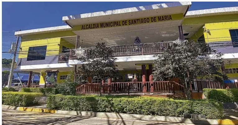
Denuncian situación de impagos a trabajadores municipales en los distritos de Santiago de María, y Berlín, que ahora se conoce como Usulután Norte, situación heredada de gobiernos de Nuevas Ideas.

“El problema radica en que ya pasó mucho tiempo, y muchos compañeros que sobreviven con ese salario y sus familias, que no