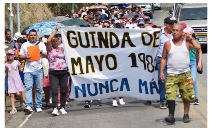
Comunidades participan en la caminata de la “Guinda de Mayo”, para recordar a las víctimas inocentes.

bles; la justicia que esa necesariamente llevar ante los Tribunales a los responsables de estas barbaries y la reparación, ya que sus proyectos de vida fueron truncados y claro un cuarto derecho, inherente a ellos, que es la no repetición”, concluyó Escalante.