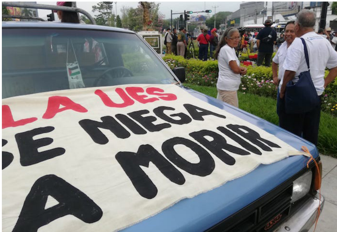
El anteproyecto de dicha ley contiene disposiciones que ponen en riesgo la autonomía de la UES.