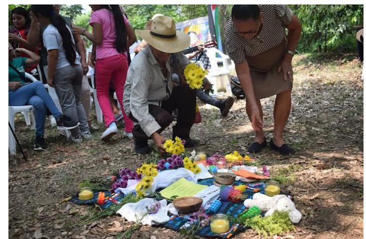
Durante el evento, se enflora de manera simbólica a las personas que murieron tras intentar cruzar el río Sumpul durante la “Operación Limpieza”.