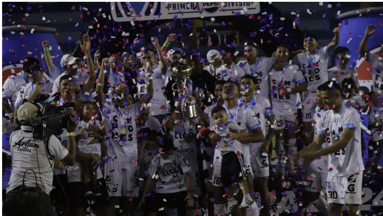
Alianza alza el título del Clausura 2024 en el estadio Cuscatlán.

En su camino a la gloria Alianza finalizó como líder absoluto en la fase regular del torneo con 45 unidades, En los cuartos de final el equipo despachó a 11 Deportivo, en la semifinales fue protagonista al vencer al FAS, de uno de las series más candentes del torneo y en la última instancia venció a Limeño en el Cuscatlán.