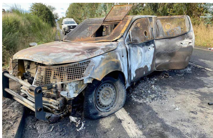
Santiago de Chile/Prensa Latina

Un gran hermetismo prima hoy en las investigaciones sobre el asesinato de tres miembros del Cuerpo de Carabineros en el sur de