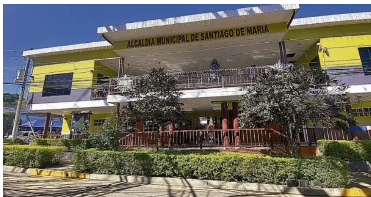
Denuncian situación de impagos a trabajadores municipales en los distritos de Santiago de María, y Berlín, que ahora se conoce como Usulután Norte, situación heredada de gobiernos de Nuevas Ideas.

“El problema radica en que ya pasó mucho tiempo, y muchos compañeros que sobreviven con ese salario y sus familias, que no