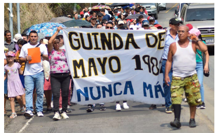
Comunidades participan en la caminata de la “Guinda de Mayo”, para recordar a las víctimas inocentes.

bles; la justicia que esa necesariamente llevar ante los Tribunales a los responsables de estas barbaries y la reparación, ya que sus proyectos de vida fueron truncados y claro un cuarto derecho, inherente a ellos, que es la no repetición”, concluyó Escalante.