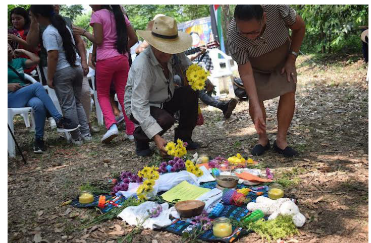
Durante el evento, se enflora de manera simbólica a las personas que murieron tras intentar cruzar el río Sumpul durante la “Operación Limpieza”.