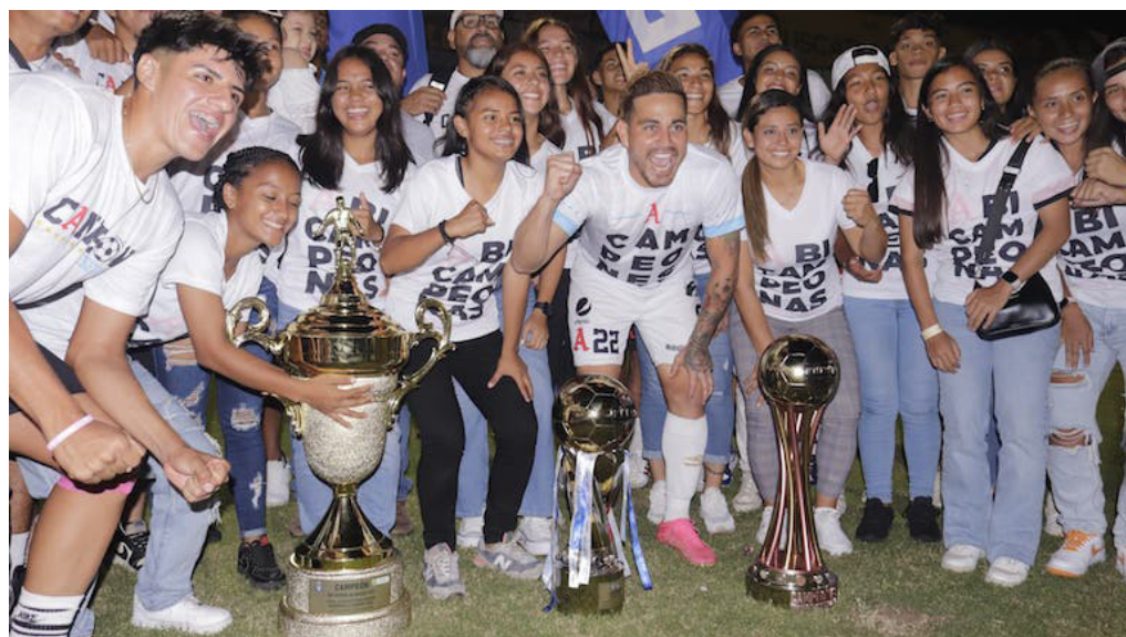
La reserva, la femenina y el equipo mayor de Alianza celebran el triplete del Clausura 2024.