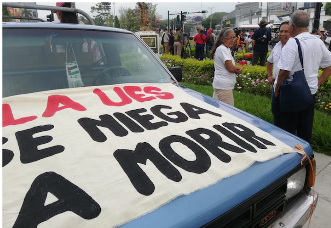
El anteproyecto de dicha ley contiene disposiciones que ponen en riesgo la autonomía de la UES.