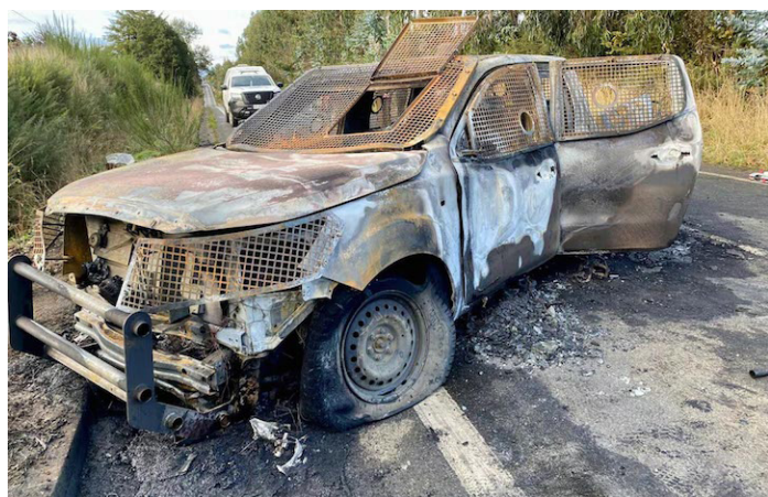
Santiago de Chile/Prensa Latina

Un gran hermetismo prima hoy en las investigaciones sobre el asesinato de tres miembros del Cuerpo de Carabineros en el sur de