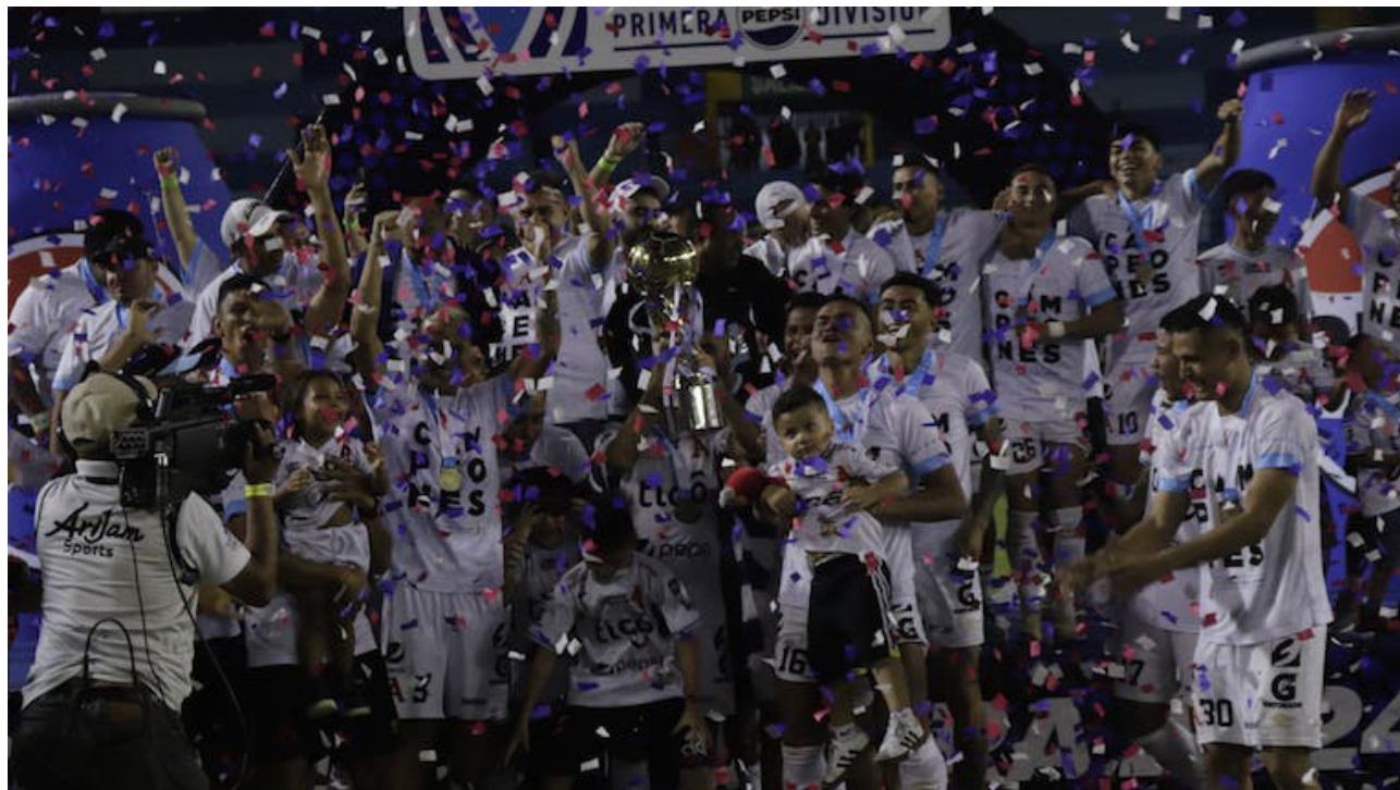
Alianza alza el título del Clausura 2024 en el estadio Cuscatlán.

En su camino a la gloria Alianza finalizó como líder absoluto en la fase regular del torneo con 45 unidades, En los cuartos de final el equipo despachó a 11 Deportivo, en la semifinales fue protagonista al vencer al FAS, de uno de las series más candentes del torneo y en la última instancia venció a Limeño en el Cuscatlán.