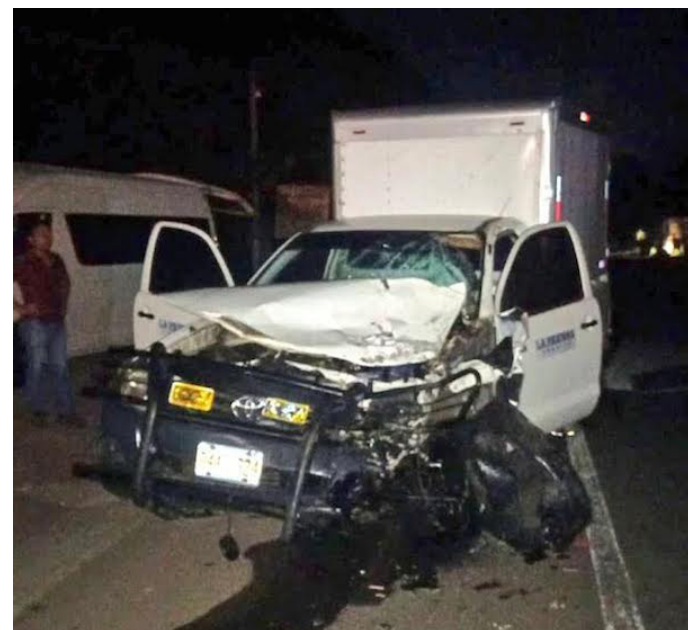
Dos personas a bordo de una motocicleta murieron al impactar contra un vehículo en el kilómetro 62 de la carretera que de Sonsonate conduce hacia San Salvador.

Entre las principales causas de siniestros viales está, la distracción del conductor, la inva-