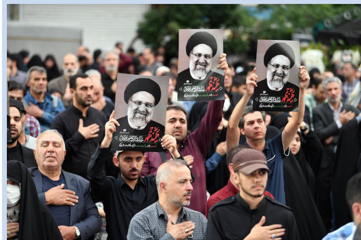
Personas se lamentan por las víctimas del accidente de helicóptero cerca del distrito de Varzaqan, en Teherán, Irán, el 20 de mayo de 2024 donde murió el presidente iraní, Ebrahim Raisi y otros miembros de equipo que lo acompañaban.