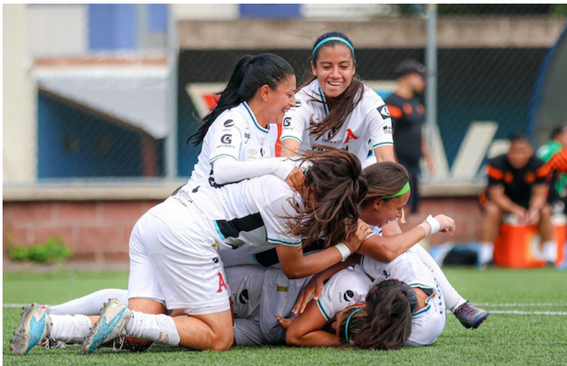
Alianza Women, vigentes campeonas de la Liga Femenina, se enfrentarán contra Isidro Metapán en la final de la Liga Femenina.

En retrospectiva, el cuadro capitalino finalizó las fases regular del torneo