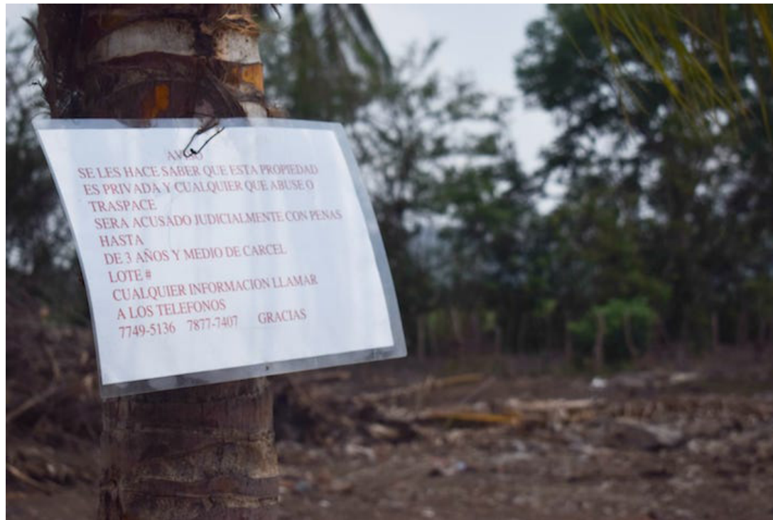
Las familias pagaban por los terrenos, les daban recibos, un traspaso y pagaban por la escriturización, al final les quitaron todo y les dijeron que era propiedad privada.

cia del desalojo del territorio que ocupan en la zona.