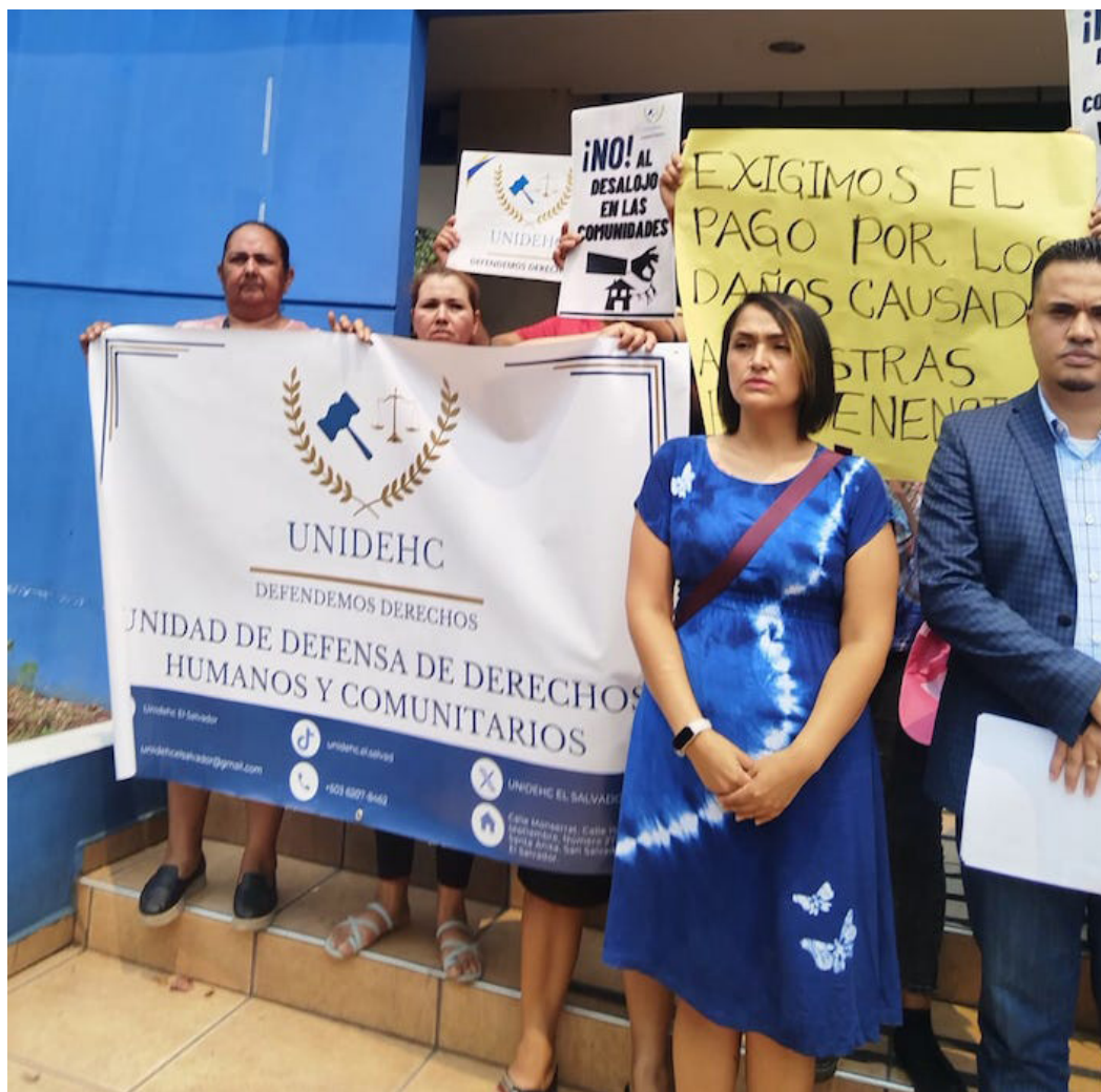
Comerciantes de la Costa del Sol piden a la PDDH que haga valer sus derechos tras los desalojos y quema de sus negocios.

“Hemos venido a activar los mecanismos de derechos humanos que todo ciudadano tie-