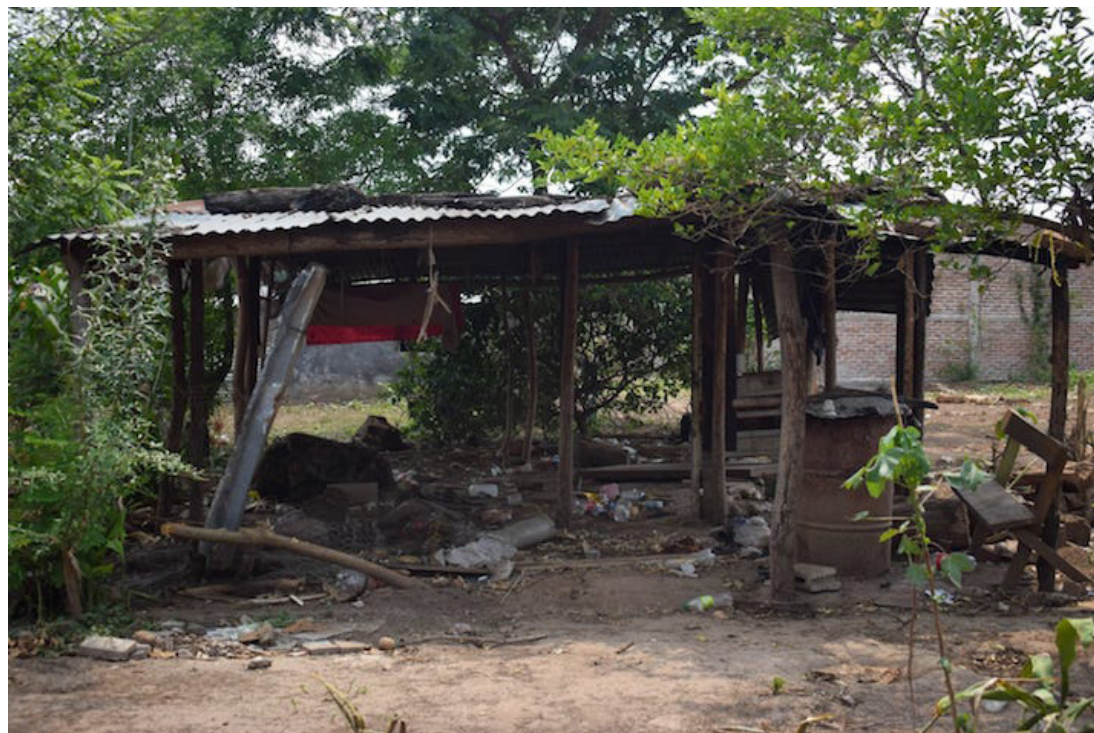
Casas donde vivían personas adultas mayores, niños y personas con discapacidad son destruidas por trabajadores de los “nuevos propietarios” de la Hacienda La Floresta.

Los testimonios de los habitantes de la Hacienda La Floresta, son los mismos. Llegaron hace 15 u 8 años,