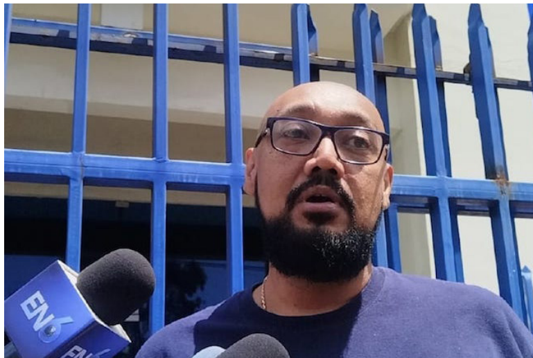
Ahorrantes de COSAVI interpusieron ante la FGR una denuncia por el delito de apropiación ilícita de bienes, con el objetivo que agilicen la devolución de los fondos.

Asimismo, indicó que hay aproximadamente 400 denuncias interpuestas en la FGR y aún falta personas, el objetivo no es buscar culpables o descifrar por qué lo hicieron, sino pedir un meca-