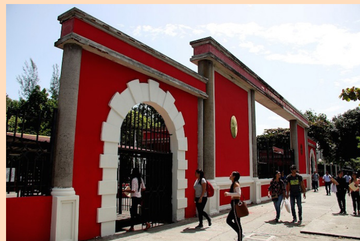
Colectivos y asociaciones de la UES denuncian que el gobierno impulsa una campaña de difamación, desfinanciamiento y control político.

lecer”, reza el comunicado. De acuerdo al anteproyecto de Ley de Educación Superior la asignación de fondos para la UES será acorde a las disponibilidades de los recursos estatales, se consignará anualmente en el Presupuesto General del Estado las par-