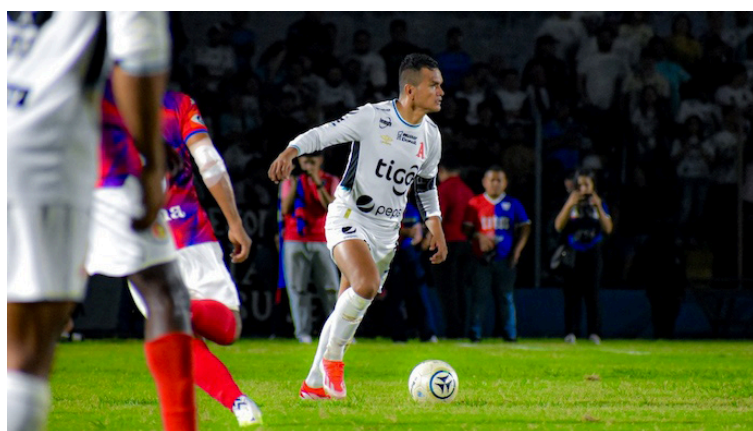
Alianza y FAS empatan 1-1 en el estadio Óscar Quiteño en Santa Ana, partido de ida de las semifinales del Clausura 2024.

Municipal limeño se convirtió la noche del sábado en el primer equipo en confirmarse en la gran final del torneo, luego de que eliminó a Isidro Metapán con global de 2 a 1, en el partido de vuelta, en el estadio Ramón Flores Berrios, lugar donde el equipo local cayó pero por el resultado que consiguió de 2 a 0 en el "Calero" Suárez, en el primer encuentro, el global le sirvió para decir presente en la siguiente y