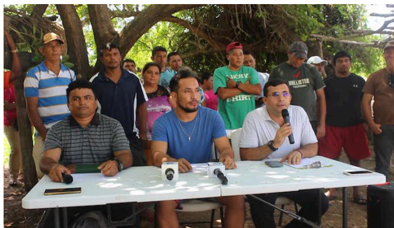
Habitantes de la Comunidad de El Icacal organizados en MILPA El Salvador denuncian la usurpación de tierras y depredación del manglar por la construcción del Circuito Turístico Surf City 2.

Los habitantes de la Comunidad de la Playa El Icacal organizados en el Movimiento Indígena para la Integración de las Luchas de los Pueblos Ancestrales de El Salvador/MILPA, denunciaron la usurpación de tierras y depredación del manglar en la zona debido a la construcción del Circuito Turístico Surf City 2.