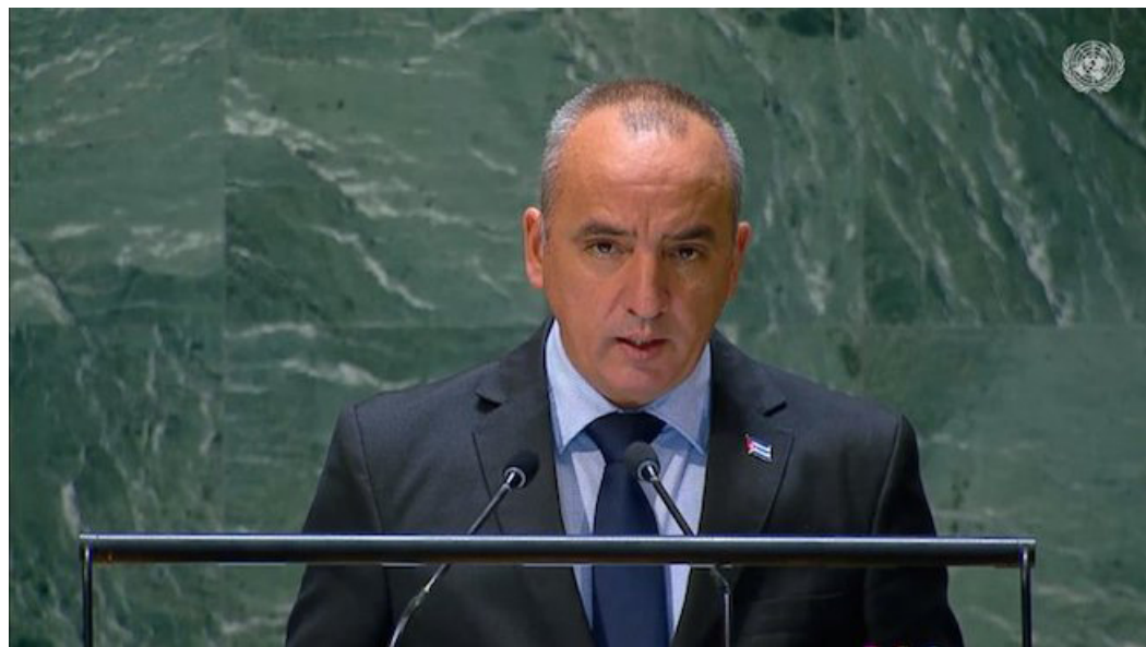
Naciones Unidas/Prensa Latina

El representante permanente de Cuba en la ONU, Ernesto Soberón, consideró este lunes la admisión de Palestina en Naciones Unidas como un paso imprescindible para una solu-