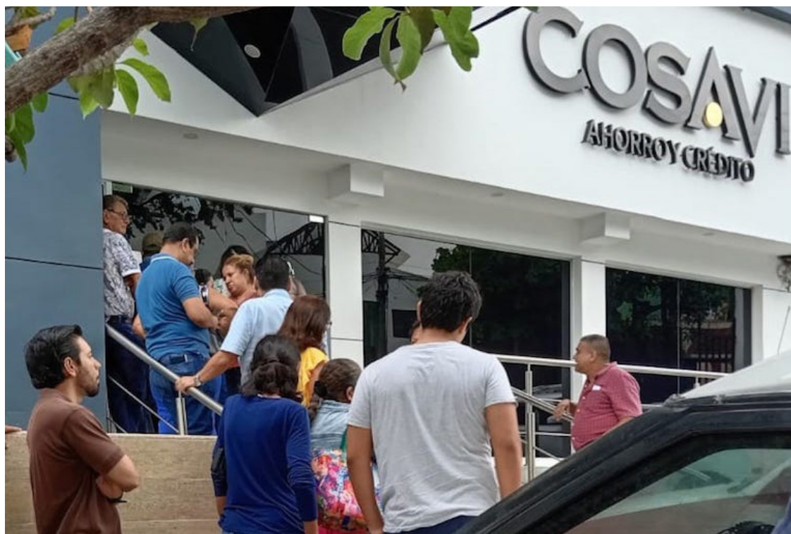
Ahorrantes de COSAVI, en su mayoría adultos mayores, llegaron a una de las 9 agencias para recuperar sus ahorros personales.

Al explicar que cualquier ciudadano salvadoreño que saldrá del país, por cualquier punto migratorio y lleva en