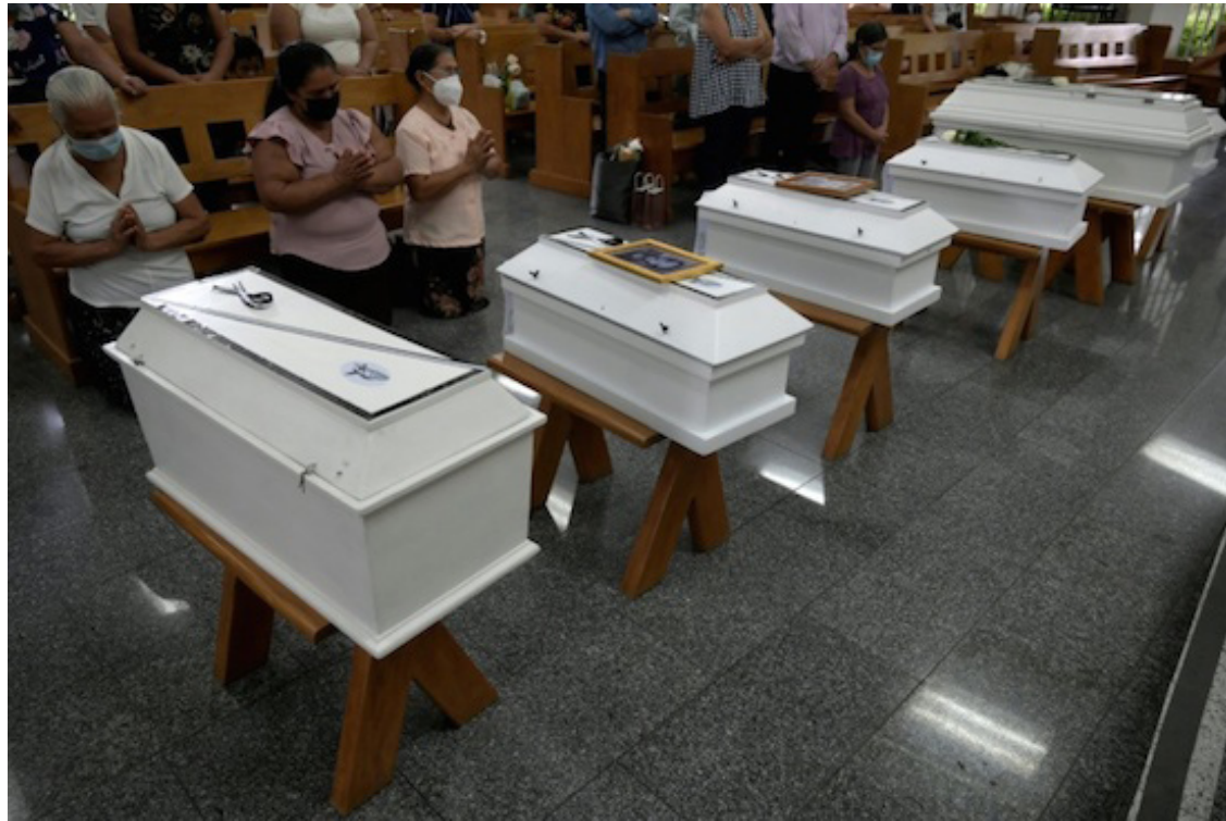
La Masacre del río Sumpul, ocurrida al principio del conflicto armado, provocó un éxodo de la población civil proveniente de los municipios San José Las Flores, Las Vueltas y Ojos de Agua, en el departamento de Chalatenango, que huían del ejército salvadoreño, en el año 2022 entregaron a sus familias seis cuerpos encontrados.