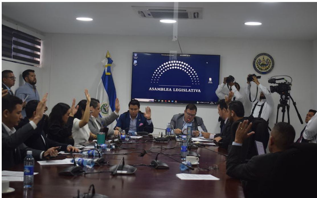
La Asamblea Legislativa conforma las primeras cuatro comisiones del período 2024-2027.

También, se presentó la iniciativa de exoneración de impuestos a la importación de una aeronave para atención prehospitalaria. “La aeronave se utilizará para brindar atención prehospitalaria y de emergencia. Esto viene a robustecer las políticas de salud que impulsa el Gobier-