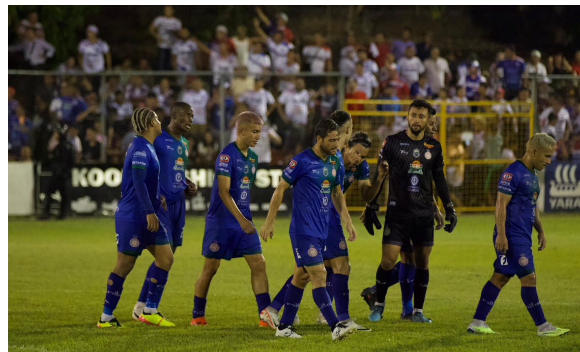
Isidro Metapán elimina a Firpo en los cuartos de final del Clausura 2024 y se verá con Municipal Limeño en las semifinales.

Entre los cuatro equipos más destacados está el líder indiscutible la fase regular; Alianza, contra el quinto, FAS, uno de los recientes campeones del deporte rey del país, y en la otra llave, el séptimo de la tabla, que enfrentará al tercero; Limeño.