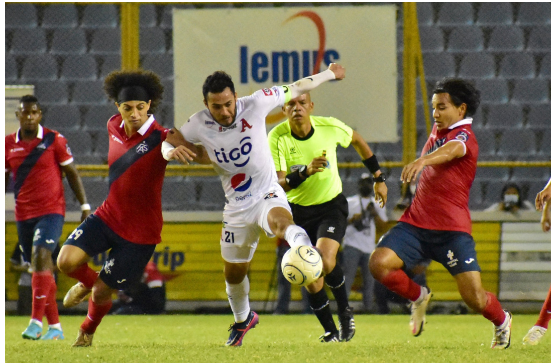
Alianza y CD FAS se encontrarán una vez más en las semifinales del fútbol salvadoreño, en busca del anhelado boleto a la gran final.

Isidro Metapán se convirtió en una de las sorpresas de los cuartos de final al derrotar y eliminar posteriormente al segundo club más regular de la primera fase el torneo Clausura, primero con el partido en el "Calero" Suárez donde los jaguares