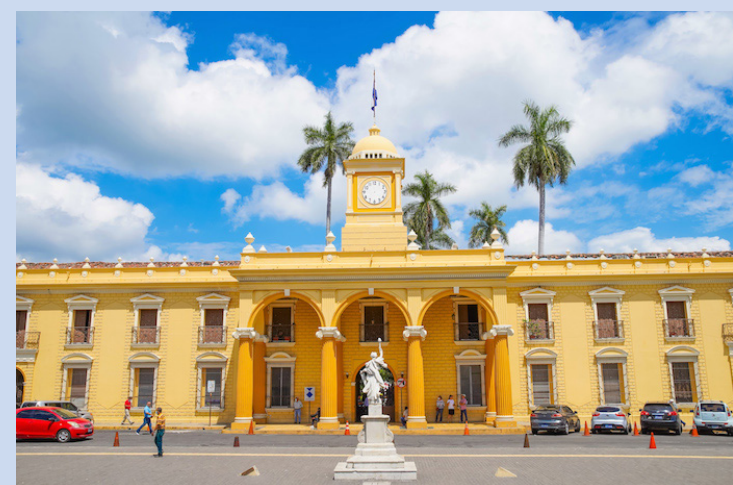
21.7 millones de dólares es la cifra que adeudan de las municipalidades a la Asociación Cooperativa de Ahorro y Crédito Santa Victoria, de R.L. (COSAVI, de R.L.).

El caso COSAVI ha hecho revivir los desfaldos en Finsepro e Insepro, ocurridos en 1997, que dejó a 1400 personas afectadas.