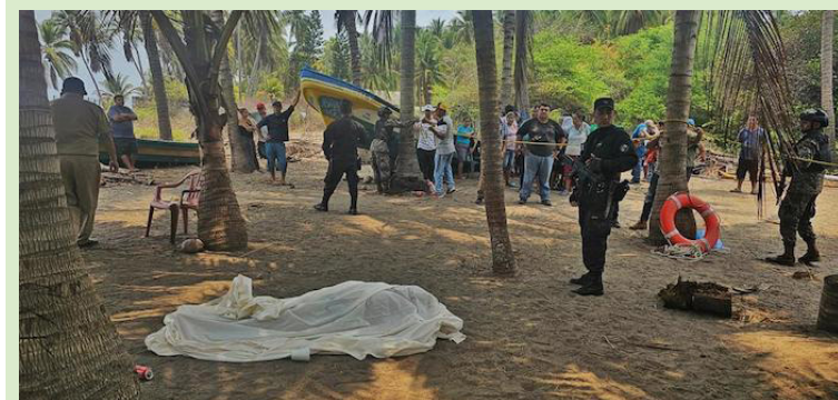
La Policía Nacional Civil (PNC) recupera el cuerpo de uno de los tres ahogados en la playa El Majague, en Usulután.