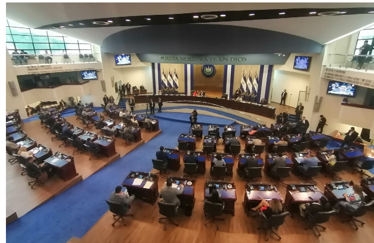
Las comisiones de la Asamblea Legislativa volverán a sesionar este lunes tras ser convocadas por el presidente Castro a través de las redes sociales.