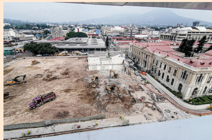
Maquinaria gubernamental trabaja en lugar aledaño al Palacio Nacional y la Biblioteca Nacional.

La decisión de los parlamentarios de aquel momento para proteger los tres perímetros del Cen-