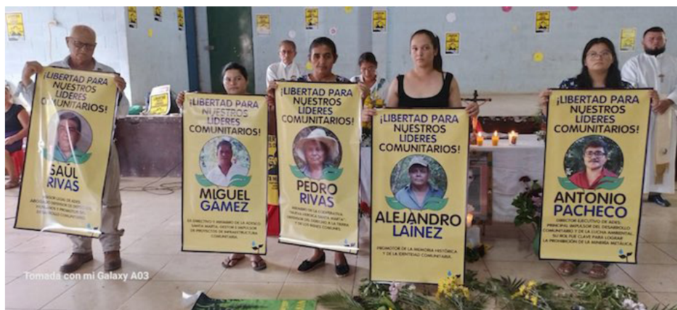
Desde el 11 de enero de 2023, líderes comunitarios de Santa Marta se encuentran privados de libertad por un supuesto homicidio ocurrido durante el conflicto armado de El Salvador.

“Como es de sobra conocido, la acusación de la Fiscalía General de la República contra nuestros compañeros carece de pruebas y solo se explica desde el intento de manipular al sistema judicial para criminalizar el activismo ambiental. Y detrás de tan perversa manipulación de la justicia están las intenciones de reactivar la minería metálica, a pesar de estar prohibida por ley”, dijo la comuni-