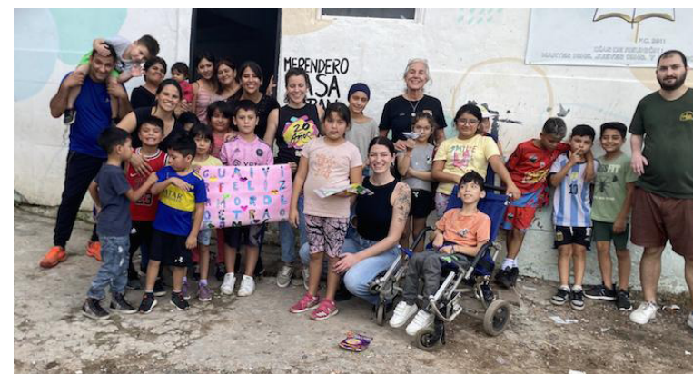
Los proyectos realizados, como la creación de juguetes o elementos didácticos, son luego donados a instituciones o personas que los requieran.