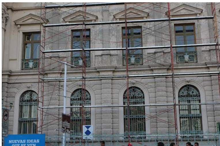
El Palacio Nacional ha sido testigo de muchos cambios en la ciudad, imagen captada en 2018.