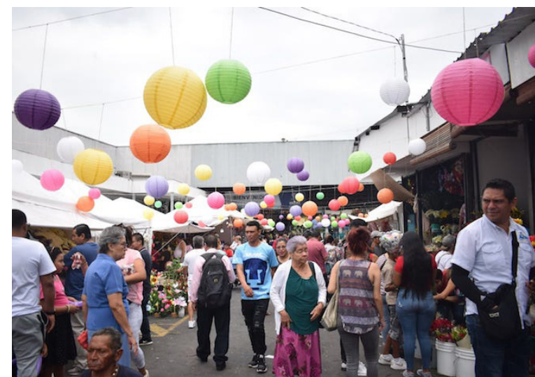
Salvadoreños compran obsequios para regalarles a sus madres en el Mercado Central de Santa Tecla.

Asimismo, los hermanos Granados mencionaron que su madre murió a los 86 años, sin embargo, fue una partida “muy dulce”. “Me dijo, “sálganse que voy a dormir” (...) a los 86 años nos duró mi viejita, no sufrió, pero ya está en un mejor lugar”, concluyeron.