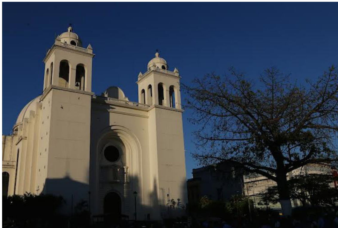
Catedral Metropolitana, en 2017 sin el mosaico del artista Fernando Llorc.

En ese sentido, el país cuenta y en particular el centro histórico de San Salvador, con normativas de protección como: la Ley Especial de Protección al Patrimonio Cul-