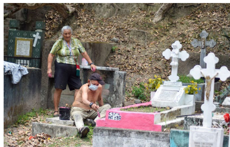
Los hermanos Canales arreglan la tumba de su madre para recordarla en esta fecha muy especial.