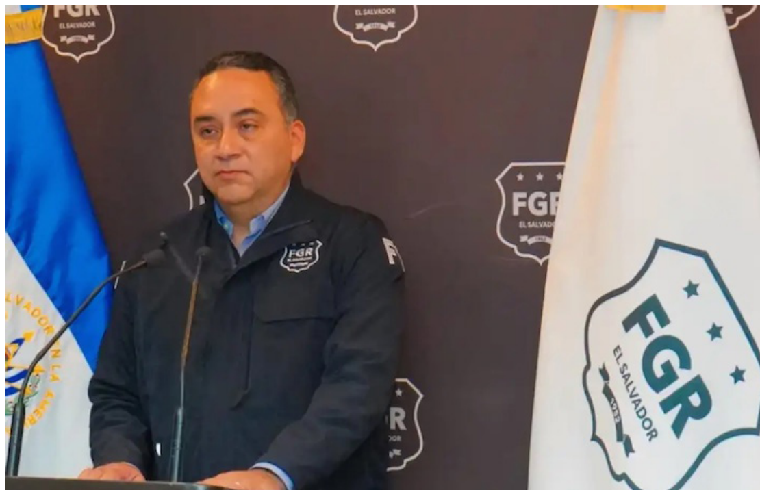
El Fiscal General, Rodolfo Delgado, se limita a decir que a través de diferentes técnicas especiales de investigación, la Fiscalía procesa a 32 personas en el caso COSAVI.

Red Informativa Litoral/Diario Co Latino