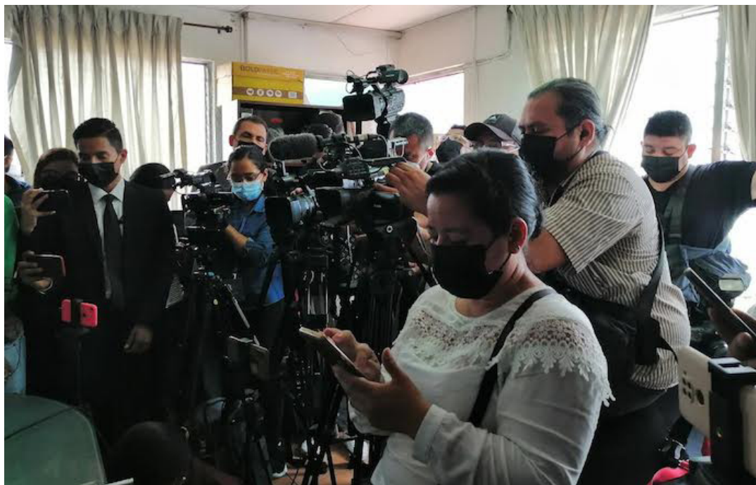
La Relatoría Especial para la Libertad de Expresión de la Comisión Interamericana de Derechos Humanos (CIDH), señala en su Informe sobre Libertad de Expresión y Prensa, que el Estado salvadoreño, debe generar las condiciones para que los y las periodistas puedan ejercer su función de informar de manera libre, independiente y segura.

La Relatoría Especial para la Libertad de Expresión (RELE) de la Comisión Interamericana de Derechos Humanos señaló, en el marco del Día Mundial para la Libertad de Prensa, sobre el “clima hostil para el ejercicio periodístico en El Salvador, en el marco del Régimen de Excepción”.