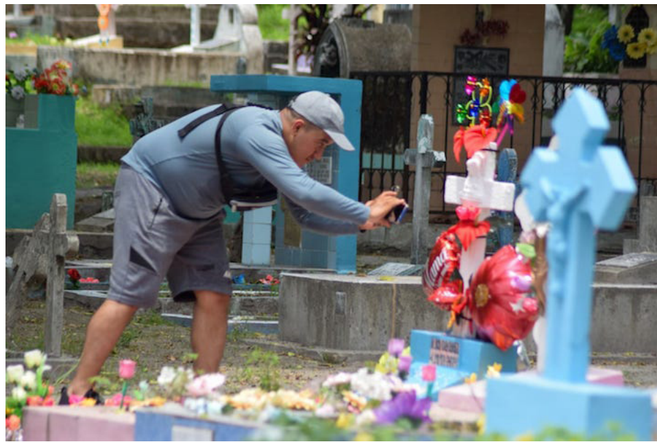
Miles de personas acuden a los campos santos para honrar a sus madres que descansan en el Cementerio Los Ilustres.