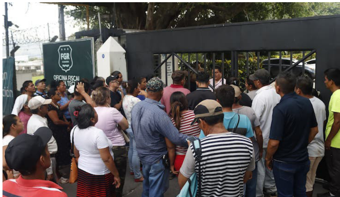
Desalojos de una comunidad en la Hacienda La Floresta, San Juan Opico La Libertad, fue denunciada por sus habitantes ante la Fiscalía General de la República, que afecta, a más de 200 familias con maquinaria que destruyó sus viviendas.

“Si esto les ha pasado y por su propio bien denunciélo ante las autoridades competentes. Porque dicha actividad constituirá un delito de Estafa Agravada, que es un delito penado con hasta 8 años de cárcel”. “Nosotros, lo que les pedimos de favor a la Fiscalía y el Gobierno es que miren la necesidad de no sólo de unas personas, sino de un aproximado de 285 familias, que estamos siendo afectadas en este momento”, puntualizó Cruz.