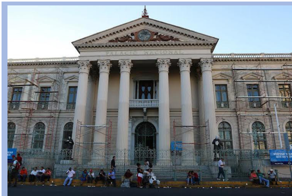
En 2017, el Palacio Nacional fue intervenido por la administración del ahora Presidente de la República. Se despintaron las paredes exteriores.

En los últimos días diversos profesionales, académicos e investigadores han alzado su voz contra lo que consideran el mayor daño que por ahora ha sufrido el Palacio Nacional. Una edificación construida en 1911, y que de acuerdo a algunos, es “la joya más importante de San Salvador”, en lo que respecta a