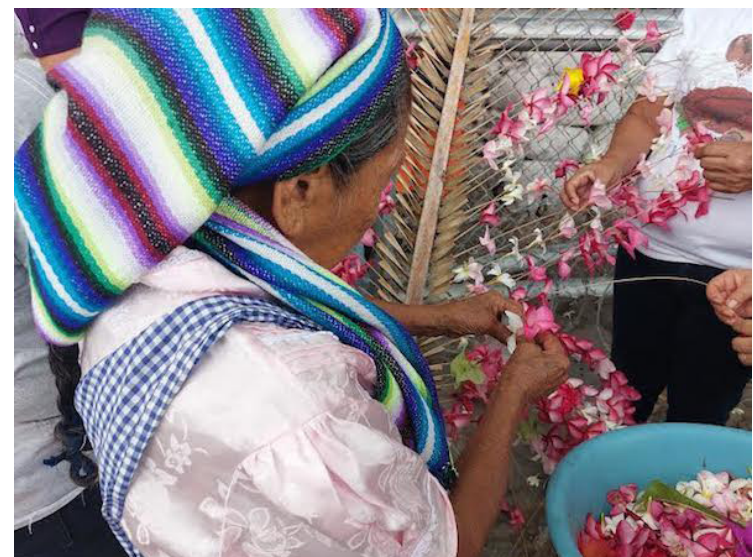
El vínculo indígena que tributa a la “Madre Tierra”, y la veneración de la virgen del Rosario se observan en esta tradición.