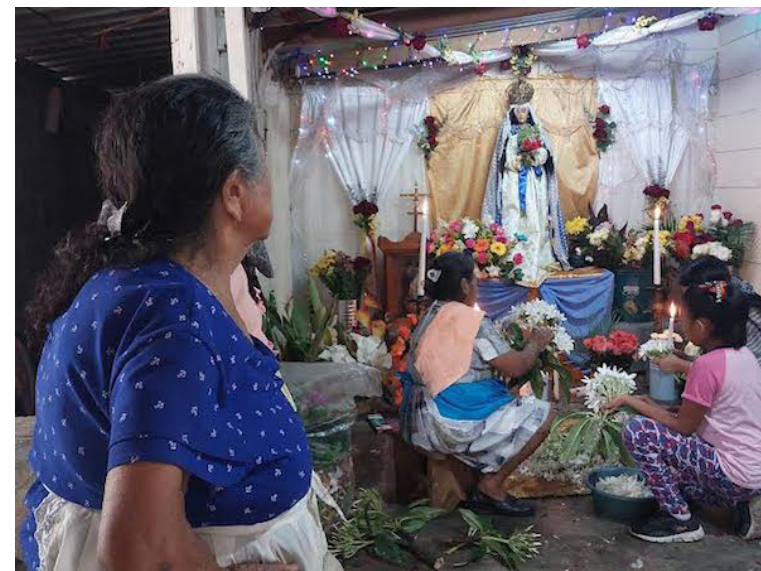
A esta manifestación de fe, de las cuales, se encargan las diferentes cofradías de “Pancho”.

La Cofradía de la Virgen de Concepción se encuentra en el barrio El Calvario, en donde sus habitantes desde hace una semana han venido trabajando en colectivo, con sus familias, para poder “recibir a los visitantes y comensales”, que pueden ser sopas, tamales, chocolate, café y diversas frutas en el marco del Día de la Cruz.