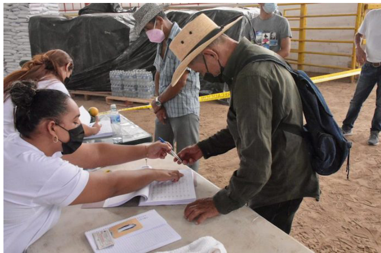
La Mesa por la Soberanía Alimentaria integrada por 20 organizaciones y redes a nivel nacional, desde el año 2013, que tiene como objetivo prioritario alcanzar la soberanía alimentaria en El Salvador.

“La libertad de comprar, que según el MAG tendrán los productores llegará hasta las existencias que tenga el agroservicio en ese momen-