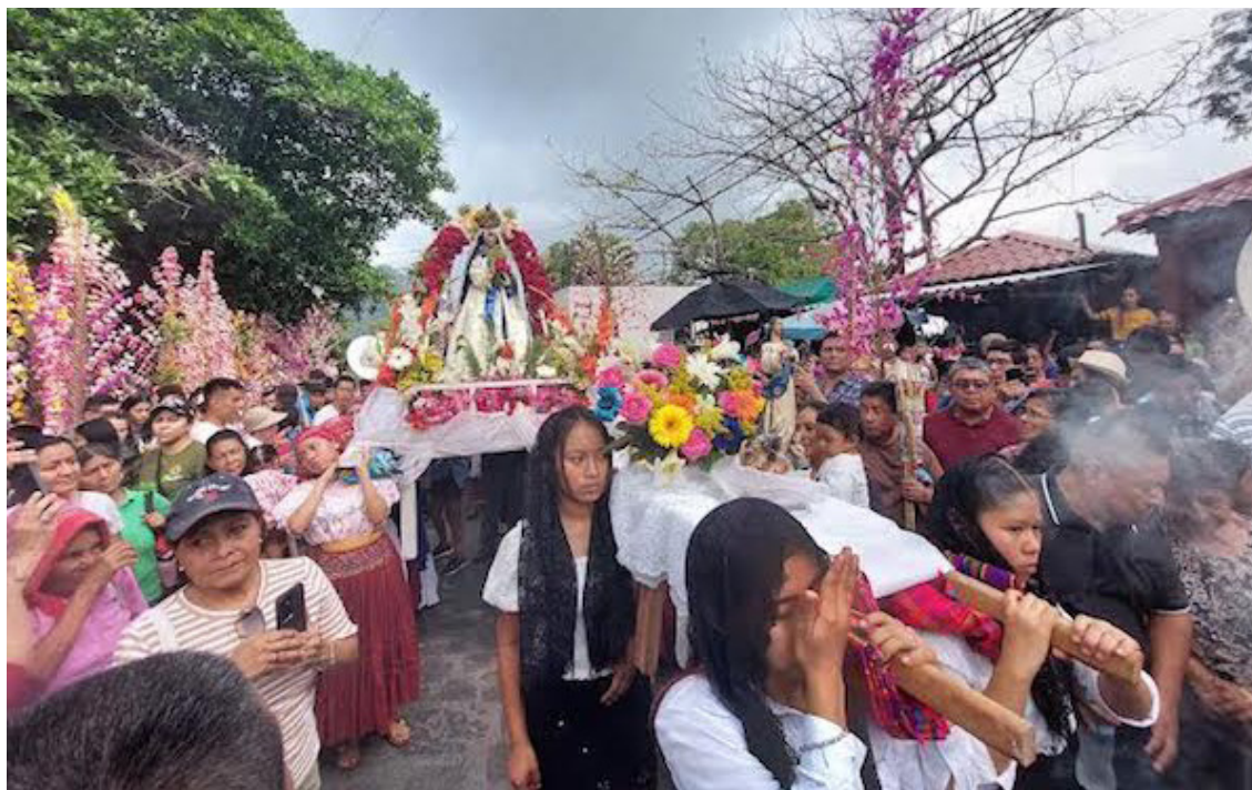
La “Santa Cruz de Mayo” o la “Procesión de Las Flores y Palmas”, es una tradición que buscan preservar en el tiempo.

A esta conmemoración se unen las danzas ancestrales del Jaguar y de los Chapezones, que historiadores han definido como una “sátira