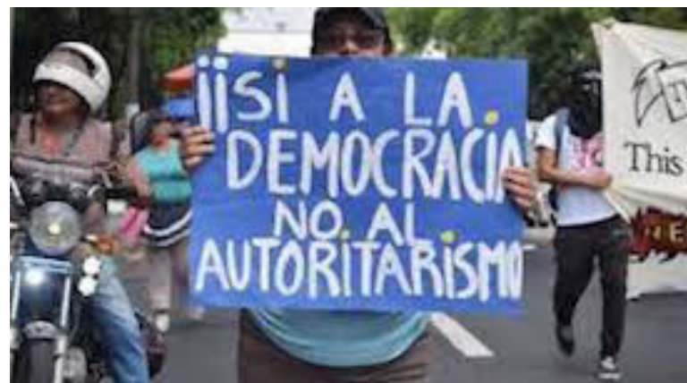
Desde hace tiempo se hablaba de modificar la Carta Magna vigente, la de 1983, con fines u objetivos claros u ocultos, entre estos, permitir la reelección presidencial.

San Salvador/Prensa Latina Luis Beatón Corresponsal jefe en El Salvador