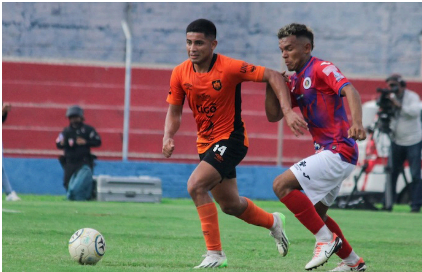
En la serie de  guila-FAS los emplumados tienen una victoria y un empate contra los tigrillos de la fase regular del Clausura. Foto: Diario Co Latino/Cortes a.

El cl sico nacional no solt  la paridad entre los tigrillos de FAS y el cuadro emplumado de  guila, que lleg  al estadio  scar Quite o en busca de la victoria en la  ltima fecha, pero el equipo santaneco no dio lugar para que