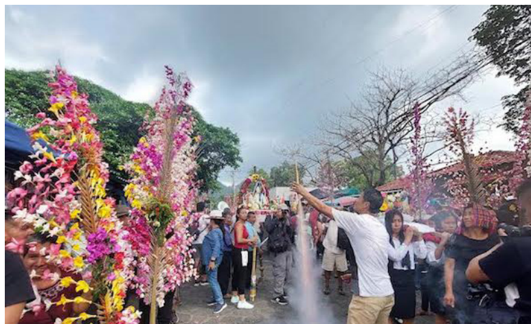
La “Santa Cruz de Mayo” o la “Procesión de Las Flores y Palmas”, es una tradición que buscan preservar en el tiempo y entre la tradición se revientan cuetes de bara.