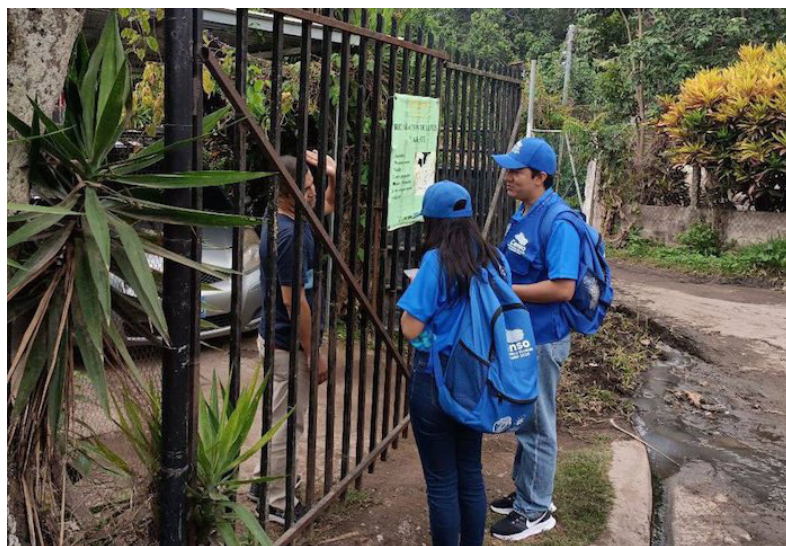
Este 2 de mayo inicia el censo de población y vivienda, para conocer cuántos salvadoreños habitan en el país, saber cómo viven y cuáles son las principales necesidades de la población.

El presidente del Banco Central de Reserva (BCR), Douglas Rodríguez, indicó que este 2 de mayo inició el “Censo de Población y Vivienda El Salvador 2024”, con el objetivo de conocer cuántos salvadoreños habitan en el territorio, también permitirá saber cómo viven y cuáles son las principales necesidades de la población.