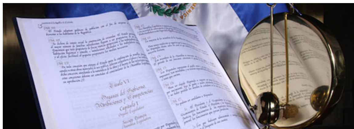
La Constitución de la República es la máxima autoridad del país y modificarla en su totalidad le corresponde únicamente a una Asamblea Constituyente.

"La reciente decisión de la Asamblea Legislativa salvadoreña vulnera uno de los pilares de la democracia: el diálogo ciudadano y profundiza más la