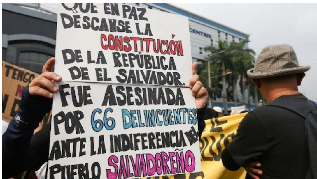
Las organizaciones afirmaron que Centroamérica, el autoritarismo es una "amenaza constante" para algunos de los países y para otros es, de forma lamentable, una realidad.

desigualdad en una región que aún enfrenta profundos problemas de violencia, migración y pobreza", plantearon las organizaciones en su comunicado recibido en esta redacción.