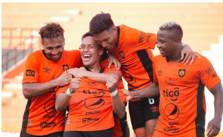
Águila visitará el estadio Óscar Quiteño en la última fecha de la fase regular del torneo Clausura 2024 para enfrentar a FAS.

El escolta de los paquidermos, los toros de Usulután, están al acecho de la primera posición y tratarán de lograr su cometido ante los gallos de Platense, en el estadio Antonio Toledo