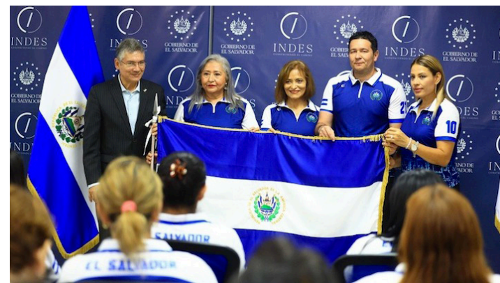
Atletas de maxibaloncesto reciben el pabellón nacional para la May Madness 2024.

La bandera Salvadoreña será representada por dos delegaciones femeninas en la categoría de 40 años + y una en la categoría de 50 años + y en la masculina en la categoría de