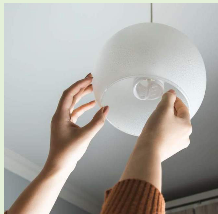
Los consumidores arriba de 300 kW/h tendrán un incremento del 23% en su factura eléctrica, el resto de los usuarios mantendrán su tarifa.

“Los usuarios con categoría Residencial y General que en el