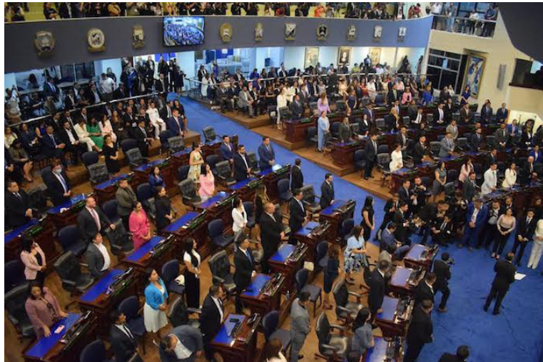
La Asamblea Legislativa volverá a sesionar hasta el 15 de mayo debido a la reestructuración de las comisiones legislativas.

La nueva legislatura volverá a trabajar hasta el 15 de mayo para adaptarse al trabajo de ocho comisiones legislativas permanentes, luego que en la primera plenaria, el 1 de mayo, aprobaron reestructurar y reducir el número de mesas legislativas con el fin de hacer “eficaz” el trabajo legislativo.