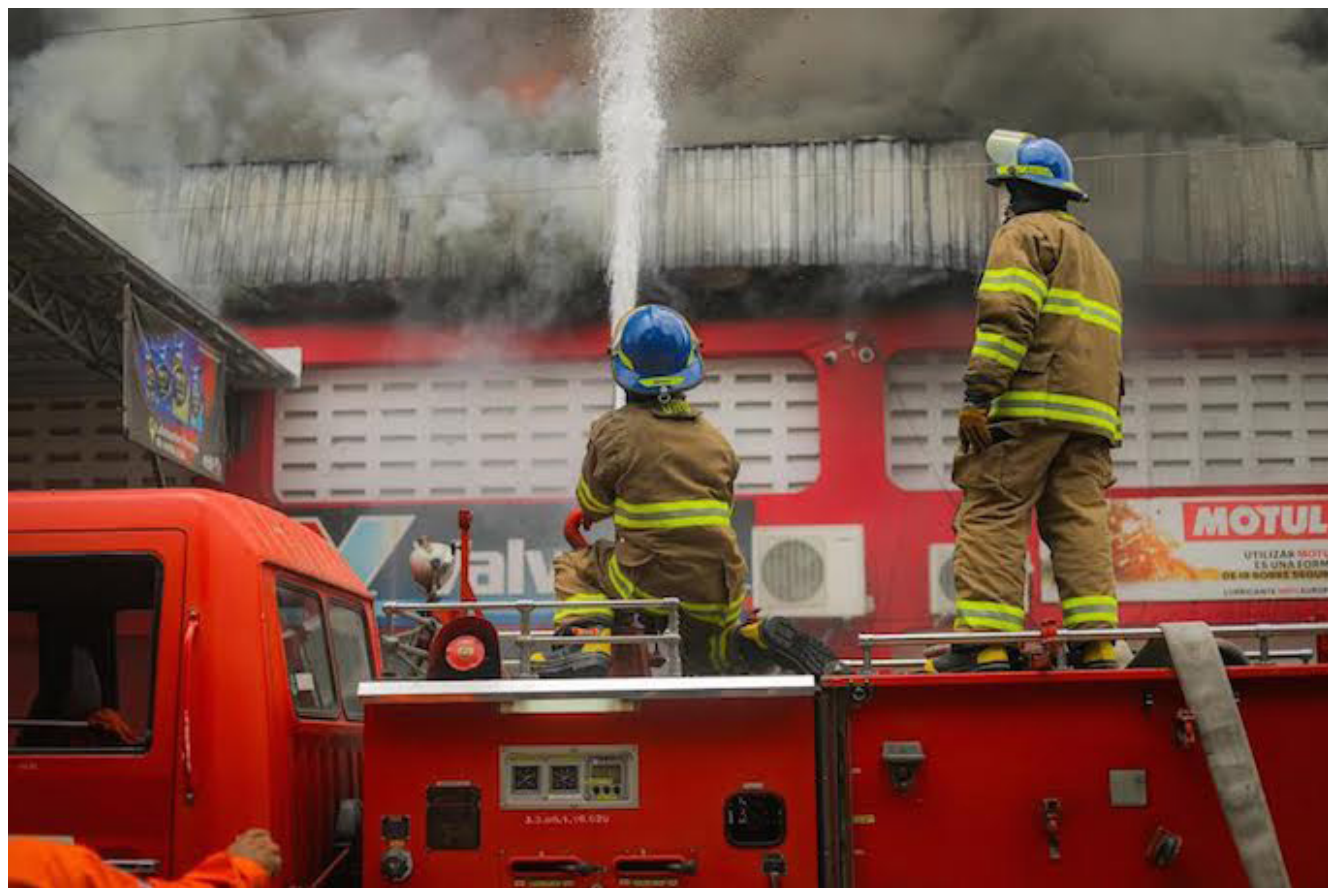
Bomberos atienden incendio en una bodega y venta de repuestos para motocicletas en el sector de la terminal de Occidente.

El Observatorio Nacional de Seguridad Vial da cuenta que desde el 1 de enero hasta el miércoles 1 de mayo de este año, se registraron 6,477 siniestros viales, lo que representó un aumento de 726 casos en comparación con el mismo período en 2023. En cuanto a los lesionados por accidentes de tránsito, se registraron 380 casos más en comparación con 2023. Además, en cuanto a las muertes, se registró un aumento de 33 fallecimientos en comparación con el mismo período del año anterior.