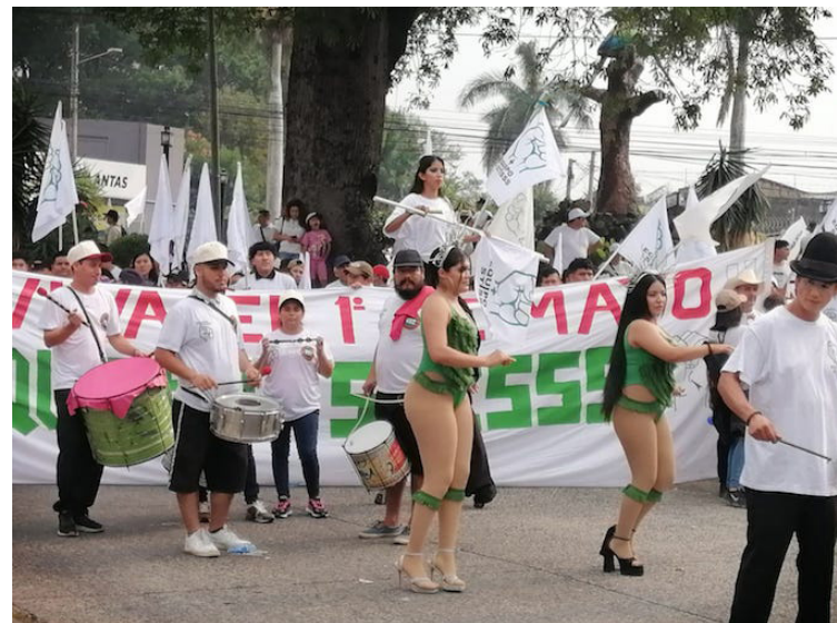
La marcha del 1º de mayo donde debe recordarse la gesta heroica de los mártires de Chicago, esta vez los sindicatos gubernamentales integraron batucada y bailarinas semidesnudas.

Mientras tanto, otras organizaciones sociales recalcaron que durante el combate a los grupos delincuenciales, a través del Régimen de Excepción, miles de personas han sido capturadas arbitrariamente y permanecen detenidas, dejando a sus familias en condiciones de más pobreza, ya que en muchos de los casos eran la única fuente de ingresos en sus hogares.