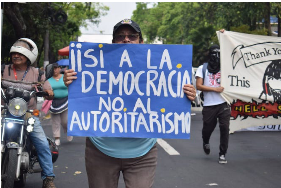
Lo que el actual gobierno busca en realidad es tener un camino ágil y expedito de reforma constitucional, al servicio de él mismo.

realidad, constituye una acción que propicia el más alto nivel de control político del Estado, superior a todas las acciones registradas desde el 2019 con ese mismo propósito.