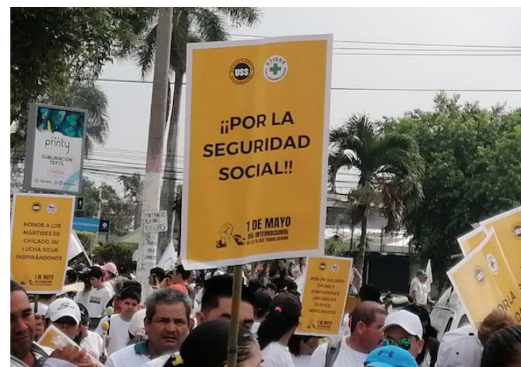
En la marcha del Día Internacional de la Clase Trabajadora, los sindicatos de empleados públicos renovaron el compromiso con la justicia e igualdad para todos los trabajadores.

A la vez, exhortó a unirse a la valiente lucha de aquellos hombres y mujeres cuyos nombres