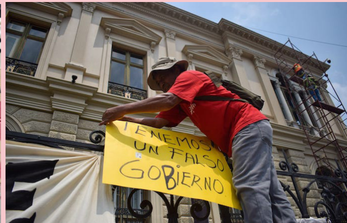
La marcha partió desde la Plaza Divino Salvador del Mundo hacia la Plaza Cívica en el Centro de San Salvador.