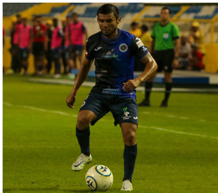
FAS empata contra Alianza en el estadio Cuscatlán y confirma su participación en los cuartos de final del torneo Clausura 2024.

mados de la fecha 20, entre Platense contra Águila, en el estadio Antonio Toledo Valle, se generó un empate por la mínima entre ambos conjuntos, quienes con goles de Ever Caicedo para los locales y Kevin Reyes para el conjunto visitante, repartieron puntos sobre el final del segundo tiempo.