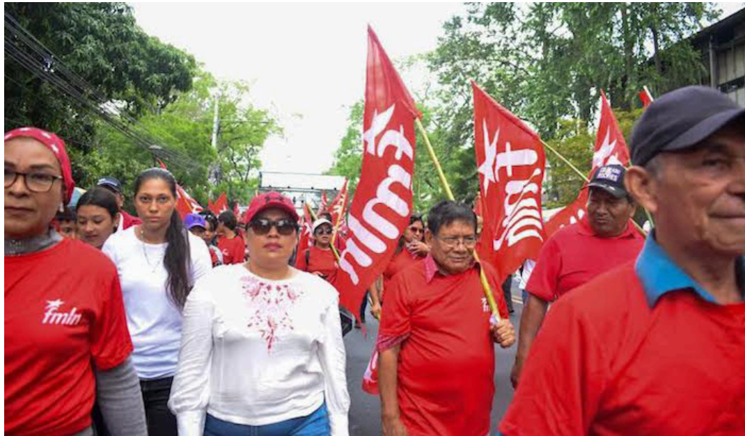
Algunos partidos de oposición se unieron para acompañar a la clase trabajadora, entre estos el FMLN.

Óscar Ortiz, secretario general del Frente Farabundo Martí (FMLN), dijo el “par-