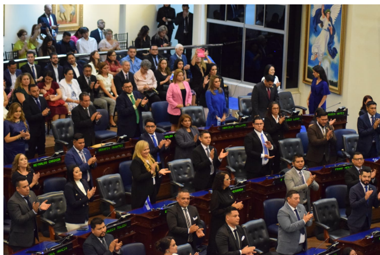
La Asamblea Legislativa aprueba reforma a su reglamento Interno para reestructurar y reducir el número de comisiones legislativas.

comisión de educación, cultura, tecnología y deporte. Comisión de Vivienda y Transporte Público. Comisión de economía y medios de vida. Comisión de seguridad y combate a la narcoactividad y corrupción. Comisión de Salud, medio ambiente y cambio climático. Sin embargo, la propuesta fue rechazada por el oficialismo.