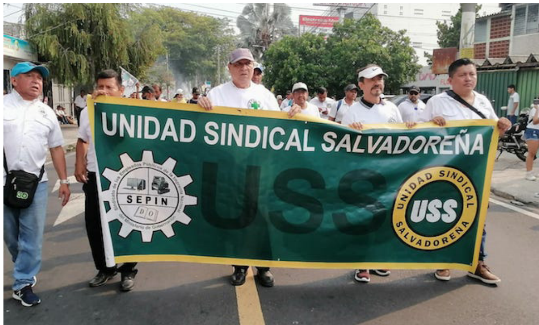
La USS señala que en algunas dependencias del gobierno ha existido la criminalización del movimiento sindical e irrespeto a los contratos colectivos de trabajo.

“Como USS vemos con esperanza este proceso iniciado y confiamos, que estos desafíos serán retomados por el gobierno del presidente Bukele”.