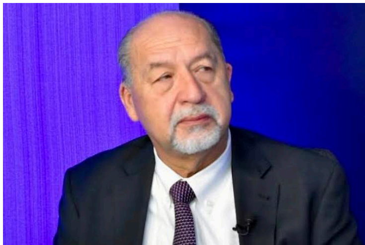
Guillermo Wellman, magistrado del TSE, dice que los datos de la encuesta presentados por la UCA, demuestran que actuaron transparente en las elecciones, pero el 49.4% tiene poca o ninguna confianza en el Tribunal.

Ante los resultados de la encuesta presentados por la UCA, el magistrado del Tribunal Supremo Electoral (TSE), Guillermo Wellman, afirmó que los datos son una apreciación objetiva la cual demuestra que actuaron con transparencia en todo el proceso electoral.