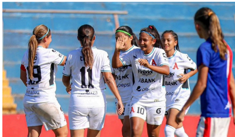
Las vigentes campeonas de la Liga Femenina Alianza se enfrentará a Isidro Metapán por el título del Clausura 2024.

Los dos equipos más destacados del grupo B se han citado este viernes para disputar el partido más importante de todo el campeonato, donde las aliancistas pretenden sumar su octavo título mientras que el club de Santa Ana espera conseguir su primera corona.