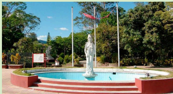
Las asociaciones de la UES señalan que la falta de recursos financieros adecuados pone en riesgo la calidad y accesibilidad de la educación superior pública.

cos para becas es crucial para garantizar el acceso a la educación superior de calidad, para todos los estudiantes, independientemente de su situación económica.