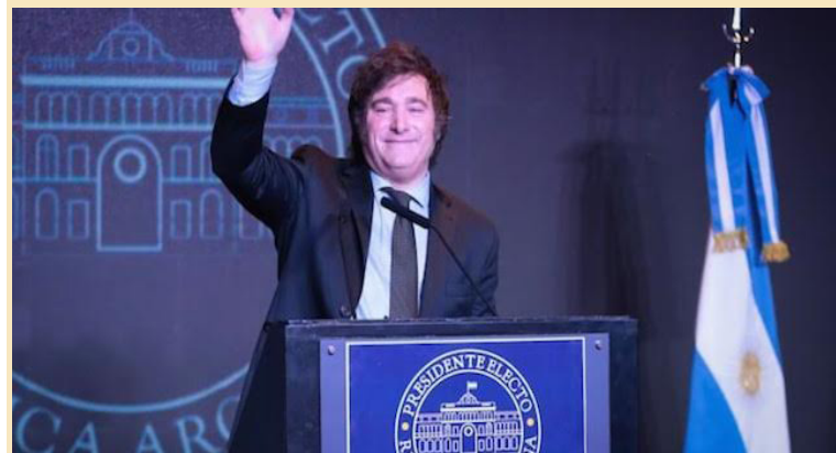
Javier Milei visitará El Salvador para participar en la toma de posesión de Nayib Bukele.

La toma de protesta de Bukele se desarrollará bajo un régimen de excepción, vigente desde el 27 de marzo de 2022. Esta medida estatal ha sido la principal herramienta para desarrollar propaganda en materia de seguridad para el Gobierno, pues, según los datos de las autoridades, se han capturado a más de 80 mil presuntos pandilleros y los homicidios en el país han disminuido considerablemente. También, la percepción de seguridad en los salvadoreños ha mejorado.