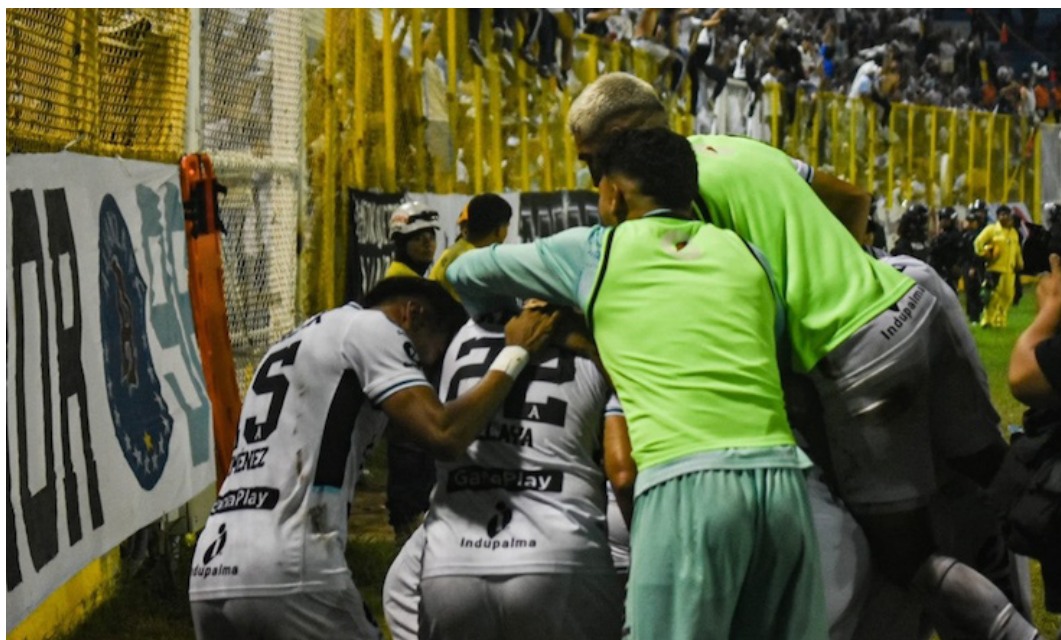
Alianza celebra el 2-1 ante FAS en la semifinal del Clausura 2024.

caso” para el equipo, el mítico entrenador dijo que no lo considera de esa forma, sino “todo tiene que ver donde se encuentran” en este momento y “si es fracaso estar en alguna final que no será para todos los demás equipos”.