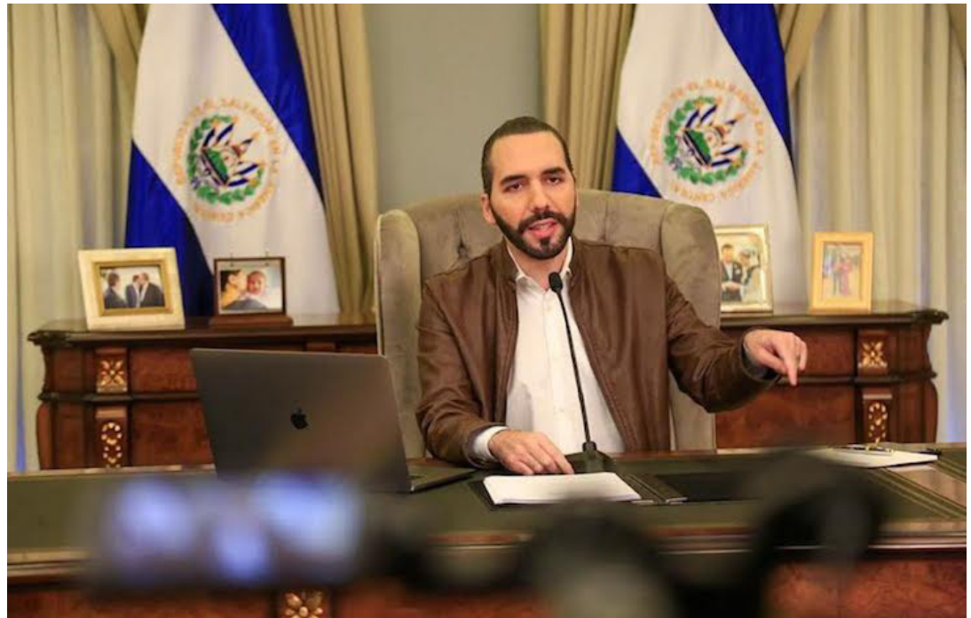
Bukele ejercerá un segundo mandato pese a ser inconstitucional.