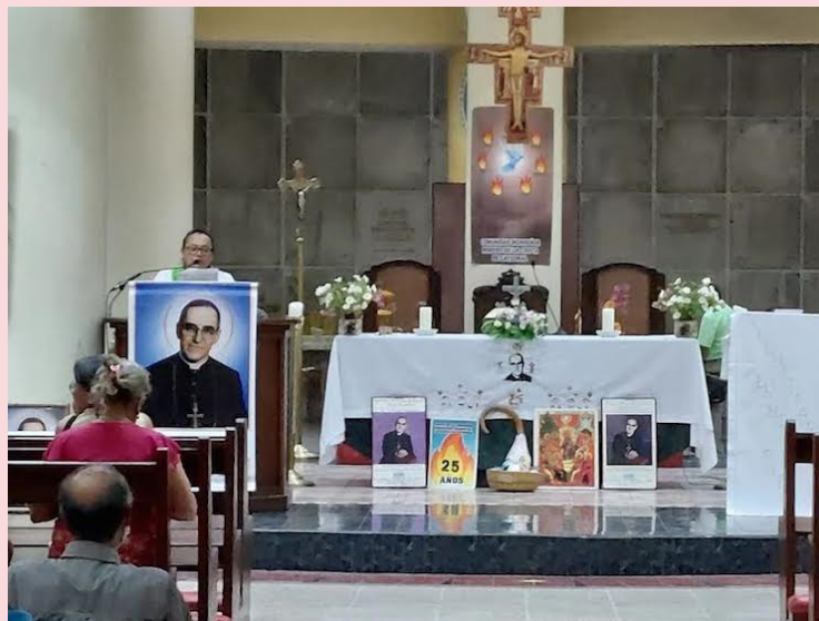
Estos 25 años coinciden con el noveno aniversario de la beatificación de Mons. Oscar Arnulfo Romero.

El pasado fin de semana, en la misa dominical, se recordó a los fundadores de este espacio que hoy en día, resguarda el santuario de Mons. Romero, al cual asisten cientos de personas para agradecerle al primer san-