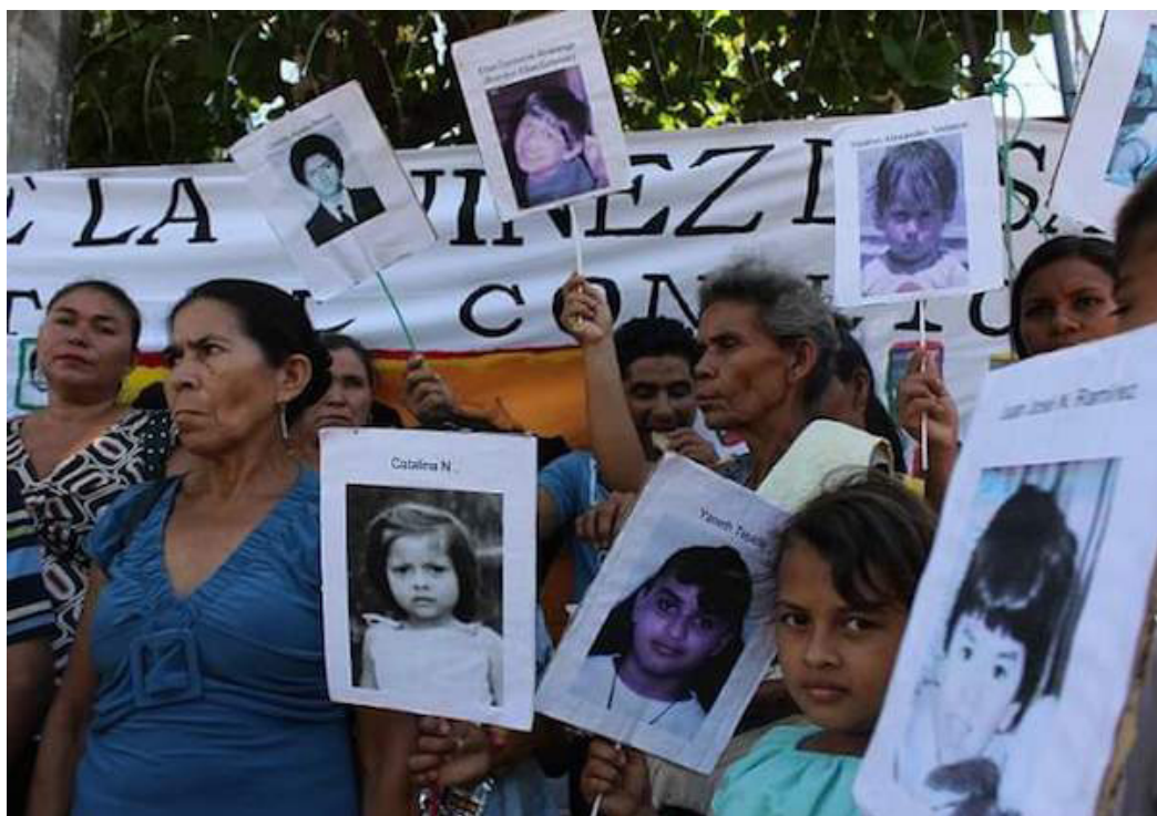
A 42 años de esta masacre, que fue cometida en diferentes puntos de Chalatenango, entre el 28 de mayo al 9 de junio de 1982, los sobrevivientes y familiares recuerdan a las víctimas.

Como el caso de las “Hermanitas Serrano Cruz”, quienes aún continúan en “calidad de desaparecidas” (sentencia de la Corte IDH /2005), al igual que otras niñas y niños que siguen desaparecidas desde la Guinda de Mayo. Y sus familiares aún no han “olvidado las atrocidades” que enfrentaron y, por tanto, seguirán peticionando verdad, justicia y reparación.