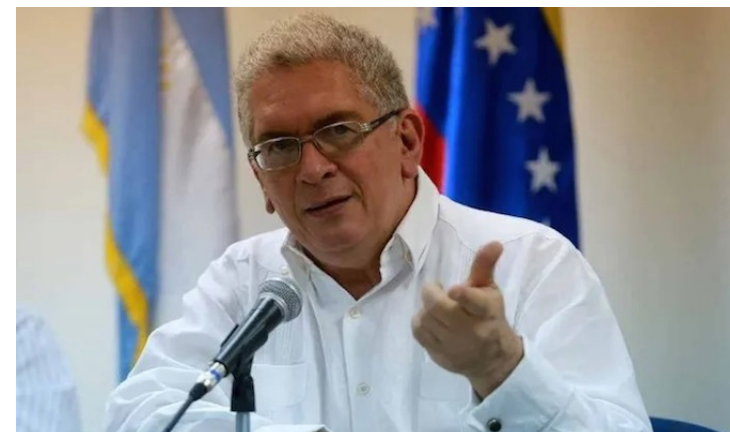
Diputado de la Asamblea Nacional de Venezuela, Roy Daza.

Al tiempo reconoció que las medidas impuestas por el imperio norteamericano, originó un derrumbe de las exportaciones petroleras, “eso significa que de 76 mil millones de dólares anuales por concepto de exportación y de renta petrolera hemos llegado a 4 mil millones, e incluso en algunos momentos a 2 mil millones de dólares, es decir que en Venezuela no se puede hablar de crisis económica, sino de una catástro-