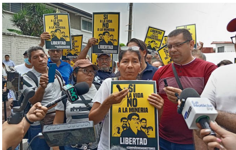
La comunidad Santa Marta y ADES, informa la presentación de la primera apelación ante la Cámara Penal de Cojutepeque en el Caso de los Cinco Ambientalistas de Cabañas, para revertir la decisión del Juzgado de Instrucción de Sensuntepeque.