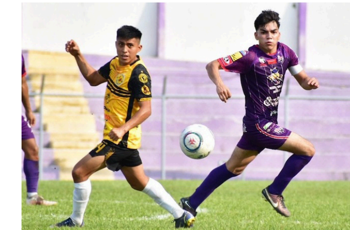
Ex jugadores de Chalatenango reciben indemnización por deuda salarial del equipo extinto.