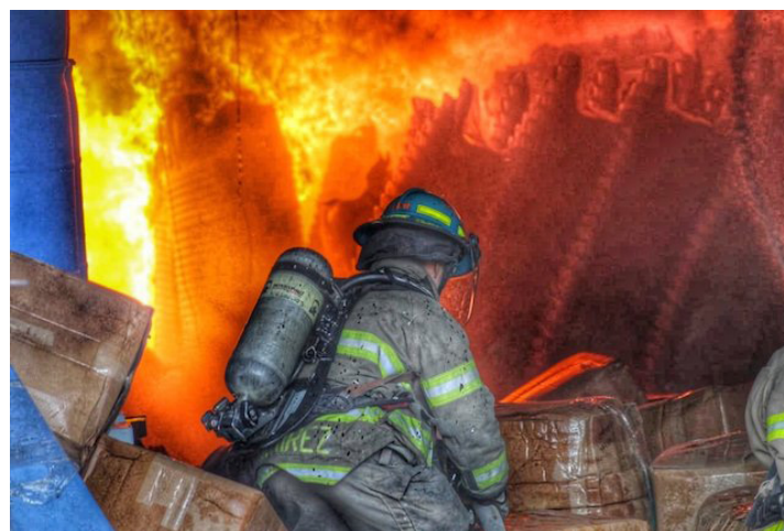
En lo que va del año el Cuerpo de Bomberos ha atendido 2,669 incendios, de los cuales 1,897 ocurrieron en maleza seca.

“En el país, de momento no tenemos un incendio tan importante, en Semana Santa tuvimos uno