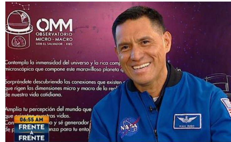
El astronauta de origen salvadoreño, Francisco Rubio, destaca la importancia del aprendizaje continuo para alcanzar metas.

Durante su visita a El Salvador, Rubio compartió su expe-