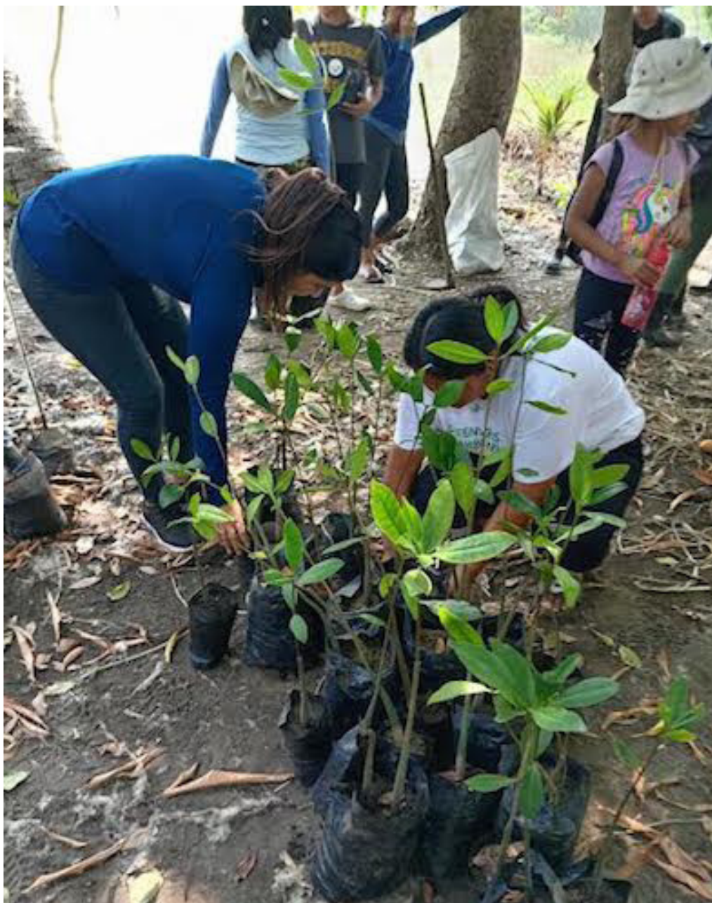
Los jóvenes reforestan la franja del bosque salado conocido como La Brecha en Metalío, a fin de restaurar el bosque salado que provee 3 veces más oxígeno que el bosque dulce.

Los manglares son muy importantes porque aportan tres veces más oxígeno que un bosque dulce, recupera también la reproducción de biodiversidad, ya sea cangrejos, punches, conchas, peces y camarones, también pequeños mamíferos como tacuazines, mapaches y aves migratorias.