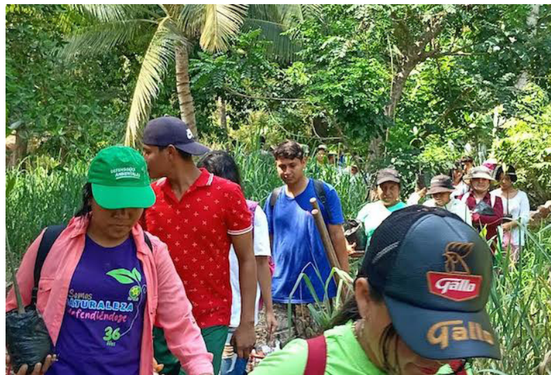
Jóvenes recolectan la basura como botellas, cajas, plásticos y vidrio que dejan los turistas que llegan a la bocana El Sunzita, de la playa Metalío. Para contribuir a un ecosistema limpio.