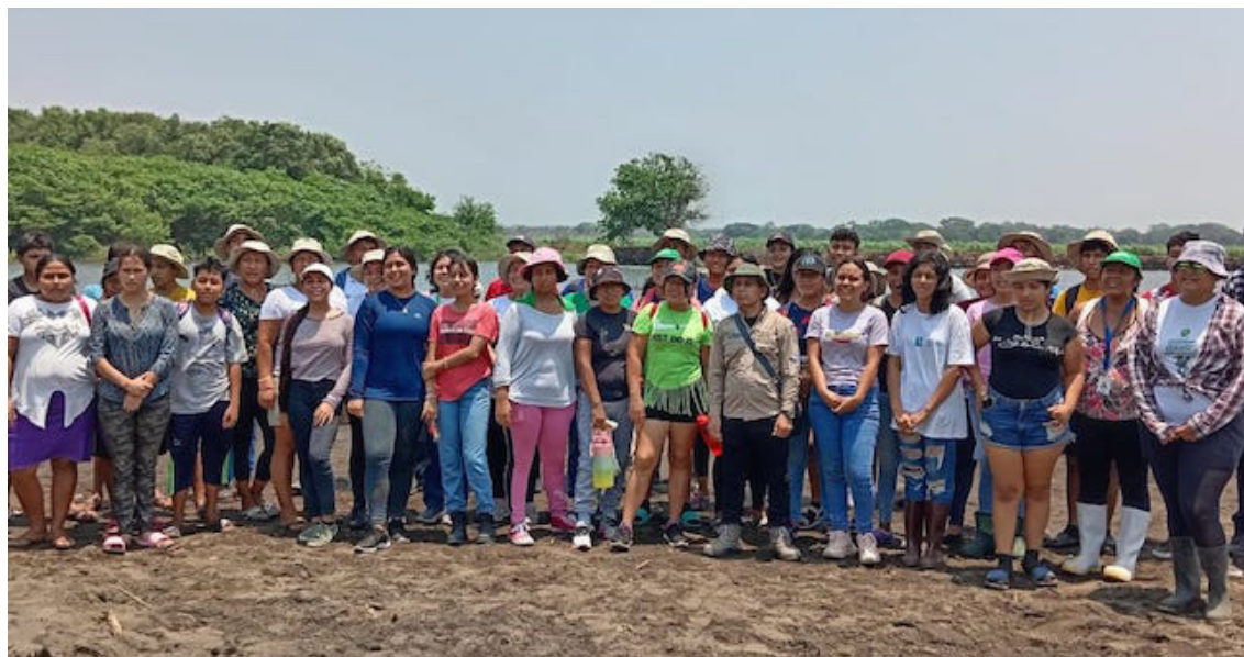
Un grupo de más de 50 jóvenes, defensores ambientalistas, que trabajan junto a la Unidad Ecológica Salvadoreña (UNES), realizan una jornada de reforestación en el bosque salado de Metalío, Sonsonate.

“Recordemos que estos territorios fueron abandonados por el Estado, y bueno, la gen-