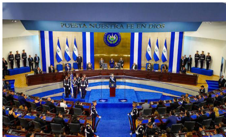
El presidente Bukele tuvo el control de la Asamblea durante toda la legislatura 2021-2021.

La legislatura 2021-2024 está por terminar, y nuevamente muchos de los problemas de la población quedaron en el olvido; esta legislatura dominada por Nuevas Ideas se caracterizó por dar un golpe de Estado, aprobar leyes sin discusión y vía exprés y ser una dependencia más de Casa Presidencial.