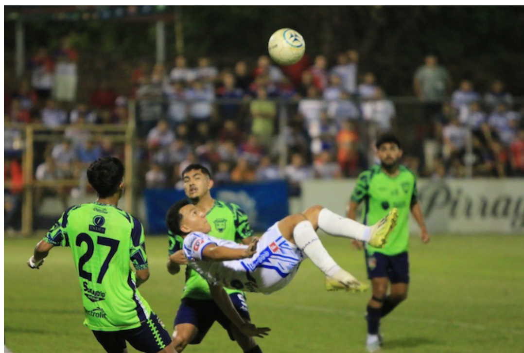
Santa Tecla cae 2 a 1 ante Firpo y desciende a Segunda División en la jornada 21 del torneo Clausura 2024.

Alianza no soltó el liderato otra fecha más, para extender su racha de puntos y se alejó de Firpo 5 unidades en la tabla. Los albos sentenciaron el resultado con el 3 a 1 en el estadio Cuscatlán, gracias a los goles de Sebastián Julio, Iván Macías y Emerson Mauricio. Para el Fuerte que llegó de visita a la capital, únicamente marcó Christofer Galeas a los